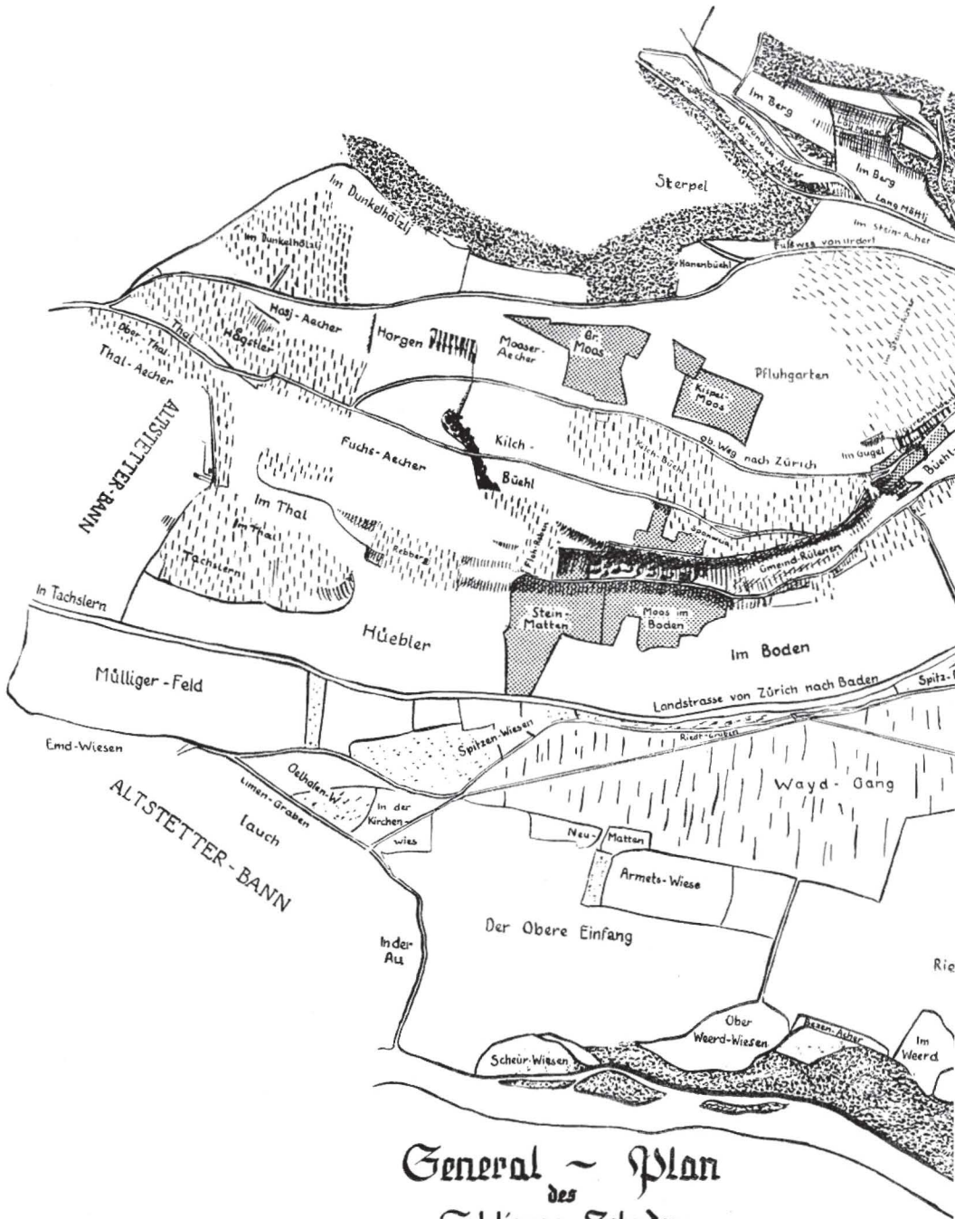
General - Plan des Schlierer-Zehndens von I. Martin Daeñiker 1794