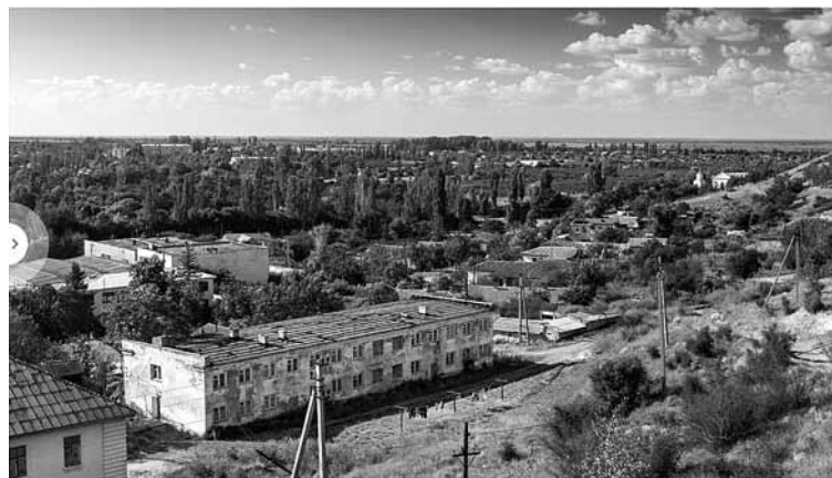
Zürichtal heisst nun Zolotoe Pole. Aufgenommen im Jahr 2012

erschöpft ihr Zwischenziel. Ohne angemessene Winterkleidung und von einer Pockenepidemie heimgesucht, starben etwa 30 Menschen, hauptsächlich Kinder. Trotz dieser schmerzlichen Verluste setzten die Überlebenden ihre Reise am 24. Mai 1804 fort.