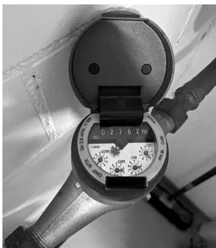
Der Zählerstand auf der Wasseruhr kann künftig mittels QR-Code übermittelt werden.

Alle Eigentümer/Verwaltungen im übrigen Gemeindegebiet erhalten gegen Ende September / Anfang Oktober wie üblich die Ablesekarte per Post zugestellt. Darauf ist der letzte abgelesene Zählerstand ersichtlich. Die Wasserbezüger werden gebeten, den Zählerstand auf der Wasseruhr selbst abzulesen und mittels QR-Code direkt zu übermitteln, somit entfällt die Rücksendung der Ablesekarte innert 14 Tagen. Die Kundinnen und Kunden, welche den QR-Code nicht verwenden möchten, werden gebeten, die Ablesekarte fristgerecht per Post oder elektronisch (s.frick@wvg-mettmenstetten.ch) an die Wasserversorgung zurückzusenden.