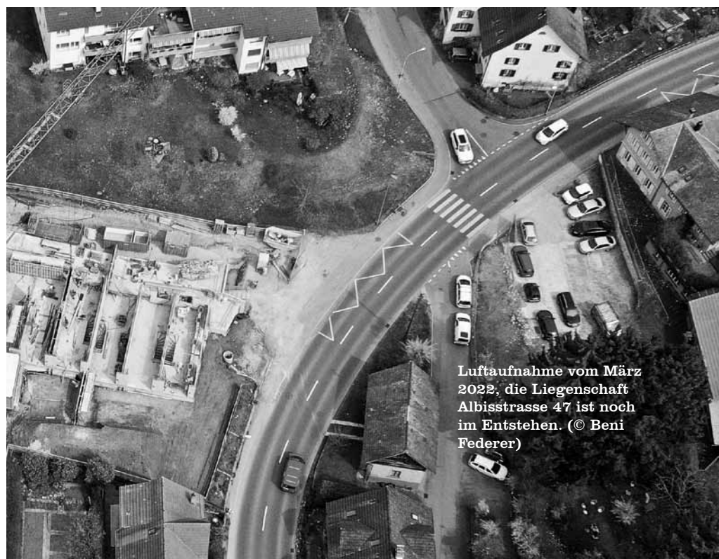
Luftaufnahme vom März 2022, die Liegenschaft Albisstrasse 47 ist noch im Entstehen.