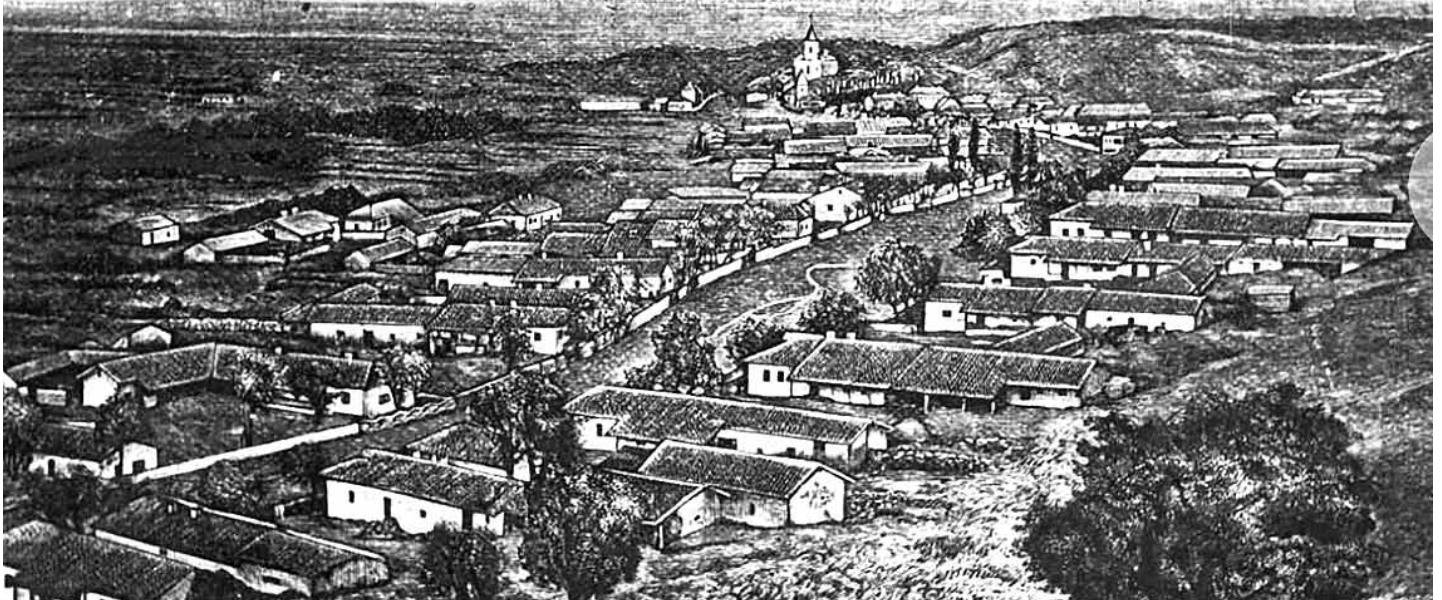
Ausgewanderte aus Mettmensetten und anderen Dörfern nannten ihre Siedlung Zürichtal (Aufnahme um 1910).

Während heute Flüchtlinge aus der Ukraine Zuflucht in Mettmensetten suchen, erinnert uns die Geschichte an eine Zeit, in der Schweizer selbst die beschwerliche Reise in die spätere Ukraine antraten. Anfang des 19. Jahrhunderts verliessen viele Bewohner aus dem Säuliamt und anderen Regionen des Kantons Zürich ihre Heimat und zogen in die Krim, um dort ein neues Leben zu beginnen. Diese Episode der Auswanderung ist eine Erzählung von Mut, Hoffnung und unermüdlichem Durchhaltevermögen.