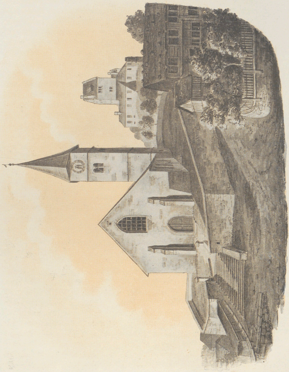
Die alte Kirche von Iffert