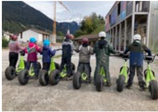
Monstertrotti fahren macht Spass.

waren sehr einfach und andere eher schwer. Dennoch gelang es uns, die meisten zu lösen. Einer Gruppe gelang es Mr. X, besser gesagt Mrs. X, aufzuspüren. Sie erzählte uns, sie hätte Hinweise, wo sich «Kas-