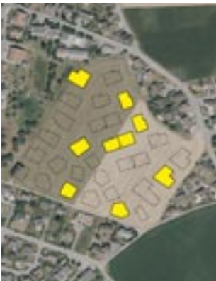
Gelb eingezeichnet sind die 9 Gebäude in den geplanten Massen, welche ausgesteckt werden.

Der Gestaltungsplan wurde von den Bauherren noch in einigen Punkten angepasst und das zugrundeliegende Projekt sieht neu 32 Häuser mit bis zu fünf Geschossen (4 Vollgeschosse, zuzüglich ein Attikageschoss) vor. Erfreulicherweise, und nicht zuletzt dank den Hinweisen von der Interessengemeinschaft Zukunft Winterberg (IGZW), wurden einige Häuser kleiner gestaltet, dafür resultieren 5 zusätzliche Häuser, und alle Gebäude an den Randzonen wurden auf zwei Geschosse plus Attikageschoss reduziert, um eine bessere Anpassung an die bestehenden Gebäude zu ermöglichen.