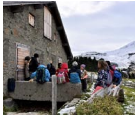
Pause vor der Berghütte

perli» befindet. Mit Mrs. X gingen wir zurück ins Lagerhaus und assen Äplermaccaronen mit Apfelmus zum Z'Nacht. Danach wollten wir mit den Hinweisen Kas-