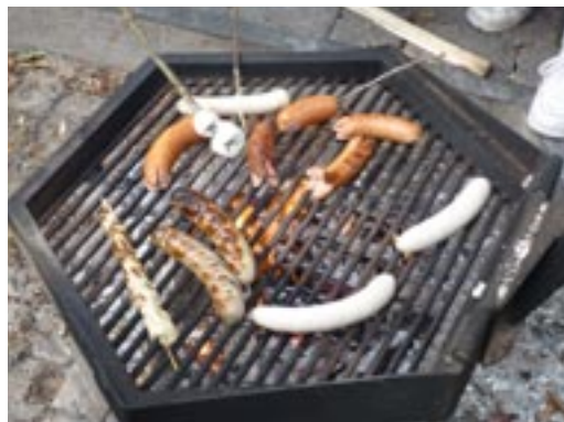
Eine feine Wurst vom Grill darf nicht fehlen.

hausen nach Stein am Rhein. Dort liefen wir vom Bahnhof zum Rhein und wanderten knappe 2 Stunden dem Fluss entlang. Zwischendurch machten wir kleine Pausen. Beim Laufen konnte man sich gut kennenlernen, da wir aus zwei Klassen kommen. Irgendwann trafen wir dann bei unserer Grillstelle