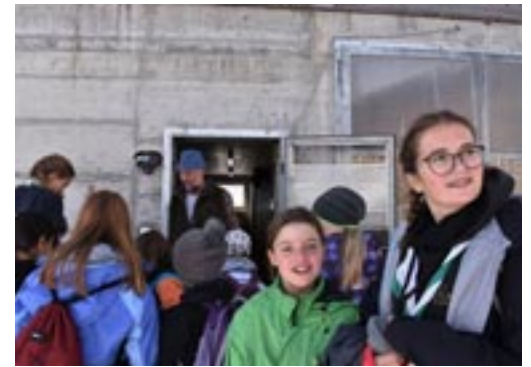
Besuch bei einem Bergbauern

perli anlocken. Mrs. X erzählte uns, dass Kasperli Schokolade liebe. Also assen wir draussen die Schokolade, so dass Kasperli sie riechen konnte. Als Kasperli dann vorbeikam, erzählte er uns Witze. Plötzlich