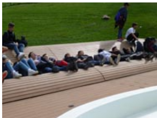
Rast auf der Sonnenliege...

hausen nach Stein am Rhein. Dort liefen wir vom Bahnhof zum Rhein und wanderten knappe 2 Stunden dem Fluss entlang. Zwischendurch machten wir kleine Pausen. Beim Laufen konnte man sich gut kennenlernen, da wir aus zwei Klassen kommen. Irgendwann trafen wir dann bei unserer Grillstelle