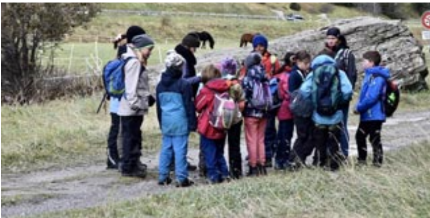
Gemeinsam auf der Suche nach Mr. X

waren sehr einfach und andere eher schwer. Dennoch gelang es uns, die meisten zu lösen. Einer Gruppe gelang es Mr. X, besser gesagt Mrs. X, aufzuspüren. Sie erzählte uns, sie hätte Hinweise, wo sich «Kas-