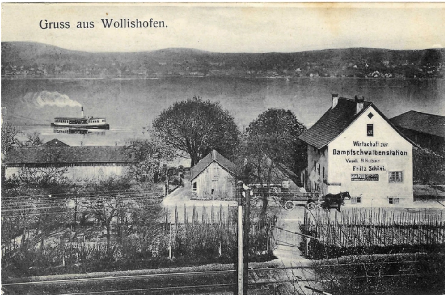
Dampfschwalbenstation. Gelaufen am 2.8.1908.

Auf dem «Übersichtsplan» von Burger&Hofer (1896) ist alles festgehalten: Die Schiff-Station «Huber» sowie die beiden Gebäude der Dampfschwalbenstation – klein, an der Strasse.