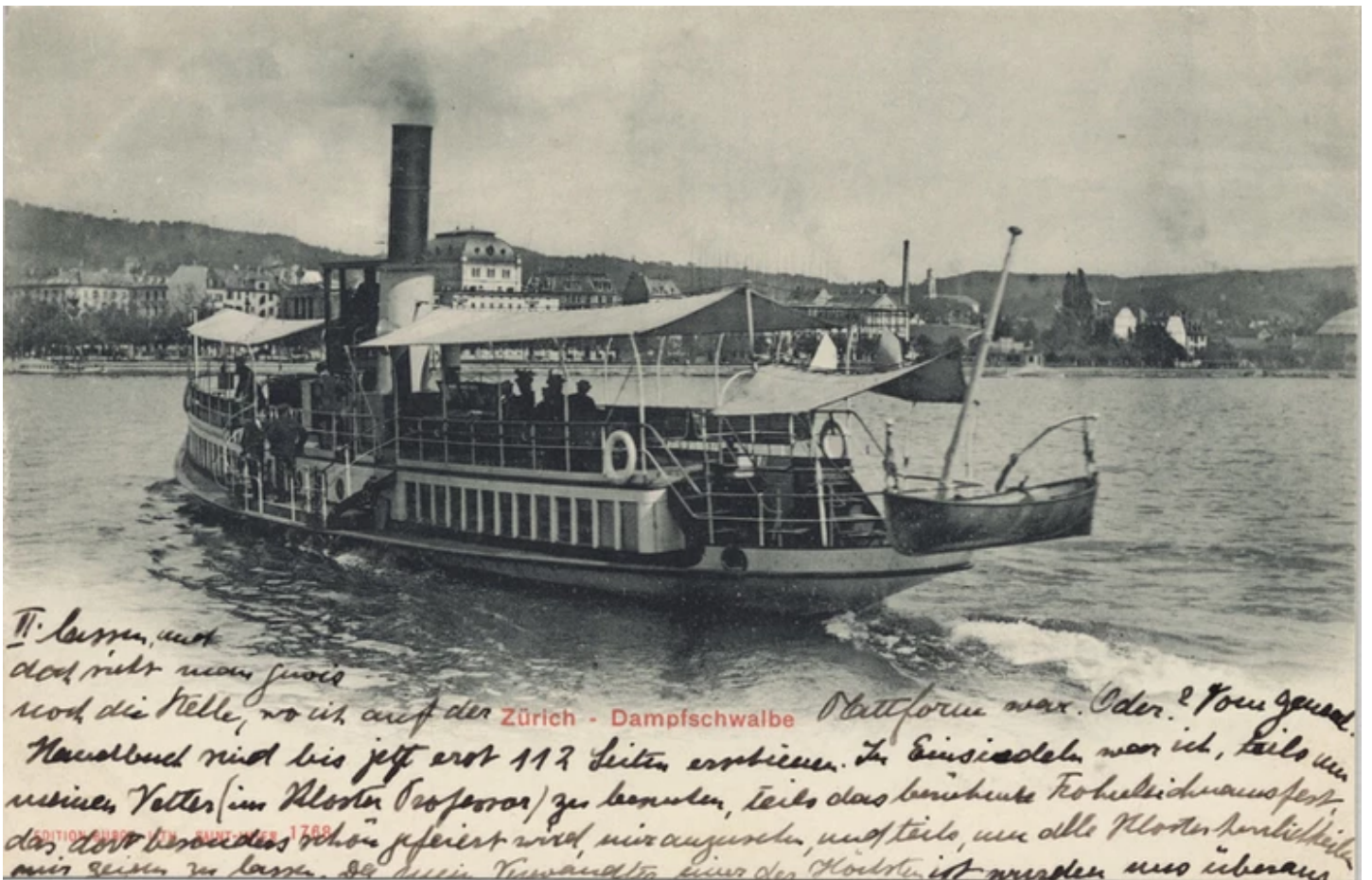
Dampfschwalbe auf dem Zürichsee. Um 1902. Burgy Edition. Baugeschichtliches Archiv Zürich.

Und durch die Dampfschwalbe kam Wollishofen zu einer «Dampfschwalbenstation»!