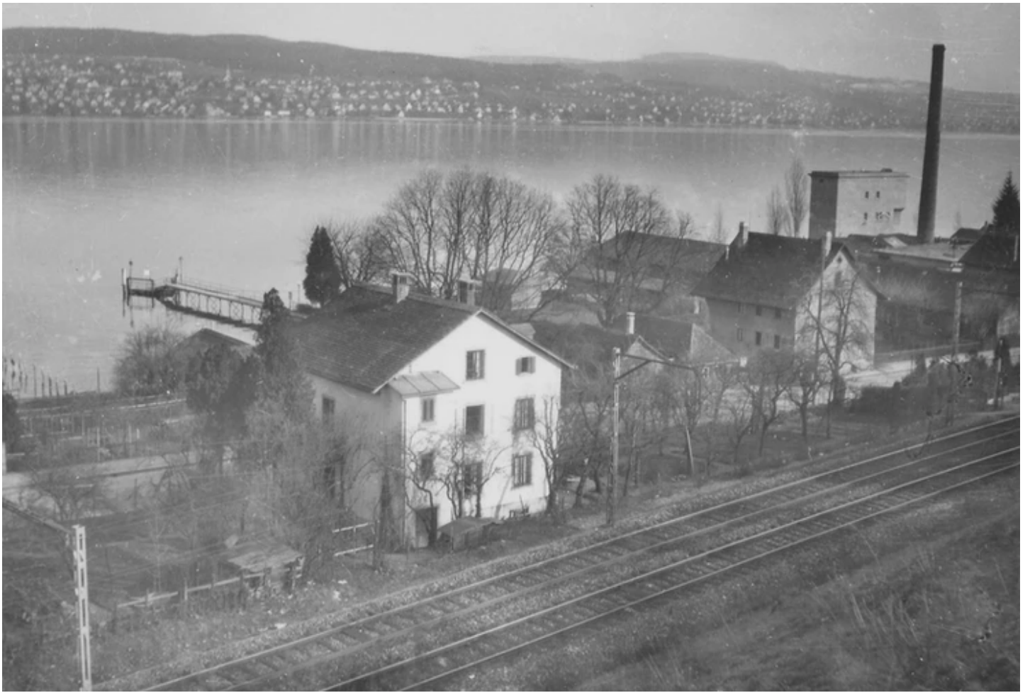
Wollishofer Seeufer vom Hoffnungsweg aus. Um 1935.