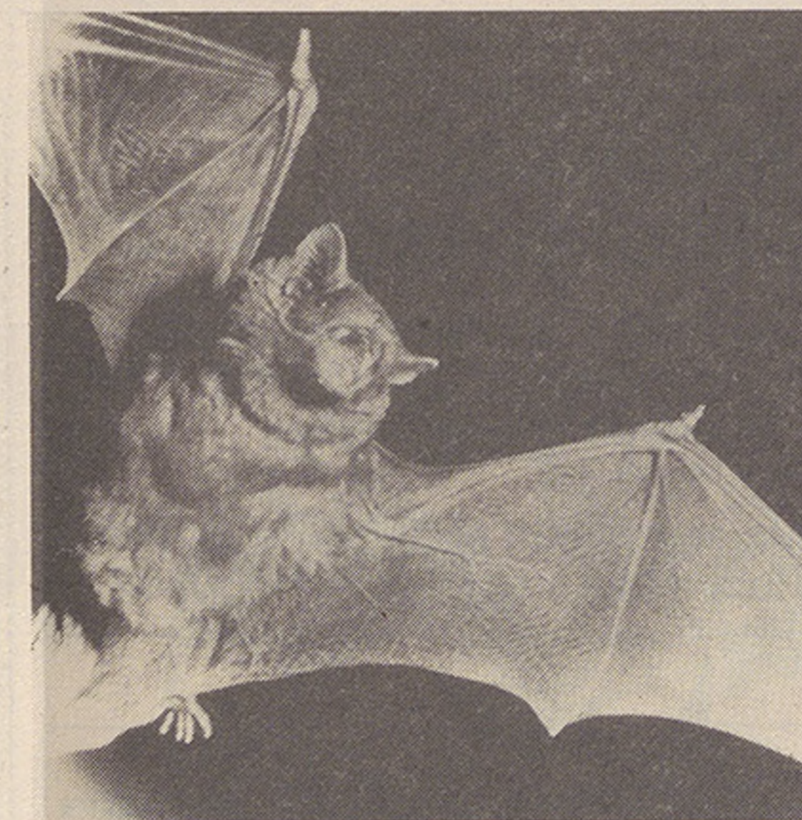
Typische Fledermaus-Silhouette eines fliegenden Abendseglers am nächtlichen Himmel. Wo kommt dieses Tier her – wo fliegt es hin? Das Gartenbauamt der Stadt Zürich lässt durch die Koordinationsstelle für Fledermausschutz die Fledermausvorkommen in der Stadt abklären.

Während einige Fledermausarten tagsüber in ruhigen Dachstöcken ruhen, haben sich andere Arten darauf spezialisiert Baumhöhlen als Tagesschlafquartiere auszunutzen.