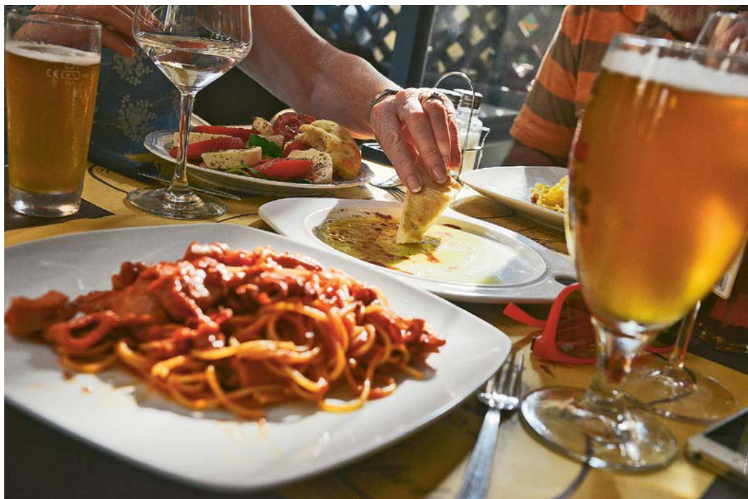
Bier ist nicht nur Durstlöscher, es passt auch zum Essen.