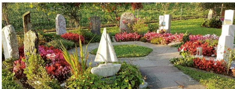
Friedhof im Sommerflor.