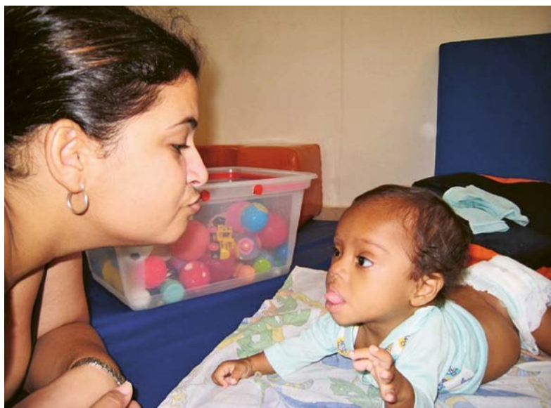
Heilpädagogisches Werk Aluna.