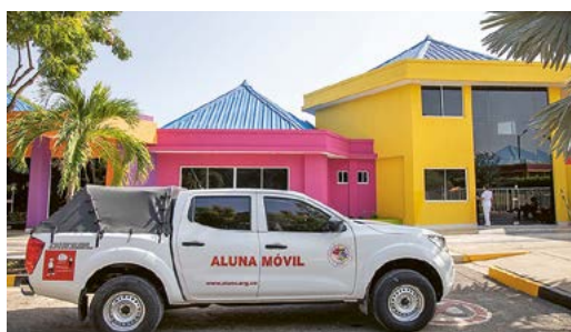
Heilpädagogisches Werk Aluna.