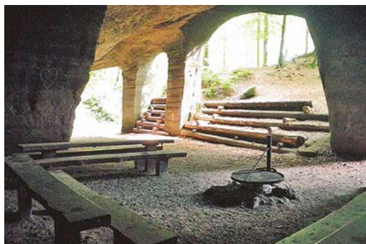
Imposante Sandsteinhöhlen.