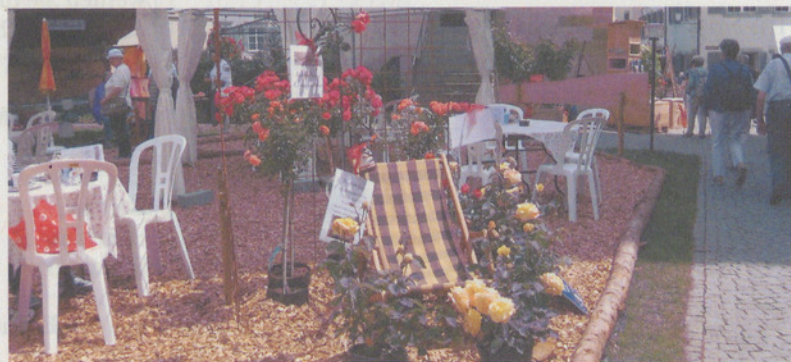
Rosen, wohin man auch blickt ...