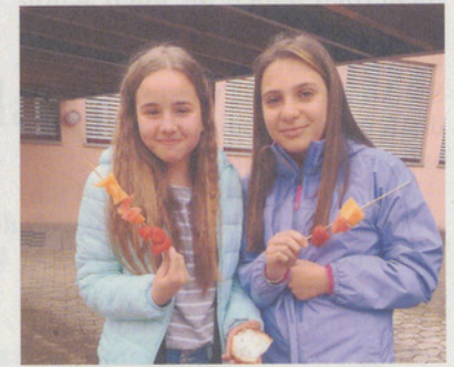
Für den Znüni verarbeiteten die Kindergärtler kiloweise Früchte.