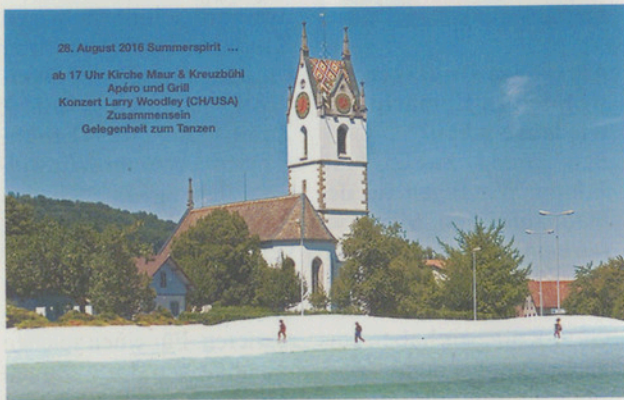
28. August 2016 Summerspirit ... ab 17 Uhr Kirche Maur & Kreuzbühl Apéro und Grill Konzert Larry Woodley (CH/USA) Zusammensein Gelegenheit zum Tanzen

Im August ist es wieder so weit – die sommerlichen Tage und Nächte werden mit einem fröhlichen Fest in der Kirche und im Kirchgemeindehaus Kreuzbühl in Maur ausklingen. Eine musikalische Besinnung, Zusammensein bei einfachem