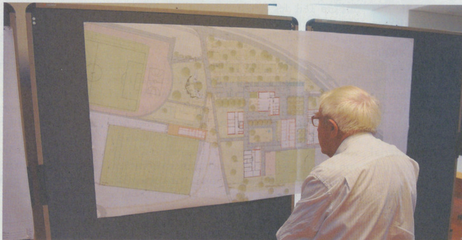
Ein Bild mit Symbolcharakter: Praktisch nur Senioren interessierten sich für die Orientierung. Junge suchte man vergeblich im Loorensaal.

Die seit längerem auf der Agenda stehende Orientierung über das Loorenprojekt fand am letzten Montag im Loorensaal statt. Der gesamte anwesende Gemeinderat informierte umfangreich über das Vorhaben und gab zahlreichen interessierten Rednern die Gelegenheit, ihre Sichtweise zum Projekt dem nicht sehr zahlreich erschienenen Publikum darzulegen. Die Veranstaltung dauerte recht lange und war erst um 23.00 Uhr beendet.