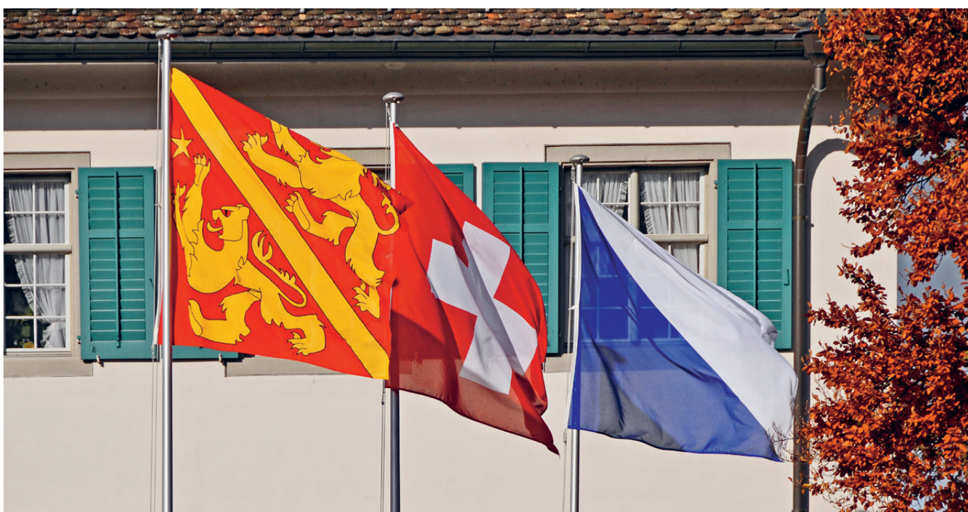
Schloss Andelfingen mit Beflaggung