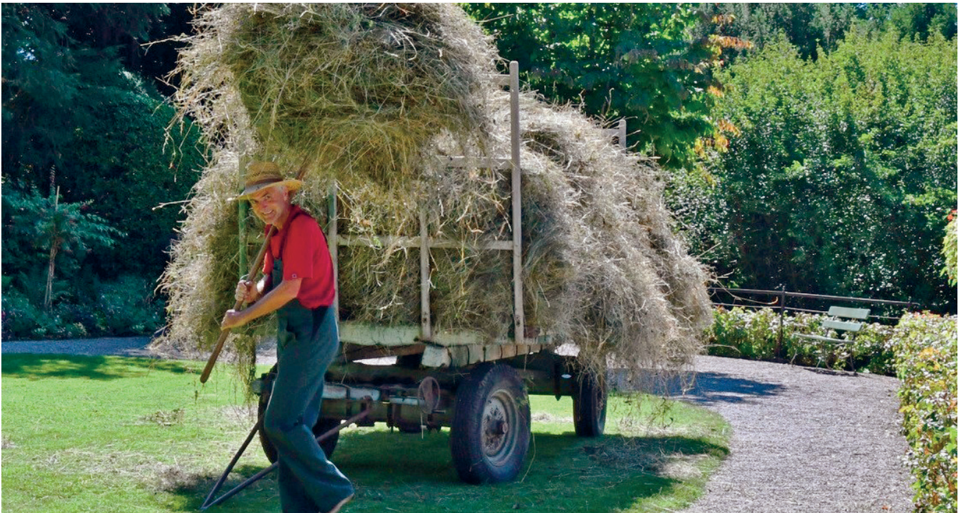
Der Schlossgärtner bringt das Heu ein