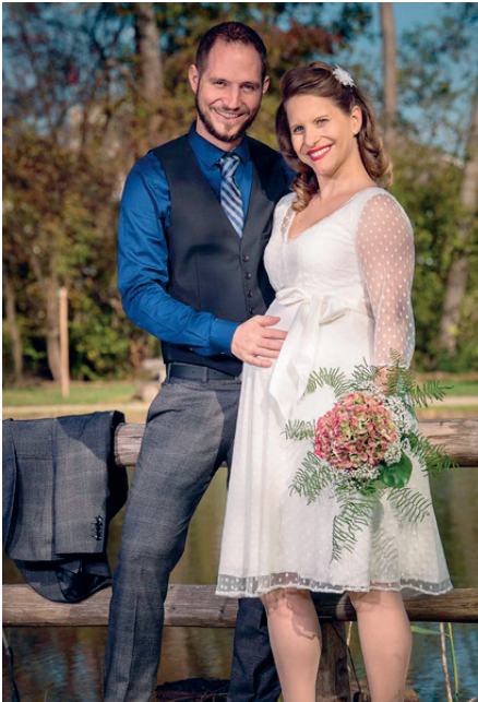
Das glückliche Paar