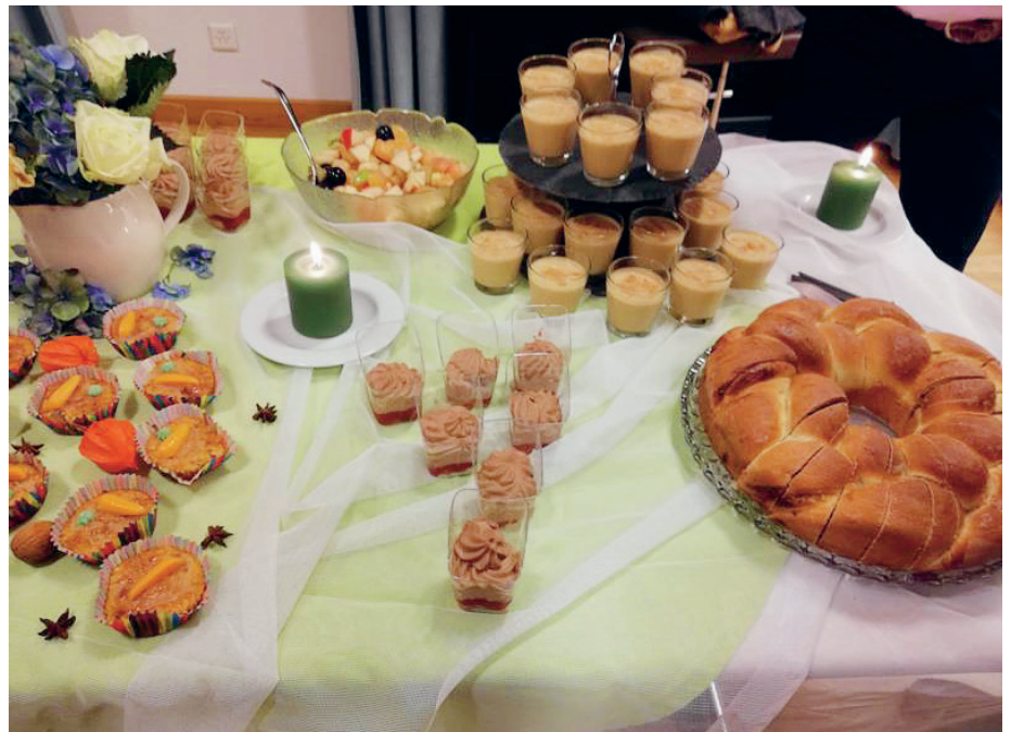
Da läuft einem das Wasser im Mund zusammen – ein Dessertbuffet wie es im Buche steht!