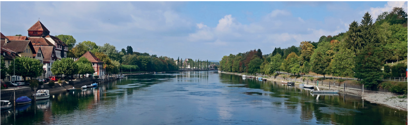
Wunderschöne Aussicht von der Holzbrücke in Diessenhofen

Nach dem Kaffee und Dessert bestiegen wir wieder unser Postauto (dank des schönen Wetters mit geöffnetem Schieberdach) und begaben uns nach Stein am Rhein. Während einer gut einstündigen, wunderschönen Schifffahrt