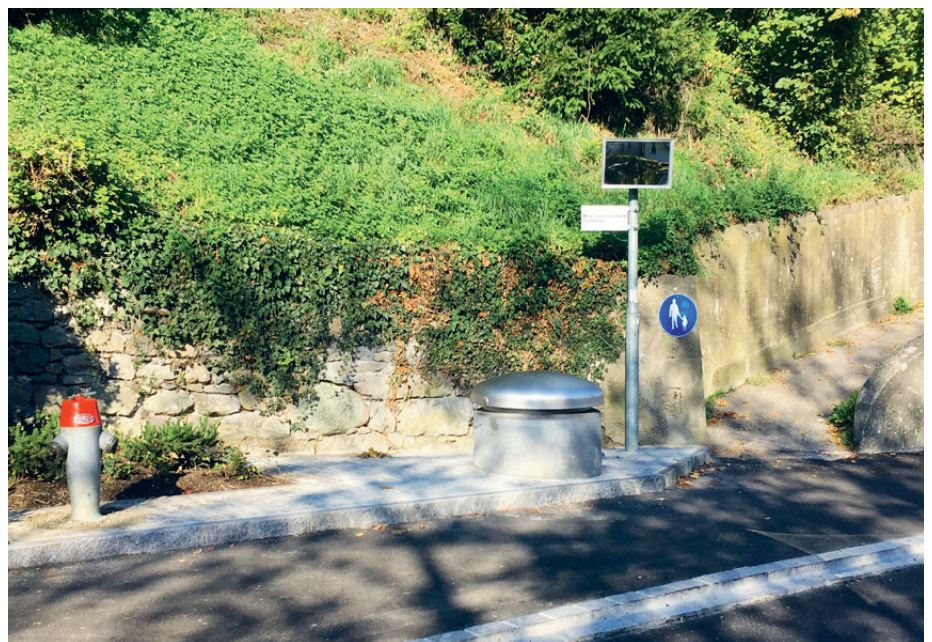
Der neue Schieberschacht von aussen

Die neue Anlage dient der Versorgung der Bevölkerung mit Trinkwasser. Konkret wurde die Versorgungssicherheit für diejenigen, die unterhalb der Bahnlinie und damit in der unteren Druckzone der Andelfinger Wasserversorgung leben, signifikant erhöht. Bis anhin konnte die untere Druckzone nämlich nicht durch die obere Druckzone mit Trinkwasser versorgt werden. Grund dafür war, dass im alten, engen und