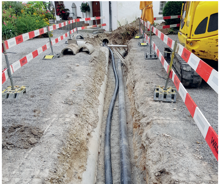
Der Graben quer über dem Schlossplatz

Der Stiftungsrat ist in sehr guter Zusammenarbeit mit dem Gemeinderat bemüht, die verschiedenen Schossliegen-