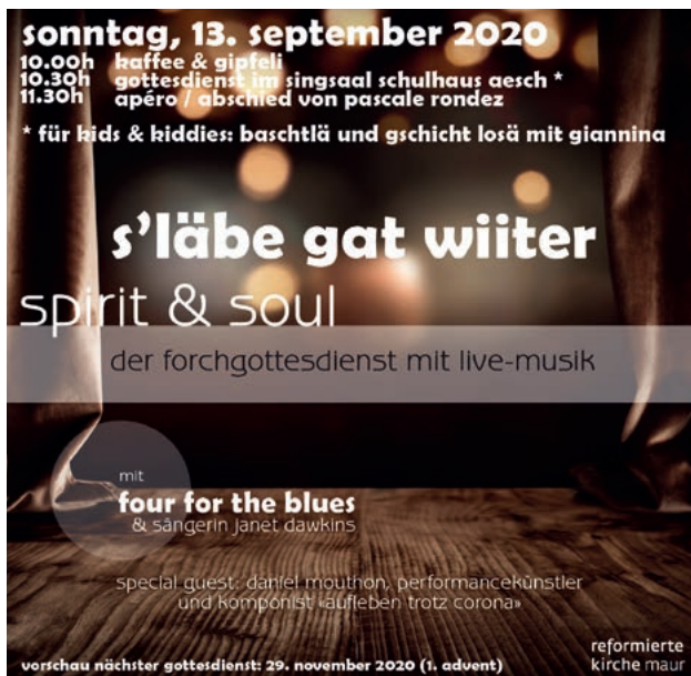
Flyer spirit & soul.