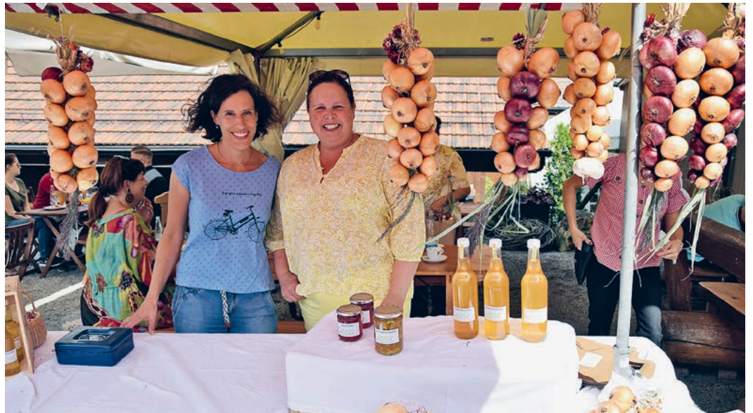
Die Zwiebelzöpfe des Frauenvereins waren schon am frühen Nachmittag fast alle verkauft.