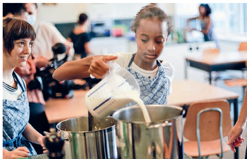
Klimaschonend einkaufen oder kochen erfordert Wissen: lehrreicher Postenlauf für Looren-Schüler.