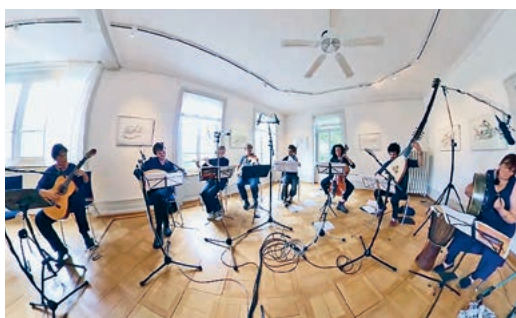
Ensemble mit Renaissance- und Barockmusik.

Das Ensemble Barock Nord West ist eine Gruppe von Musizierenden, die sich der weitgehend unbekannteren alten Musik aus dem Norden und Nordwesten Europas verschrieben haben. Die Lieder und Tänze stammen vorwiegend aus der Renaissance- und Barockzeit um 1530 bis ca. 1770, aufgeschrieben in Manuskripten oder von Komponisten meist nur als einstimmige Melodie festgehalten. So ist es möglich, dem Stück durch die Instrumentenbesetzung (u. a. Renaissancelaute, Barockgitarre und Theorbe) einen zum Ensemble passenden Charakter zu geben. Geprägt von den rauen Küstenlandschaften des Nordwestens erzählt die Musik vom entbehrungsreichen Leben der Menschen, von ihren Träumen und ihrem unbändigen Willen, durch Lieder und Tänze