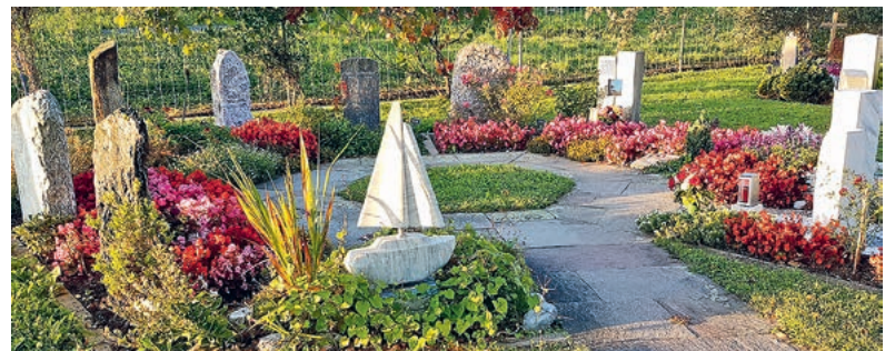
Friedhof im Sommerflor.