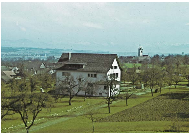
Als das Schulhaus gebaut wurde, stand es noch am Dorfrand.