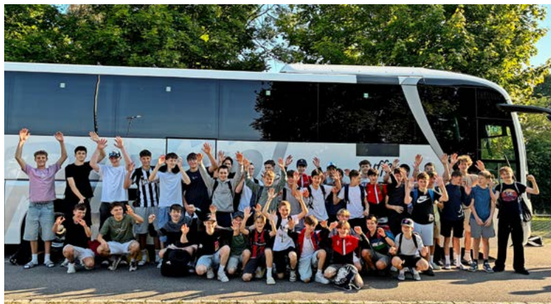
Tatendrang: Die Pfannis bei ihrer Abfahrt in Egg.

Vom 19. bis 22. Juni reiste der UHC Pfannenstiel mit insgesamt 41 Jugendlichen und sechs Betreuenden nach Klagenfurt (Österreich) an die «United World Games». Bei diesem internationalen Turnier messen sich jugendliche Sportlerinnen und Sportler in zehn unterschiedlichen Sportarten, eine davon ist Unihockey. Die Pfannis waren überaus erfolgreich: Drei von vier Teams kehrten mit einer Medaille im Gepäck heim. Eines der beiden U13-Teams erreichte sogar Gold.