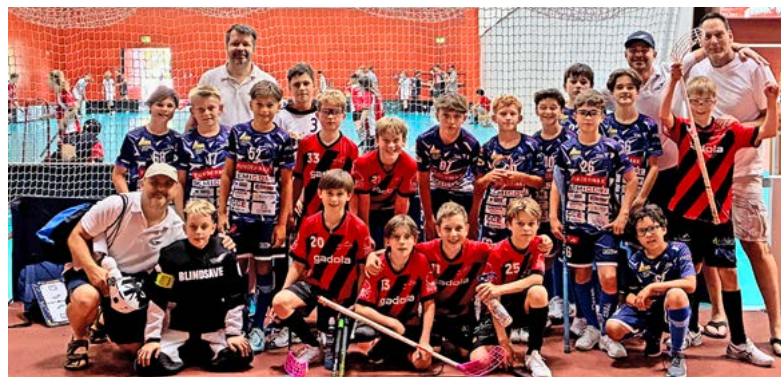
Die U13 II (in Rot) mit dem gegnerischen Team VS Villach, Österreich.

Senioren1-Ganztages-Wanderung am 1.7.2025