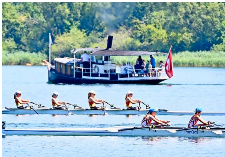
Die einen rudern um die Wette, die andern dampfen gemächlich vor sich hin...

Am letzten Wochenende fand auf dem See die Nationale Regatta Greifensee im Rudern statt. Knapp 1000 Ruderer und Ruderinnen zwischen 12 und etwa 50 Jahren waren am Start und fuhren zwischen Badi Egg und Maur Schiffflände um die Wette.