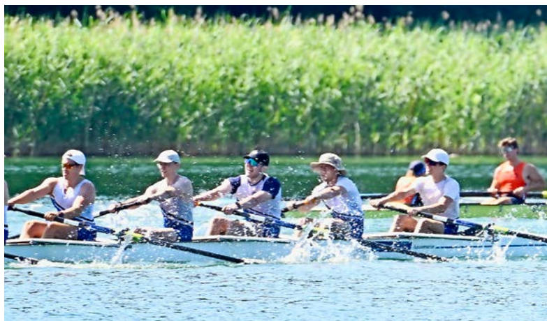
Teamsport mit Technikansprüchen.

ist – anders als etwa ein Fussballspiel mit 90 Minuten Matchdauer, 22 Spielern, zwei Toren und einem Ball – nicht so wirklich zuschauerfreundlich auf einen klaren Höhepunkt hin konzipiert. Nein, die Greifensee-Regatta dauert zwei volle Tage, 39 Ruderclubs nehmen dieses Jahr teil, die Teams messen sich in unzähligen Kategorien. Allein am Samstag werden 55 Rennen ausgetragen. Nach dem Start der sechs Boote der «Einer Junioren U17» folgen sieben Minuten später schon die «Doppelzweier Masters Männer» nach. Und so geht es den ganzen Tag über weiter. Die Rennstrecken von Uessikon/Badi Egg her Richtung Maurmer Schiffflände sind je nach Alterskategorie 1000