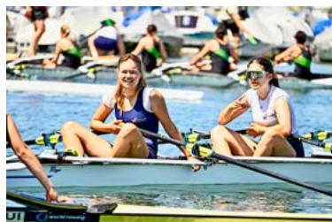
Viel Sonnenschein, bestes Wetter.