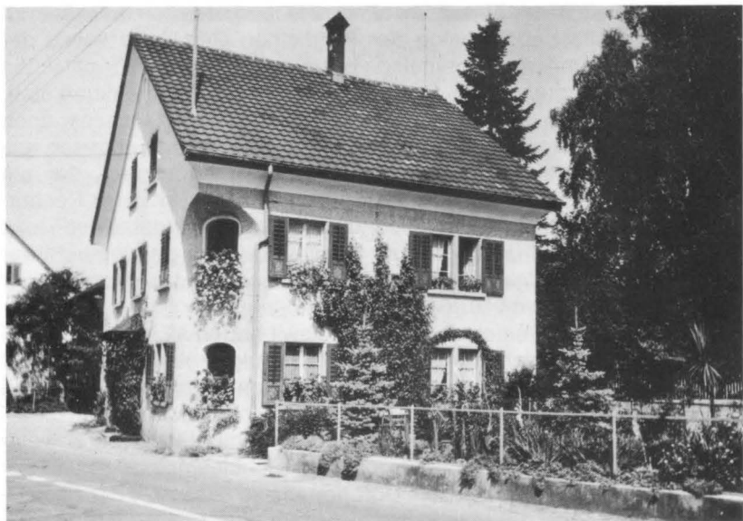
Gegenüber dem heutigen Kirchgemeindehaus an der Zentralstrasse steht dieses frühere Bauernhaus, das einst Adolf Graf-Stutz gehörte. Hier wirkte er von 1913 bis 1944 als Gemeindeschreiber von Volketswil (Politische Gemeinde), Zivilstandsbeamter und Sektionschef.