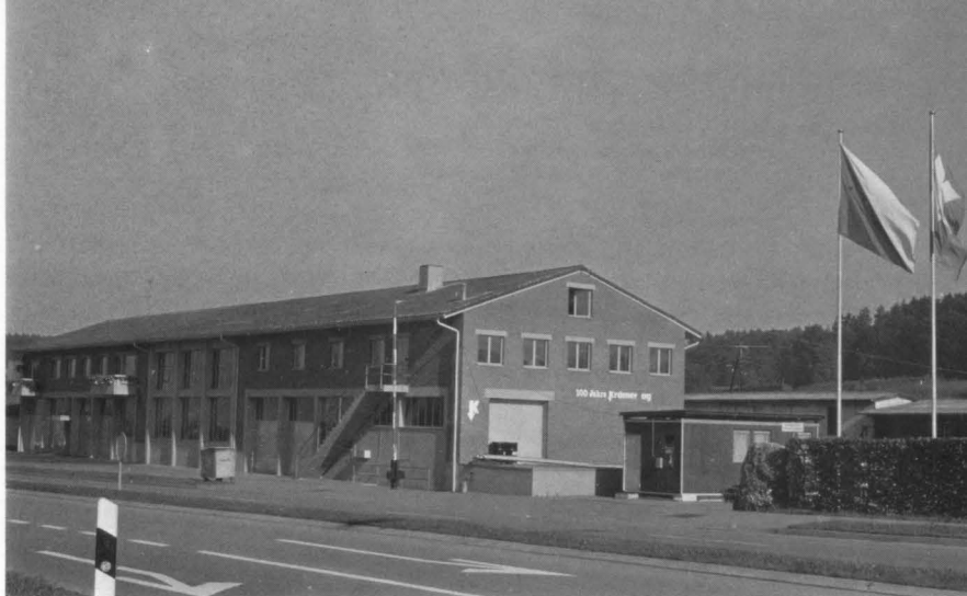
Der Werkhof in Hegnau