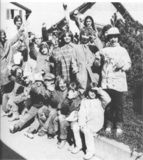
Im ersten Einsatz: Schulklasse 3e, Feldhofsulhaus.