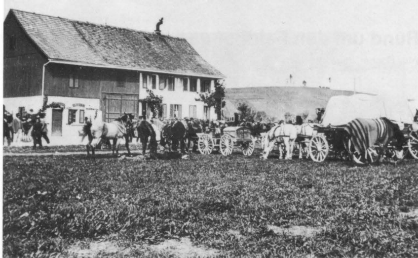
Aufnahme von 1900 anlässlich des grossen Truppenzusammenzuges. Hinten die rebenbewachsene Huzlen, gekrönt von Pappeln und einer noch jungen Linde.