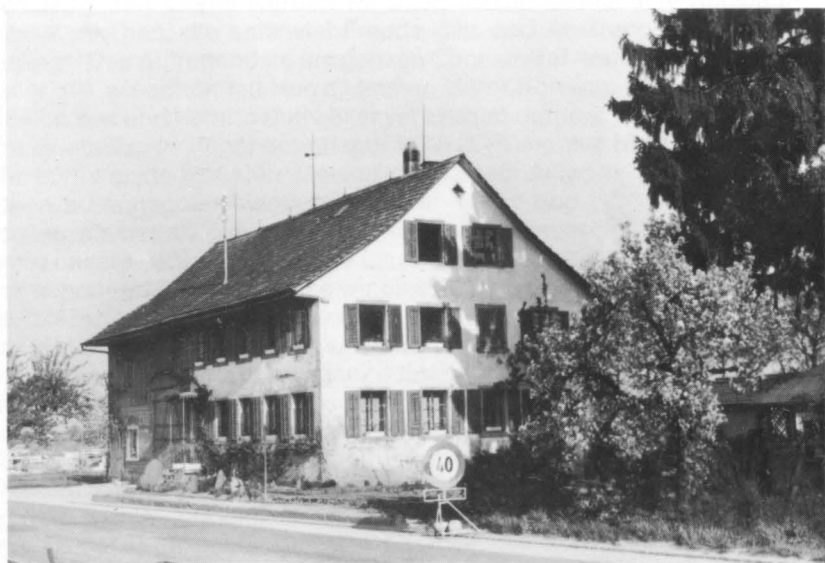
Bild von 1966. Das seit Mai 1956 unbewohnte Haus verlottert allmählich. Man beachte die Geschwindigkeitsbeschränkung. Im Hintergrund sind die ersten Bauarbeiten im Sunnebühl im Gang. Im Rahmen der Übung einer Luftschutzkompanie wird das Gebäude am 13. September 1967 gesprengt. Unmittelbar vorher hatte man in einer Ecke noch einen grossen, alten Tresor entdeckt, der dort aus Platzgründen abgestellt worden war. Er enthielt die alten Akten der ehemaligen Zivilgemeinde Volketswil.