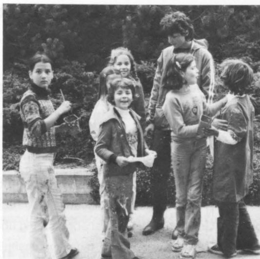
Im zweiten Einsatz: Gruppe aus Schulklasse 4a, Feldhofsulhaus, mit Malgruppe Volketswil.