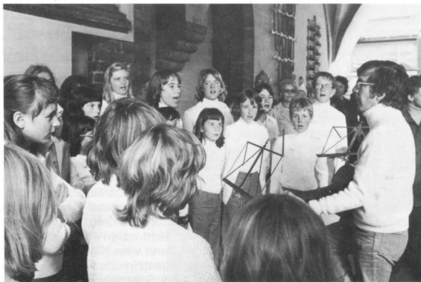
Jugendchor Volketswil: Konzert in Lübeck.