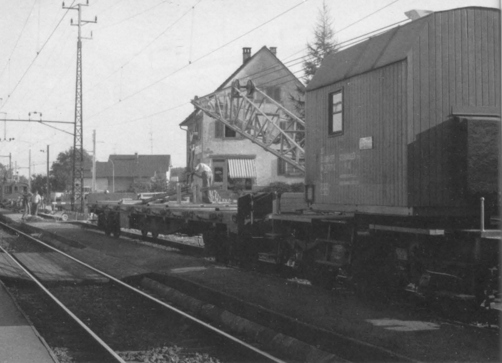
Oktober 1981 im Bahnhof Schwerzenbach. Ein Schienenkran lädt Querträger und Joche für die Fahrleitung des zweiten Geleises vom Tiefladewagen. Im Hintergrund das inzwischen ersetzte Gestänge der Übertragungsleitung, an dem die alte Oberleitung befestigt war.

überall dort, wo der Zug ihre Gemeinden durchfuhr, zum Gruss bereitgestanden sein. An diesem Tag wurde auch die Fahrleitung unter Spannung gesetzt, und zwar ab 10.30 Uhr, wie dem Merkblatt der SBB vom 26. September 1932 zu entnehmen ist. Warnend fährt das Merkblatt fort, von diesem Zeitpunkt an sei die Fahrleitung dauernd als unter Spannung stehend zu betrachten und ihre Berührung lebensgefährlich.