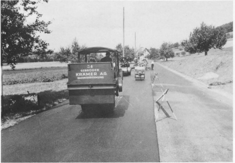
Teerwalzen einst und heute, 1955 und 1980