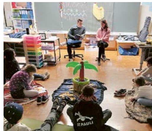
Vorlesezeit an der Lesenacht.