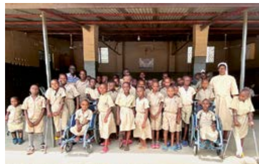
Brieffreundschaften der Aeschmer Schülerinnen und Schüler mit Viertklässlern in Burundi.