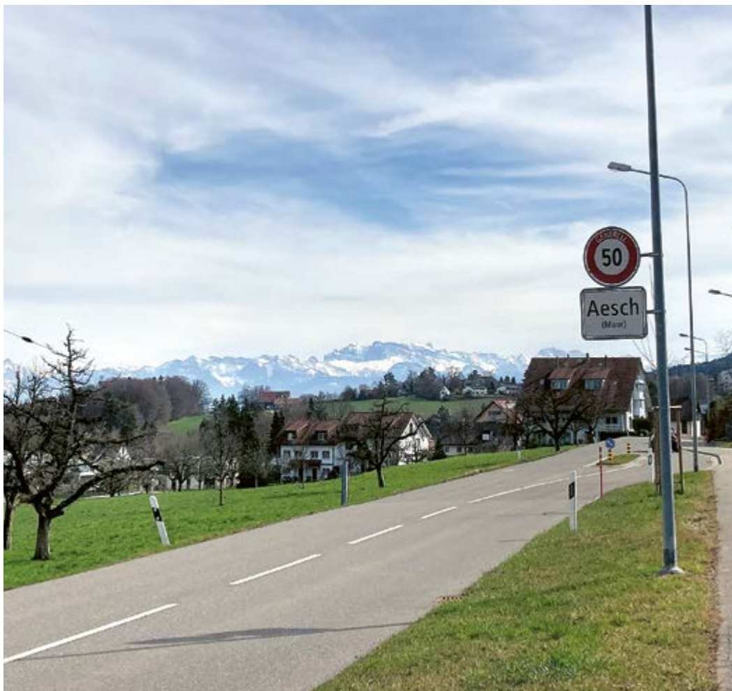
Unterschätztes Kleinod: der Ortsteil Aesch/Scheuren/Forch.