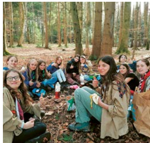
Abenteuer erleben an frischer Luft: die Maurmer Pfadfinderinnen im Wald.

Selbstverständlich darf man sich auch durchs Jahr hindurch melden, wenn ein Kind Interesse an der Pfadi hat: ✉ al@pfadimuur.ch , www.pfadimuur.ch