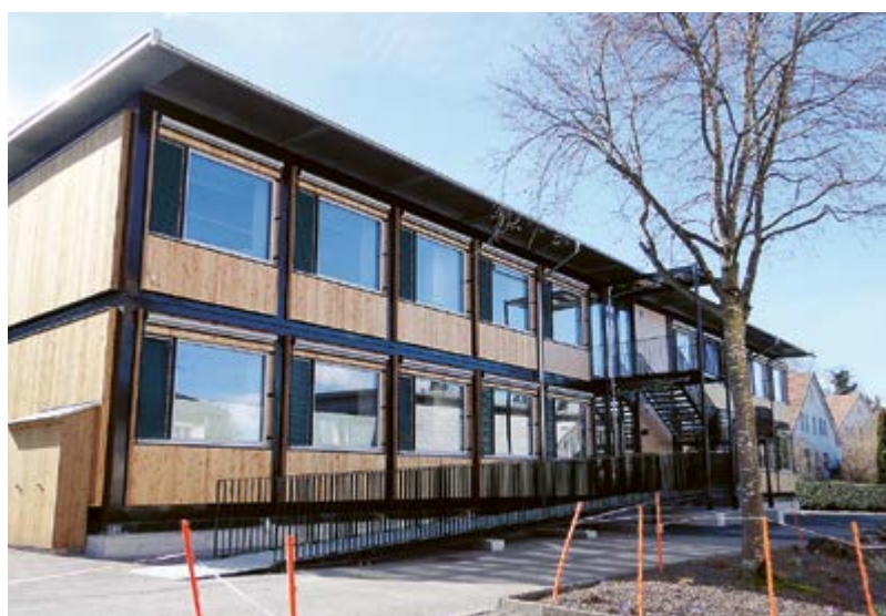
Der Pavillon – zusätzlicher Schulraum bei der Schule Pünt