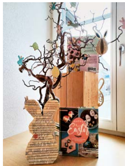
Ostern steht vor der Tür.