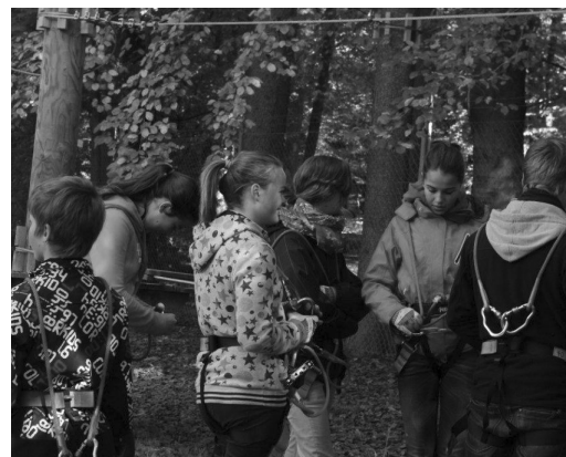
Action pur für all die Kletterbegeisterten.

Am 31. März 2012 öffnete der erste Seilpark im Kanton Zürich am Schluefweg in Kloten seine Tore. Grosse und kleine Kletterfreunde können ihre Geschicklichkeit, Koordination, Mut und Ausdauer testen. Erfahrene wie unerfahrene Kletterer kommen voll auf ihre Rechnung – teils müde – jedoch zufrieden und stolz auf ihre Leistung.