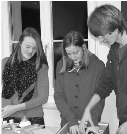
Helfende Hände im Einsatz.