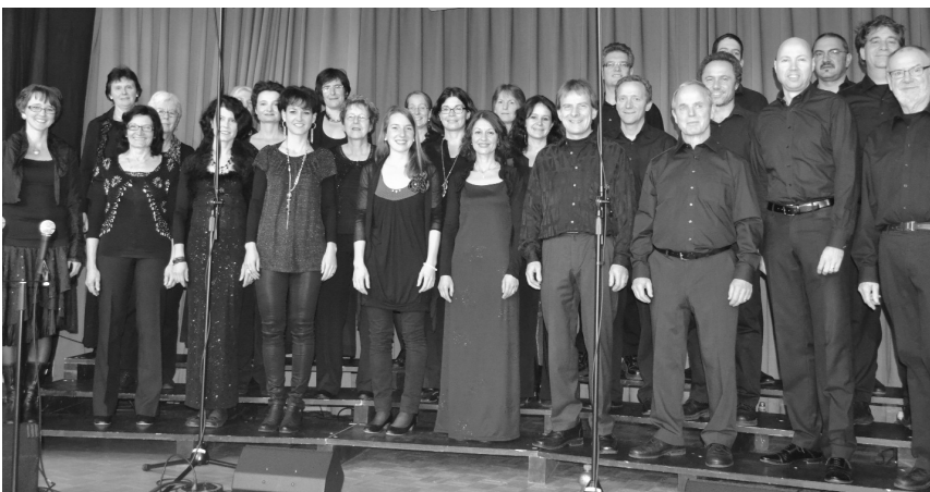
Zog den zum Bersten vollen Bucksaal ganz in seinen Bann: der Gospelchor Lindau.

Unterstützt wurde der Chor wie jedes Jahr von professionellen Musikerinnen und Musikern. Ob Gitarre, Schlagzeug, irische Flöte, Saxophon, Bassgitarre, Keyboard oder Percussion, das Zusammenspiel Musiker Chor harmonisierte perfekt.