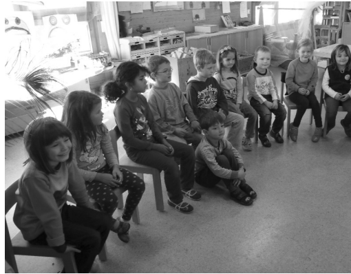
Freuen sich auf den Räbeliechtlumzug: die Kinder aus dem Kindergarten Lindau.

Am 2. November fand der Räbeliechtlumzug statt. Beim Schnitzen der Räben durften wir, die 4. Klässler des Schulhauses Buck, den Kindergartenkindern helfen. Wir liefen am Morgen um neun Uhr vom Schulhaus Buck nach Lindau in den Kindergarten. Als wir ankamen, durfte jeder von uns ein Kindergartenkind aussuchen, dem wir dann beim Schnitzen halfen.