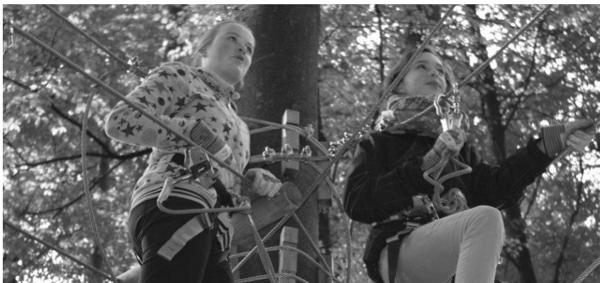
Volle Konzentration in den Seilen.

Am 31. März 2012 öffnete der erste Seilpark im Kanton Zürich am Schluefweg in Kloten seine Tore. Grosse und kleine Kletterfreunde können ihre Geschicklichkeit, Koordination, Mut und Ausdauer testen. Erfahrene wie unerfahrene Kletterer kommen voll auf ihre Rechnung – teils müde – jedoch zufrieden und stolz auf ihre Leistung.