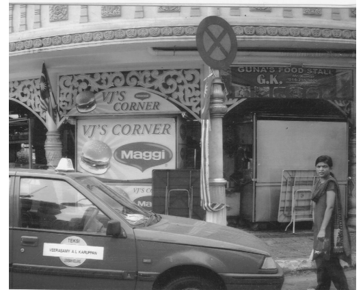
Auf der ganzen Welt bekannt: Maggi.

Der Verein «LindauLebt» erhielt als Überraschung eine «Maggi-Karte» aus Kuala Lumpur, Malaysia. Erstaunlich, wo man überall den Namen Maggi finden kann!