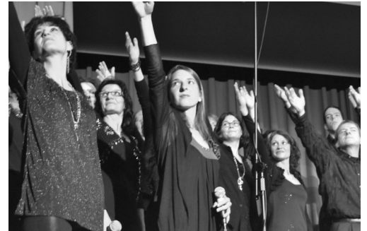
Voller Leidenschaft und Freude.

Gemeinsam mit dem Publikum stimmte man sich auf Weihnachten ein und «A star is shining tonight» klang durch alle Sitzreihen. Mit der Zugabe «Born again» kochte der Saal über. Stühle wurden weggeschoben, es wurde im Rhythmus geklatscht und so manch einer hätte ewig zuhören können.