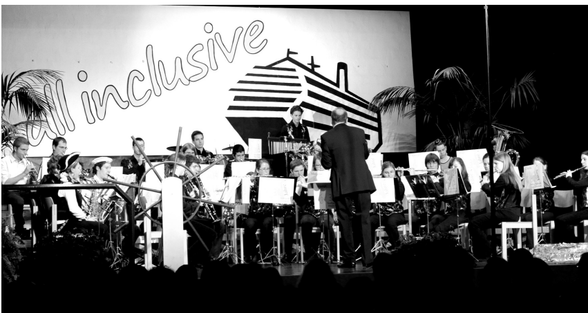
Begeisterte den vollen Saal mit ihren Klängen.