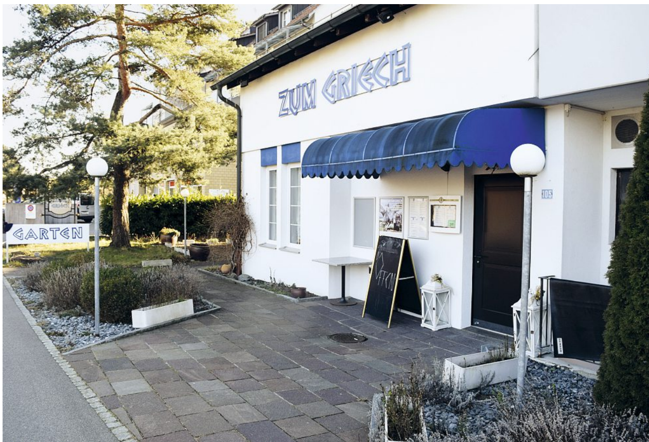
Schliesst bald seine Türen: das Restaurant Zum Griech im Zentrum von Ebmatingen.