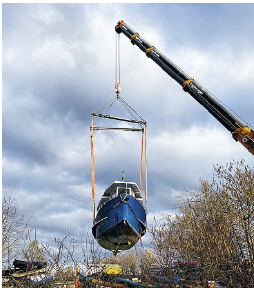
Ein regelrechtes «Luftschiff».