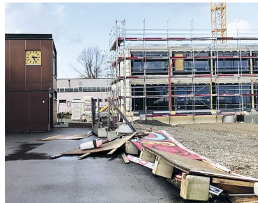
Umgekippte Baustellenwände auf der Looren.

Als auch bei uns in Maur am Montag zur Schulweg-Zeit noch ein heftiger Sturm tobte und manch ein Baum sich bedrohlich bog, entschlossen sich doch einige Eltern dazu, ihre Kinder zu begleiten oder mit dem Auto in die Schule zu chauffieren. Offenbar hat «Sabine» auch einzelne Elemente der Baustelle der Schule Looren umhergewirbelt. Die Schule beschloss darum, den Schulbetrieb für Montag Nachmittag und