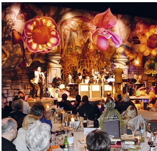
Ein Rekord: 24 Leute auf der Bühne.