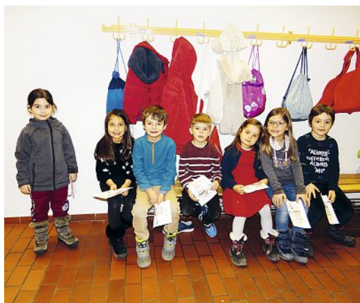
Freudige Erwartung auf die ersten Geschichten.