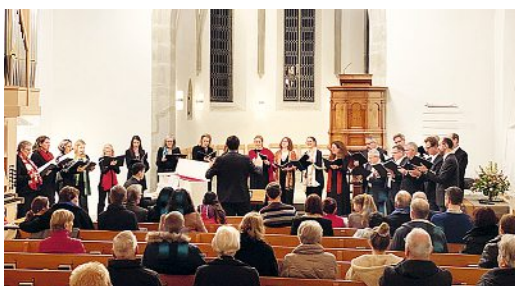
Der Maurmer Erwachsenenchor.