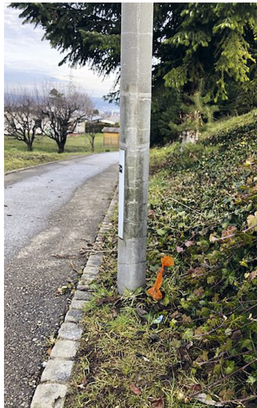
Wenn der Kot schon ins Säcklein verpackt wird, warum nicht gleich in den Eimer damit?

Auf der Gemeinde-Homepage steht zur Hundehaltung unter anderem: «Orte mit Zutrittsverbot und genereller Leinenpflicht beachten, Kot korrekt beseitigen (...)» Und: «Gestützt auf Artikel 88 des Gebührentarifs der Gemeinde Maur ist die Höhe der Abgabe pro Hund und Kalenderjahr CHF 170.00.» Davon gehen 140 Franken an die Gemeinde, der Rest an den Kanton.