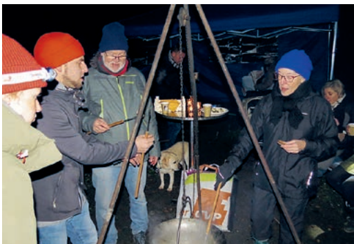
Ein familiärer Abend. Bild: zVg