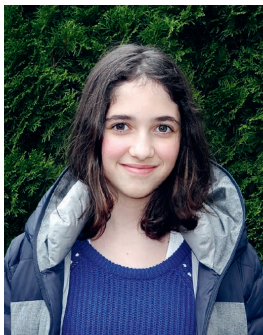
Aurora will auf die Bühne.