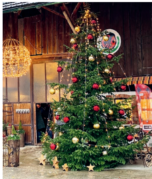
Wunderschöner Weihnachtsbaum.