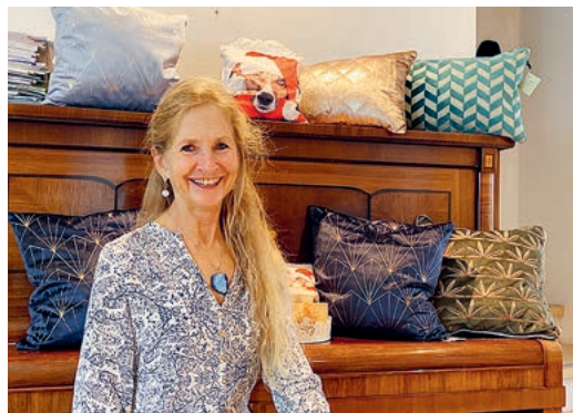
Allerlei bunte Kissen.