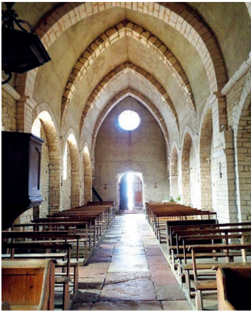
Eingangspforte zur Kirche in Ozenay, Burgund.