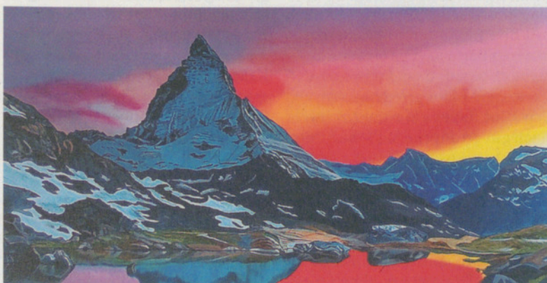
Realitätsnah, mit persönlicher Note: Ölbild von Waldemar Lening.