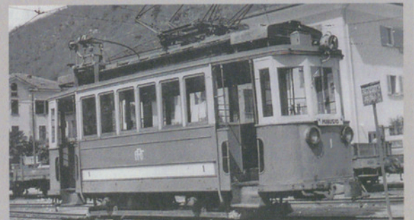
Das Tram von Locarno, Aufnahme von 1954.

Bisher erschienen im Prellbock Verlag, Krattigen: «Elektrischer Nahverkehr im Rheintal»; «Elektrische Strassenbahn Altdorf-Flüelen»; «Elektrische Strassenbahn Uster-Oetwil» (im Volksmund «Uster-Öpfel-Bahn»); «Vinifuni Ligerz-Prêles» Die Bücher können direkt bei Martin Schweizer bezogen werden. Das fünfte Buch über das stillgelegte Tram in Locarno ist in Arbeit und erscheint voraussichtlich vor Weihnachten. Preis noch unbestimmt. Bestellungen: Telefon 044 980 08 26.