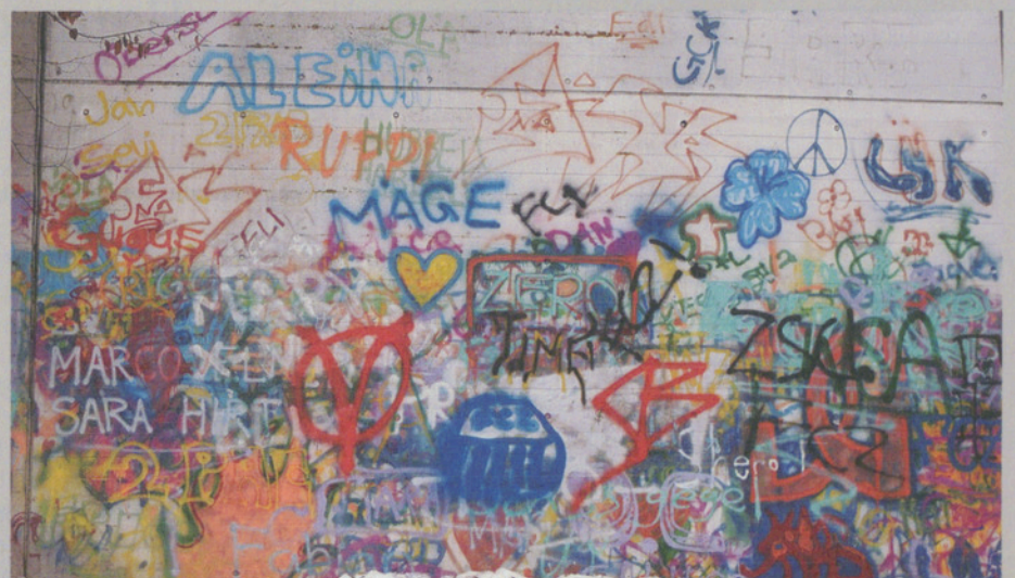
Bronx, Pariser Banlieu? Nein, Schulhaus Aesch.