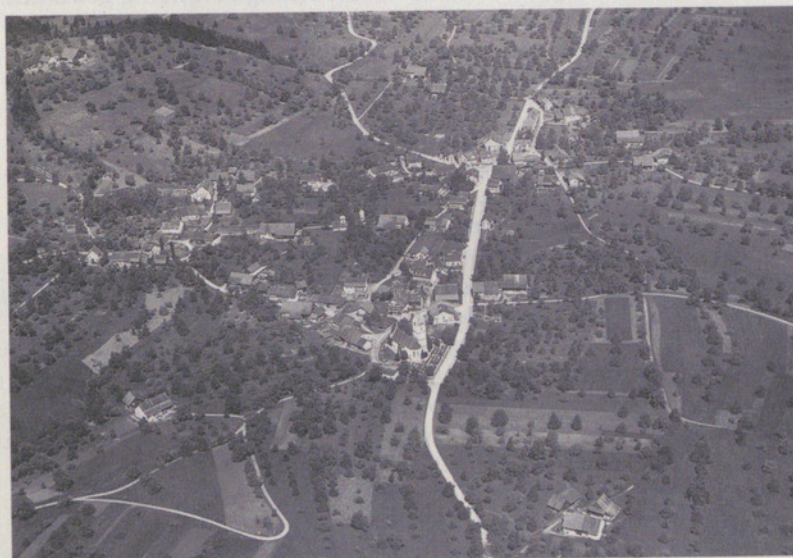
4. Juni 1938: Maur mit einer Vielzahl von Hochstamm-bäumen, lange bevor die Eidg. Alkoholverwaltung für jeden liquidierten Baum eine Entschädigung bezahlte.