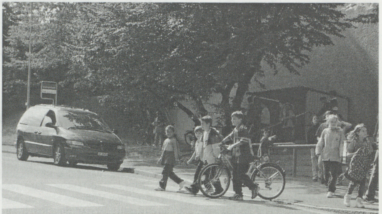
Eine Mittelinsel wird zukünftig als Querungshilfe und für mehr Sicherheit beim Schulhauszugang sorgen.

Obwohl sich 40 Anwesende nach der kurzen Pause still und heimlich davongemacht hatten, stiess die Vorberatung zum Projekt Sportanlage Looren auf reges Interesse. Zwar wurden vereinzeilt auch kritische Fragen gestellt, doch befürwortete ganz offensichtlich die grosse Mehrheit die Realisierung der