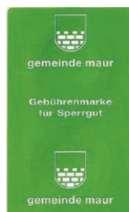
Bestehende Sperrgutmarken.

Sperrgut >10 kg bis 25 kg 4 Gebührenmarken à CHF 5.20