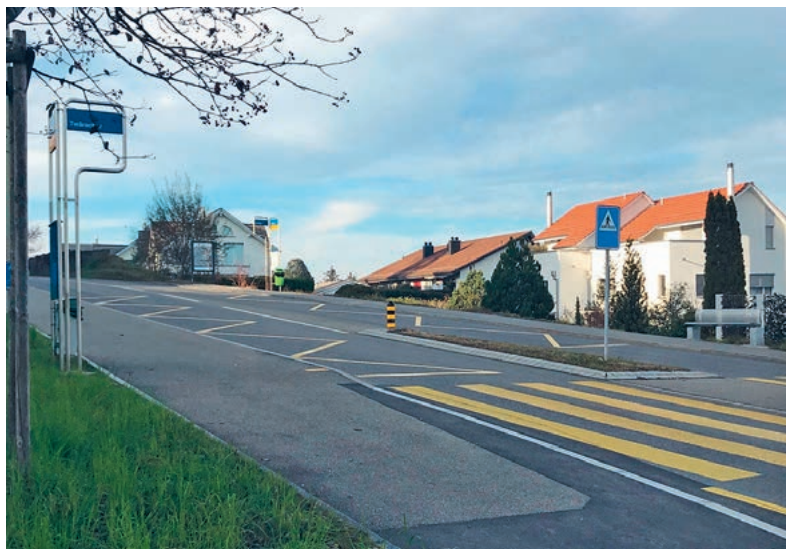
Die Haltestelle Twäracher.