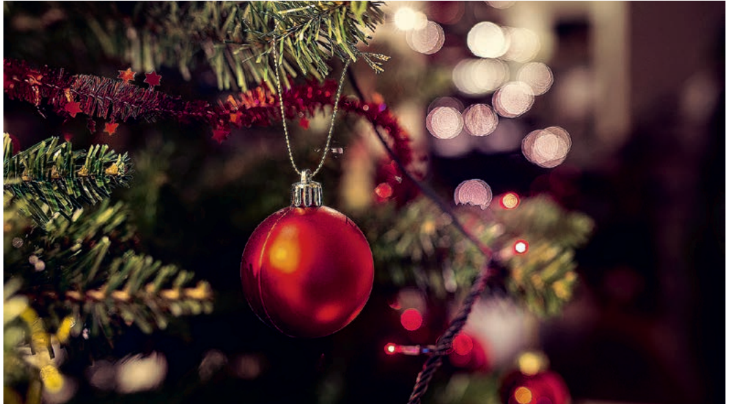
Auch dieses Jahr soll die festliche Deko nicht fehlen.