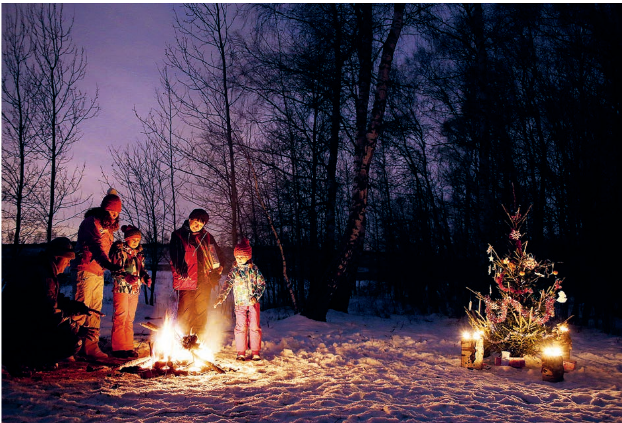
Im Wald Weihnachten feiern? Das geht, aber nur mit Erlaubnis des Waldbesitzers.