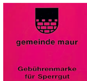
Neue Sperrgutmarken.

Neue Sperrgutmarken (Bogen mit 4 Gebührenmarken CHF 10.40):