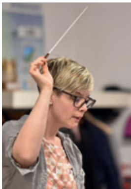
Die Dirigentin hat den Taktstock und das Orchester fest im Griff.