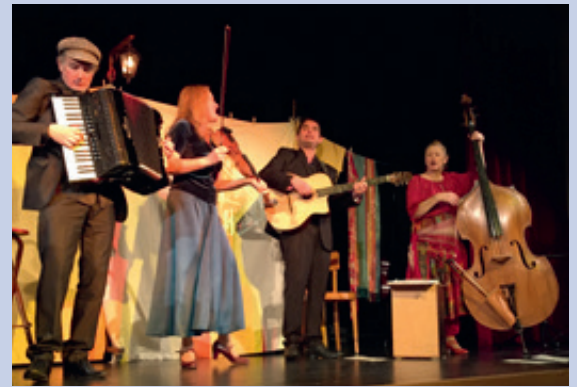
Das neue Jahr fängt gut an, spielend leicht mit Georges-Brassens-Lieder von «Musique Simili» und mit einem Hauch Bohème.