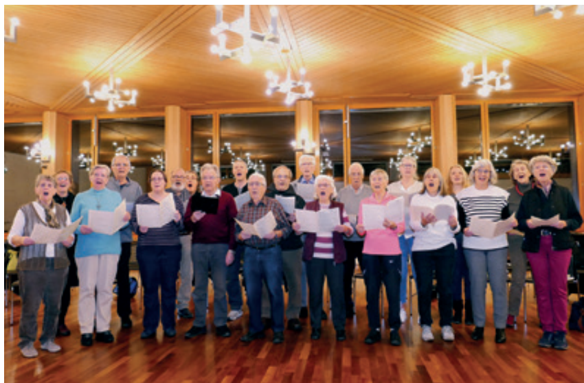
Der Kirchenchor in Aktion mit Freude am Singen und an der Gemeinschaft

Gerne würde er mehr Sängerinnen und Sänger in seinem Chor begrüssen. Es sei ein immer wieder gehörtes Vorurteil, dass Menschen meinten, sie könnten nicht singen. «Mit Stimmbildung ist da einiges zu machen», ist hingegen seine Erfahrung. Es ist das Schicksal auch dieses Chores, dass Mitglieder altershalber und gesundheitsbedingt austreten und nicht ebenso viele Junge nachkommen. Regelmässige Verpflichtungen sind nicht mehr «in», man will sich nicht festlegen. Seit einiger Zeit können Interessierte in einem zeitlich begrenztes Projekt mitsingen. «Natürlich ist Kirchengesang ein Spezialgebiet; nicht alle haben den Mut, lateinisch zu singen.» Er selbst liebt diese Literatur. «Dazu haben wir seit zwan-