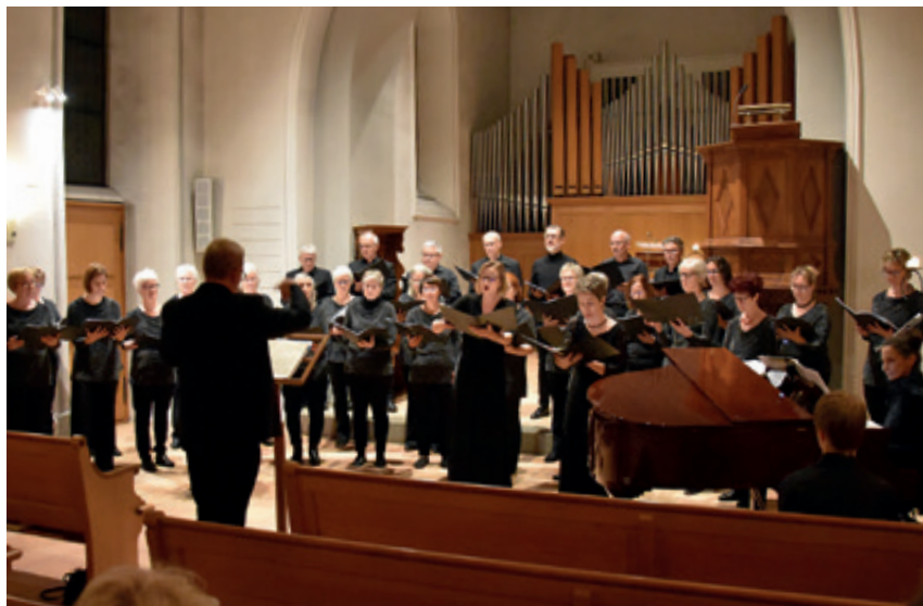
Der Frauenchor Illnau feiert 2021 seinen 100. Geburtstag mit einem Adventskonzert.

Seit den 1830-er Jahren gab es Männerchöre in Illnau und Rikon-Effretikon, später kamen solche in Ottikon, Bisikon und Kyburg hinzu. Gemischte Chöre existierten in der zweiten Hälfte des 19. Jahrhunderts in Ober- und Unterillnau, Rikon und Ottikon. Töchter- bzw. Frauenchöre entstanden ab ca. 1880 in Rikon, Ober- und Unterillnau,