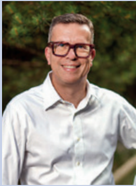
Hansjörg Germann, 50. Präsident des Stadtparlaments