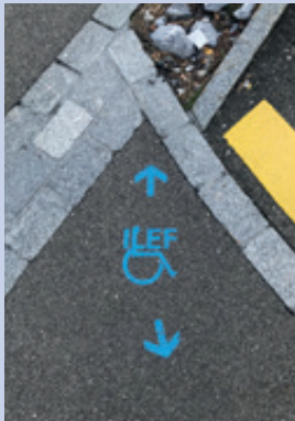
Dieses Symbol zeigt, wo's hindernisfrei lang- geht. Sechs Rundwege sind in Illnau und Effre- tikon markiert.