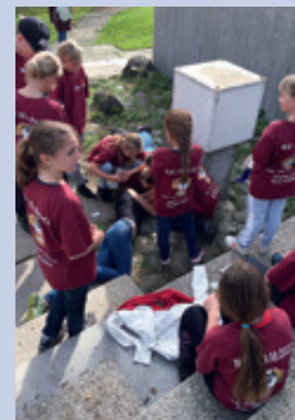
An diversen Posten zeigen «Helpies» ihr Können zum Thema «Erste Hilfe».