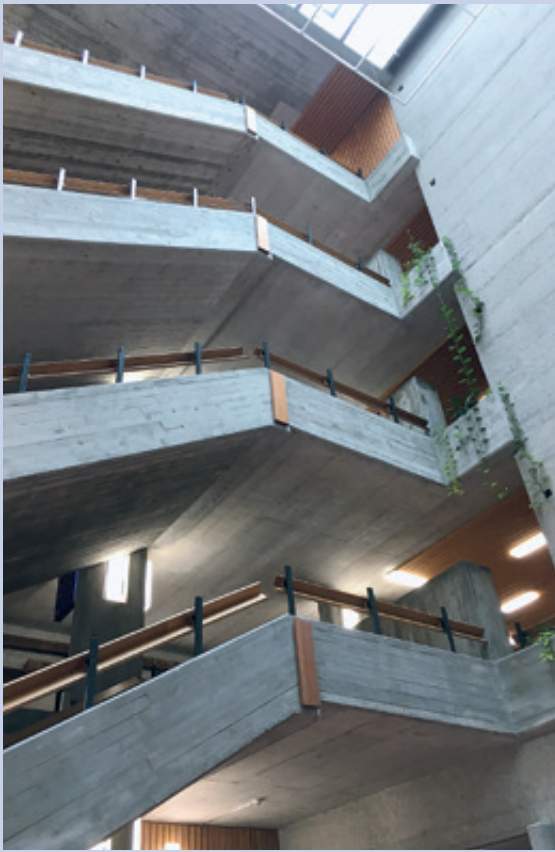
Schulhaus Watt. Treppenarchitektur von Manuel Pauli in Roh-Beton (Beton-Brut)