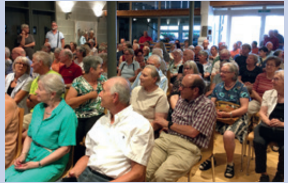
Der übervolle Hotzehuus-Saal zeigt, wie gross das Interesse am Thema «Wohnen im Alter» ist.

Wohnen 60Plus • Die Genossenschaft Sonnenbühl will im Gupfen in Illnau 47 Wohnungen und zwei grosse Pflegewohnungen bauen. Das gut durchdachte Projekt wird der interessierten Bevölkerung detailliert vorgestellt. Wenn alles gut läuft (und ja: im Parlament ist es inzwischen schon gut gelaufen), können am 1. Januar 2026 die Bewohner:innen einziehen.