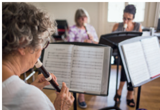
Eltern-Kind-Singen (oben) und Probe eines Ensembles Ü60