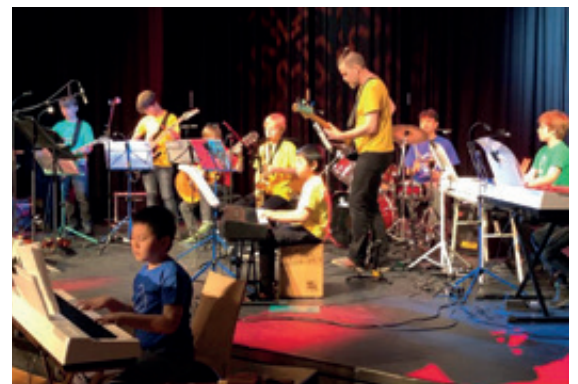
Im Stadthausaal geben die Teilnehmenden des Musiklagers ein Schlusskonzert.

Weil die Musikschulleiterin vom gemeinsamen Musizieren überzeugt ist, bietet Alato eine breite Palette von Ensembles, Bands oder gemeinsamen Auftritten an. Zusätzlich wurden zusammen mit anderen Organisationen Projekte entwickelt ab dem Schul- bis zum Seniorenalter. Gleichzeitig hat Alato ein Förderprogramm für Hochbegabte. Das alles mache die Musikschule aus. Wer das Gewünschte nicht finde, könne einfach anrufen. Das Team gebe alles, um den Wunsch zu ermöglichen.