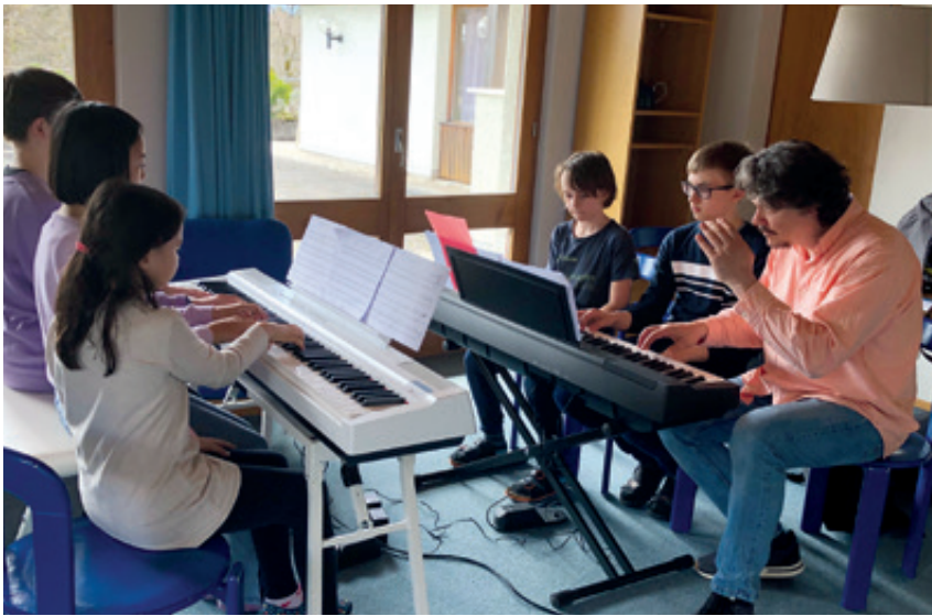
Im Musiklager Hasliberg 2023 wird intensiv geübt.

Eine breite Palette bei der Musikschule Alato