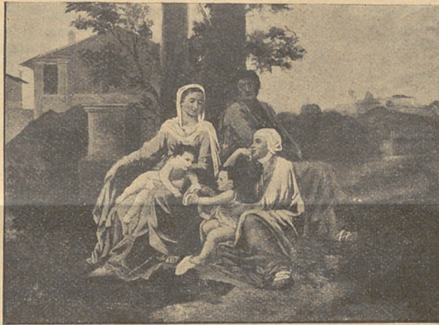
Die heilige Familie — La Sainte Famille