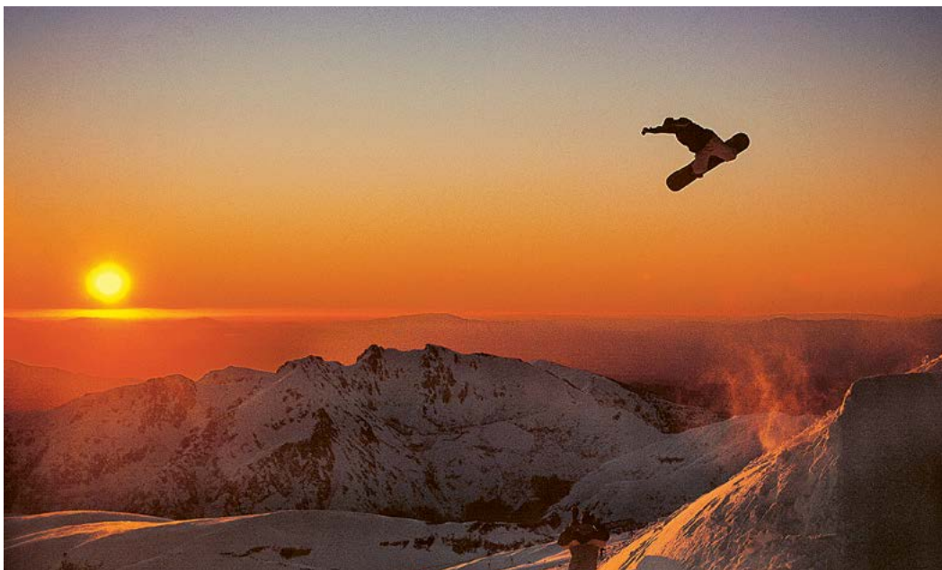
Die grenzenlose Leichtigkeit des Snowboard-Lebens.