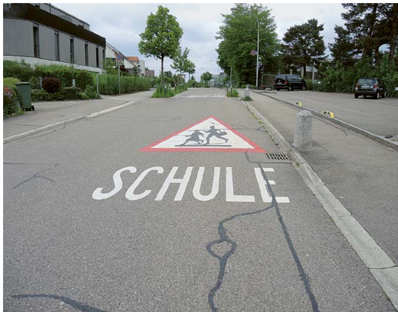
Lebenswichtig, aber teuer: Die Bildungskosten schiessen in die Höhe.

Die Geschäfte, die auf den ersten Blick wenig miteinander zu tun haben, sind gleichwohl ziemlich eng verstrickt. Schon in den beiden vorangegangenen Jahren war das Bildungswesen (mit einem Defizit von 1,12 Millionen Franken 2022 sowie einem budgetierten Verlust von 1,05 Millionen im laufenden Jahr) einer der grössten Kostentreiber. Und nun erhöht sich der Nettoaufwand (vor Abschreibungen) im Bildungsbereich um 2,32 Millionen Franken. In der Erläuterung der Gemeinde heisst es dazu: «Ein beträchtlicher Teil entfällt auf die Besoldung der kantonal angestellten Lehr- und Schulleitungspersonen, von denen die Gemeinde über die