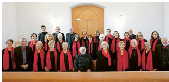
Highlight: der Singkreis in der Kirche Maur.

Es ist ein spezielles Projekt, das der Singkreis Maur dieses Jahr an seinem traditionellen Jahreskonzert realisiert. Zusammen mit Zuzüglern des befreundeten «Akusma»-Chors aus Baden singen sie die «Friedensmesse» von Karl Jenkins.