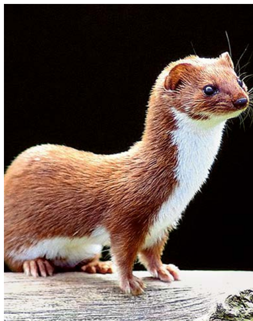
Hält die Mäuse im Zaum: das Wiesel.