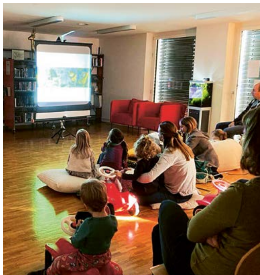
Drive-in-Kino: Spass mit den wilden Kerlen.