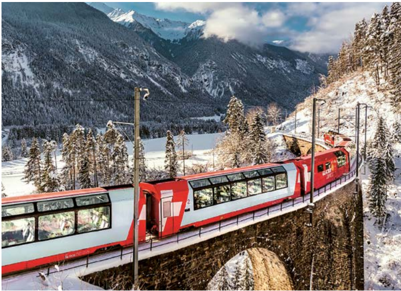
Mit den vergünstigten Tageskarten liess sich die Schweiz neu erleben.

Die neuen SBB-Spartageskarten sorgen für rauchende Köpfe. Maur steigt zwar «auf Zusehen» auf das Angebot ein. Doch sonst wendet sich der Bezirk Uster mehrheitlich ab.