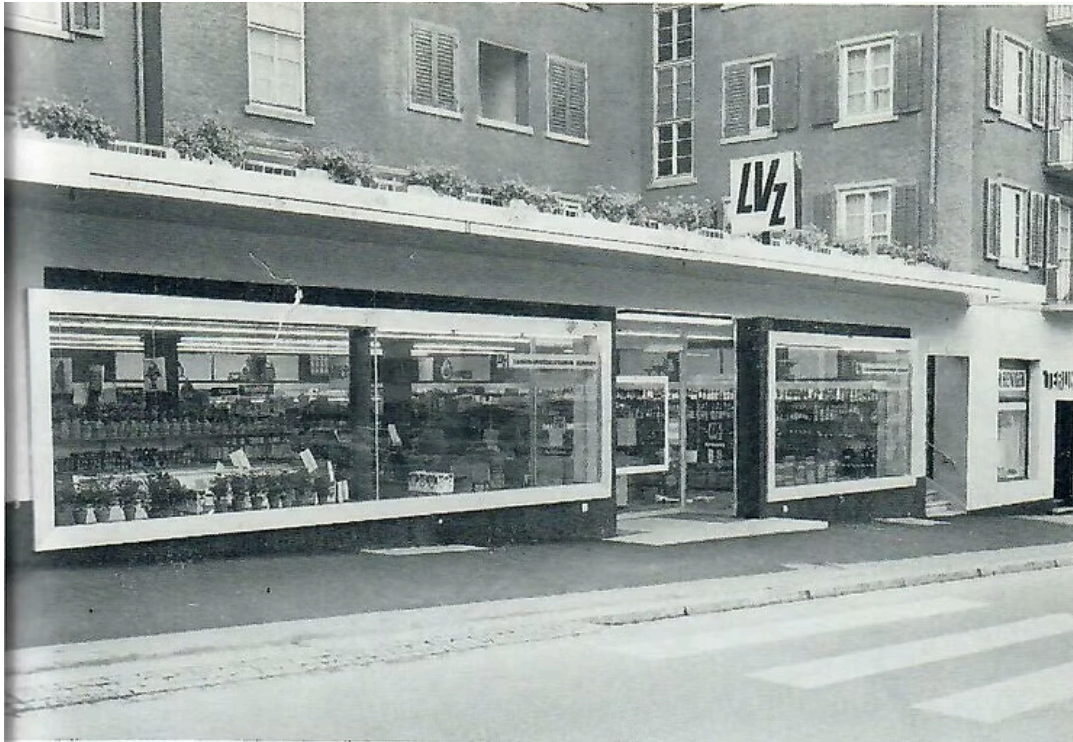
Lebensmittelverein Zürich, heute COOP, Mieterin der GBZ2 am Morgental 1963. Jahresbericht GBZ2.

Eine wichtige Politik der GBZ2 bestand in der Idee, nicht nur für die eigenen Genossenschafter, sondern auch fürs Quartier als Ganzes da zu sein und Gutes zu tun. Das kam insbesondere dem Morgental zugute. Die Geschäftszeile an der Tramhaltestelle, wo einst die «Wirtschaft Zum Morgental» dem Areal – soll man Platz sagen? – den Namen gab, war ein Werk der GBZ2. Von Anfang an dabei waren immer ein Coiffeur, eine Metzgerei; und auch der LVZ, der Lebensmittelverein Zürich, war stets Mieter, nicht nur am Morgental, sondern auch noch mit einer Filiale an der Wachtelstrasse.