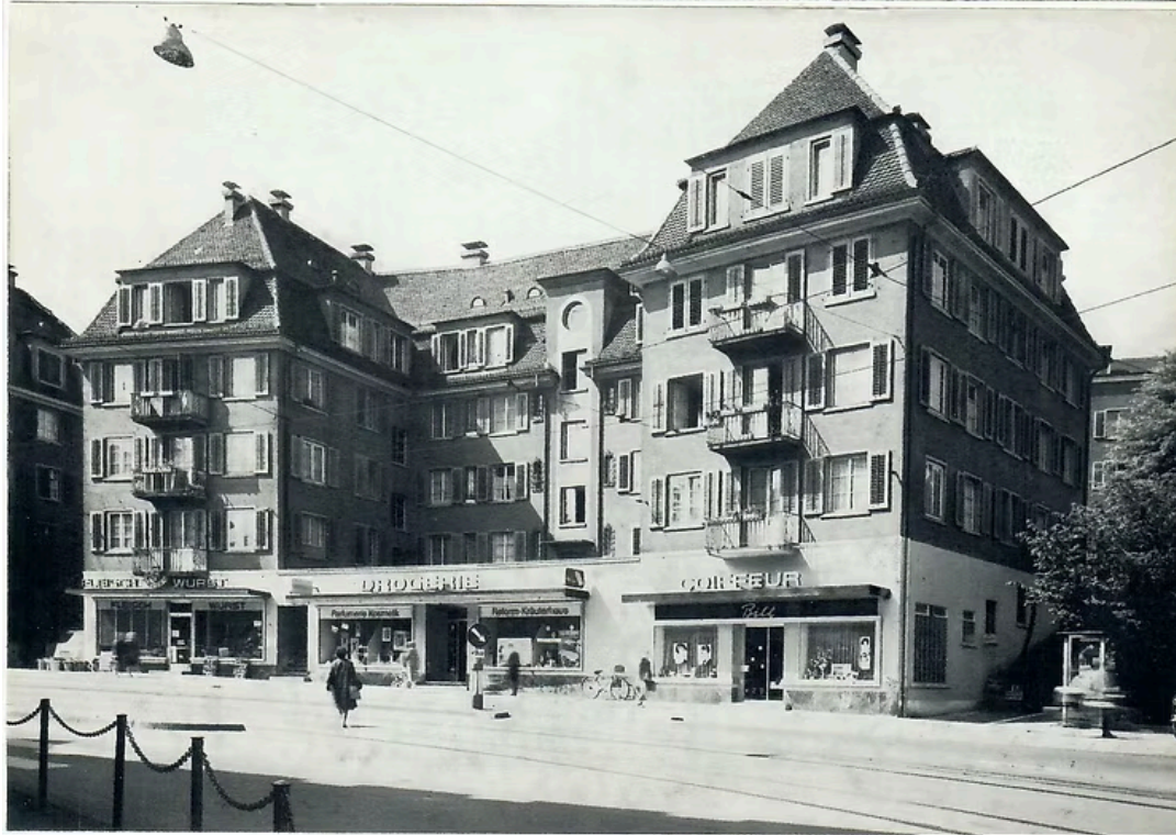
Albisstrasse 48-54 war der erste Wohnblock der GBZ2. Oben mit Metzgerei und Coiffeur, und Bad in der Mitte, unten 1965 noch mit Metzgerei und Coiffeur, in der Mitte aber die neue Drogerie. Jahresbericht GBZ2.

Mit den fünf Etappen war ein respektable Baubestand der GBZ2 erstellt. Damit war die Neubautätigkeit aber für lange Zeit abgeschlossen. Der Abschluss der Bautätigkeit in den frühen 1930er Jahren hatte sicher mit der rasanten Entwicklung Wollishofens als Wohnquartier zu tun, die zahlbares Bauland in der Nachbarschaft rar machte. Für den Vorstand hatte dies allerdings markante Folgen. Nicht, dass es ihm langweilig geworden wäre, weil man nicht mehr «bauen» konnte, vielmehr verschoben sich die Aufgaben: Man war nun eine grosse Vermieterin, mit anspruchsvollen Genossenschaftlern und Mieterinnen, dazu kamen die schrecklichen Auswirkungen von Wirtschaftskrise und Zweitem Weltkrieg. Auch die Aufgabe, die Bausubstanz gut zu erhalten, benötigte grosses fachmännisches Wissen und viel Arbeit.