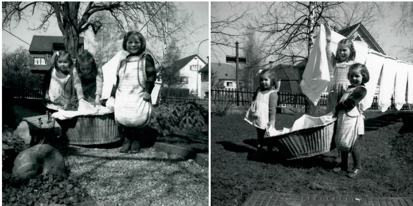
Drei Schwestern im Garten an der Ecke zur Morgentalstrasse am Waschtrog, 1950er Jahre. Private Fotos.

Eine Frage, die sich immer wieder stellte: Welchen Wohnstandard sollte die GBZ2 ihren Mietern bieten? Welche Haushaltsgeräte sollten in den Wohnungen eingebaut sein, und welche in der Verantwortung der Mieter? Das betraf das Waschen ebenso wie das Radio und den Telefonrundspruch. Bei der Frage nach der Einrichtung der Waschküchen etwa wurden um 1930 die neuesten Angebote konsultiert – und angeschafft (siehe oben). Doch Tumbler gab es damals noch nicht, so blieb der Waschtrog auch bis lange nach dem Zweiten Weltkrieg ein besonderer Tag im Leben der Familien!