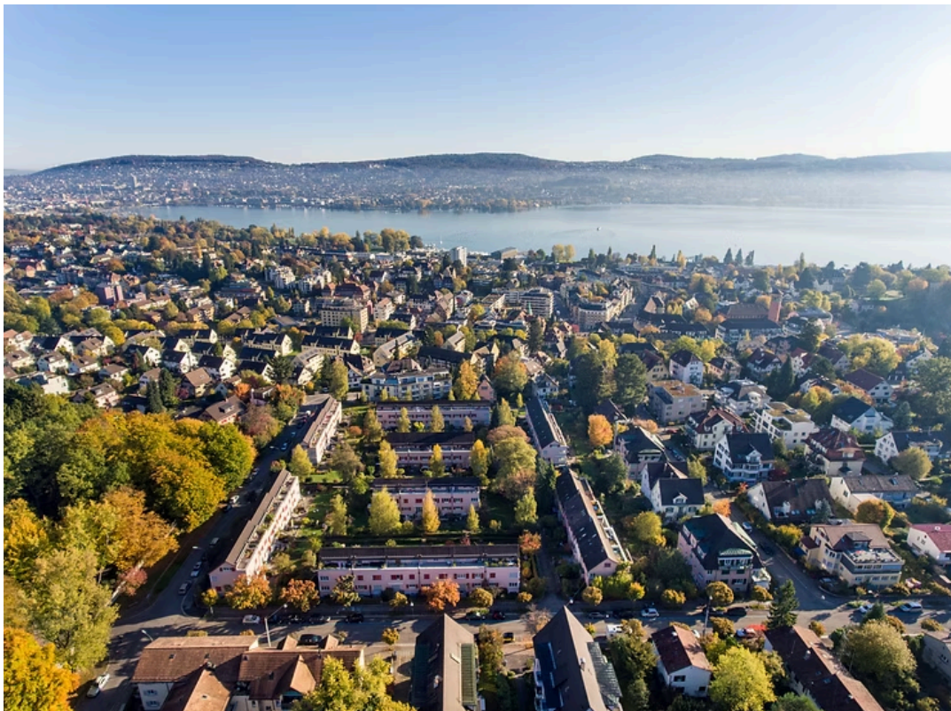
Blick über Wollishofen, insbesondere über die Bauten der GBZ2. 2017.

100 Jahre sind heute kein Alter mehr. Und gleichwohl ist es immer erstaunlich, dass Menschen gesund und munter diese Marke erreichen. Bei Organisationen ist es ein bisschen anders. Aber auch da ist es sehr erfreulich, wenn das 100-Jahr-Jubiläum mit einer funktionierenden, lebendigen und nützlichen Institution verbunden ist. Das ist bei der GBZ2, der Gemeinnützigen Baugenossenschaft Zürich 2 , der Fall.