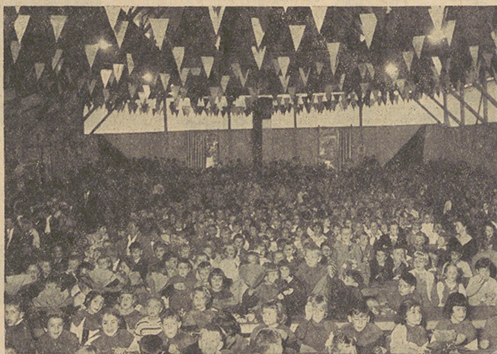
Jugendfest, Blick in die Festhalle

Im Zelt rollte nun vor den Augen der Kinder ein abwechslungsreiches Programm über die Bretter der riesigen Bühne. Elementarschüler machten mit einem flotten Trottinete-Reigen den Anfang. Zwei Gymnasiasten verblüfften die Zuschauer mit ihren Zauberkünsten. Eine sechste Klasse hatte in wochenlanger Arbeit ein Zirkusprogramm mit Stierkämpfen, hoher Schule der Pferde, tanzenden Mädchen und turnenden Knaben einstudiert und sich dazu all die nötigen Utensilien selbst gebastelt. Eine Gruppe Sekundarschülerinnen begeisterte die Mitschüler mit neuen und alten