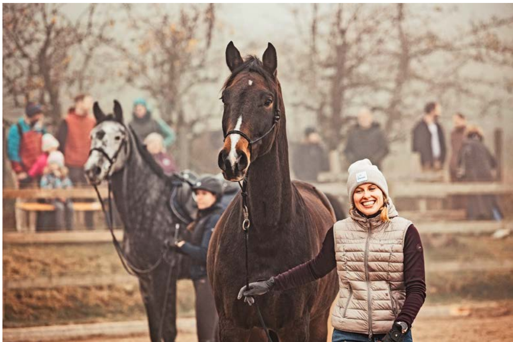
Für manch einen liegt das Glück dieser Erde auf dem Rücken der Pferde.

Unter allen Anmeldungen werden tolle Preise verlost – ein Gutschein für einen ganzen Tag kostenlose Konsumation sowie zwei Glüh-