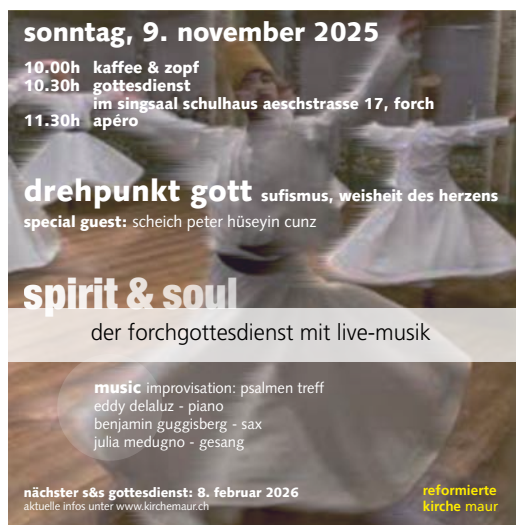
spirit & soul