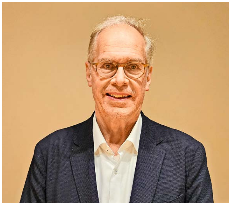
Koryphäe Prof. Dr. med. Dr. h.c. Thierry Carrel referierte im Loorensaal.

Thierry Carrel Der berühmte Herzspezialist hielt ein spannendes Referat über das Herz.