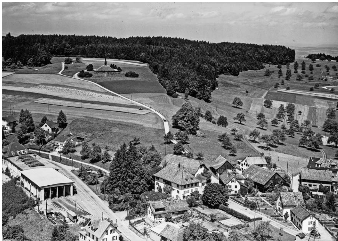
Die Siedlung bekannt als Forch mit dem alten Depot unter dem Wehrmännerdenkmal. Das Foto wurde 1950 von Werner Friedli aufgenommen. Bild: ETH-Bibliothek Zürich, Bildarchiv/Stiftung Luftbild Schweiz

Maurmer Flurnamen. Vieles wird mit dem Begriff «Forch» verbunden: eine Passhöhe zwischen Zürich- und Greifensee, eine Siedlung auf der Krete, gar ein vermeintlicher Ortsteil, die 1912 eröffnete benachbarte Station – sogar ein Ausflugsboot, das bis 1977 über den Greifensee kreuzte. Niemand weiss so richtig, worauf sich der Begriff der Forch wirklich bezieht. Auch die etymologische Herkunft des Begriffs ist umstritten.