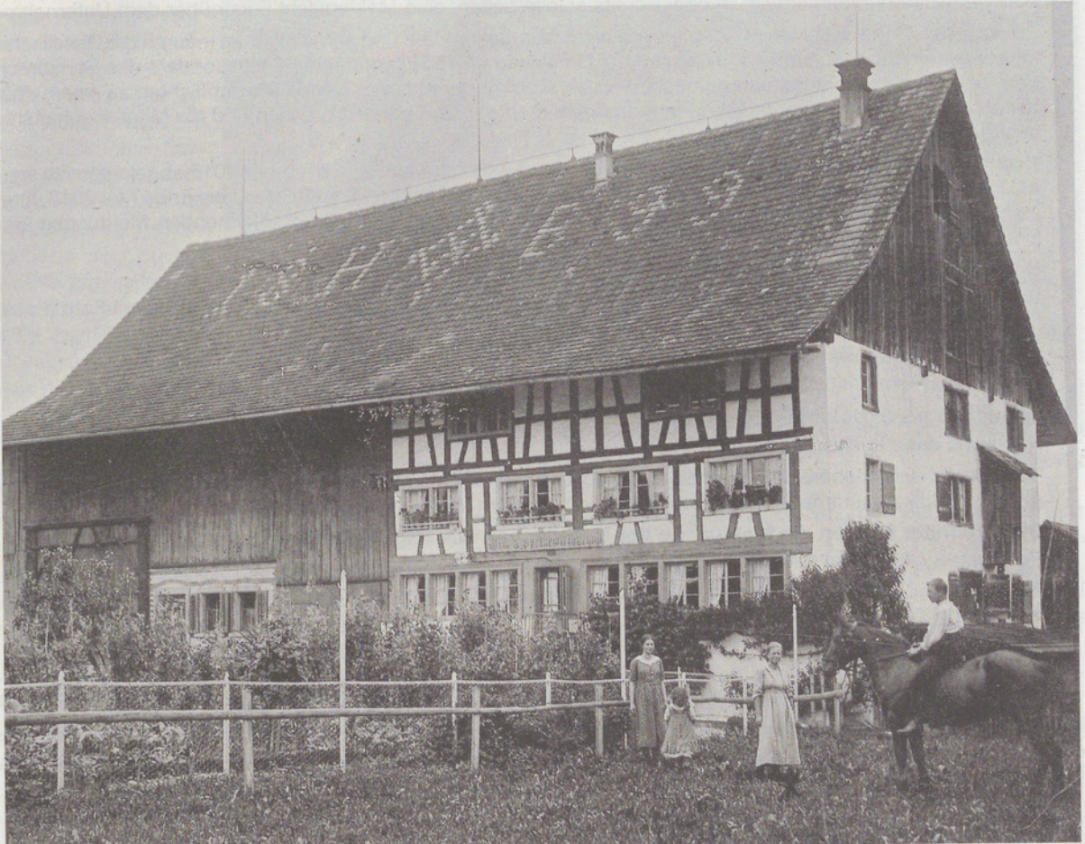
Die «Wein- und Speisewirtschaft» war der Vorläufer von der heutigen «Stall-Stube». Bild aus dem Jahre 1916.