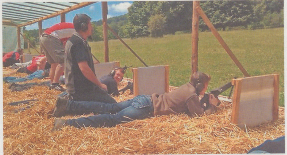
«Feuer frei!» am Schiessstand.

Löcher in den Scheiben zu suchen. Die Wertung wurde mittels verschiedener Signalkellen den Warnern, die hinter den Schützen sassen, mitgeteilt. Die Löcher wurden mit Fischkleister und Papierfetzchen zugeklebt. Bei starkem Regen kam es vor, dass die Kleber abrutschten und bei der nächsten Serie mehr Löcher in der Scheibe festgestellt wurden, als Schüsse abgegeben wurden. Im Zweifelsfall «immer zu Gunsten des Schützen», hiess die Devise. Auch soll es vorgekommen sein, dass Schütze und Zeiger unter einer Decke steckten und die Wertung ebenfalls nach dieser Devise angezeigt wurde. Mit drei starken Hornstössen wurden die Zeiger wieder in den geschützten Graben beordert und die nächste Serie Schüsse wurde mit dem Kommando «Feuer frei» eingeleitet. Das waren noch gute alte Zeiten! Die heutige Elektronik kennt kein Pardon und meldet jede