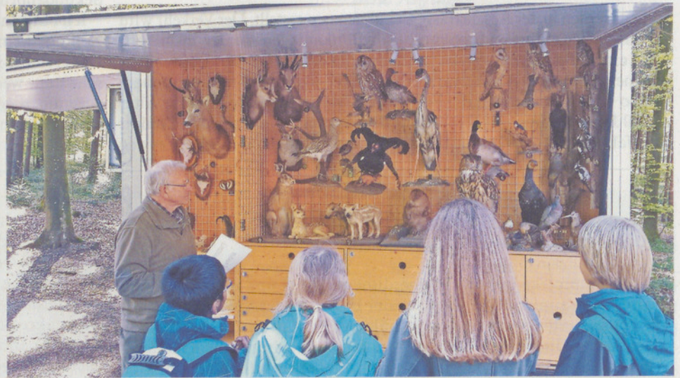
Der Jäger zeigt im «fahrenden Museum» einheimische Tiere.