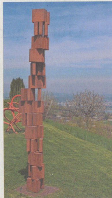
Die Wassberg-Terrasse als gelungener Ausstellungsort für unterschiedlichste Skulpturen. Unten links etwa die Bronze-Kühe von Susan Kopp. Oben und unten rechts: Stahl-Skulpturen in diversen Formen.