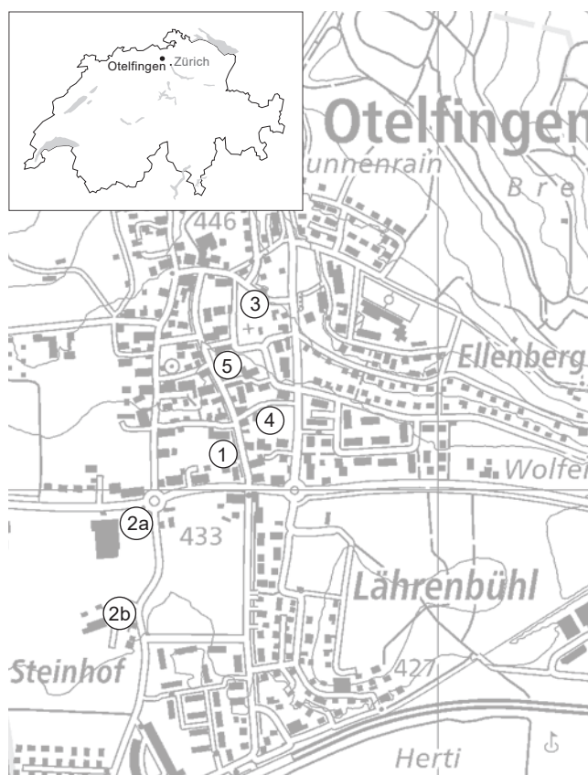
Abb. 1. Otelfingen. Fundstellen mit mittelalterlichen Befunden. (1) Vorderdorfstrasse Kat.-Nr. 838, Siedlungsreste; (2a) Landstrasse/Würenloserstrasse; (2b) Steinhof, Gräber; (3) Rötlerweg, Siedlungsreste; (4) Schmittengasse 18–20, Siedlungsreste; (5) Vorderdorfstrasse Kat.-Nr. 1145/1146, Siedlungsreste. Ausschnitt aus der Landeskarte. M. 1:12 500.

Der Schichtaufbau wurde in den Sondierschnitten in fünf schematisch gezeichneten Stichprofilen dokumentiert (Abb. 3). In ca. 1.7–1.8 m Tiefe steht eine kompakte Schicht (Pos. 6) an, die sich aus Kies und Ton zusammensetzt und