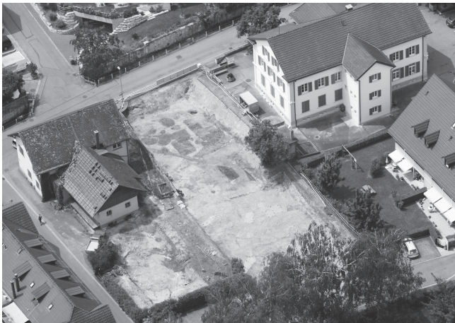
Abb. 2. Otelfingen-Vorderdorfstrasse Kat.-Nr. 1145 und 1146. Luftaufnahme der Ausgrabung, Ansicht von Südosten. Aufnahme datum 30. Juni 2010.

lungen der Gruben Pos. 11 und Pos. 36 und die natürliche Mulde Pos. 21 (mit Pos. 23–25) enthalten zwar ausschliesslich prähistorisches Material, doch lässt dies keinen sicheren Schluss auf die Datierung zu, zumal sich ihre stratigraphische Position nicht von jener der Grube Pos. 35 unterscheidet.