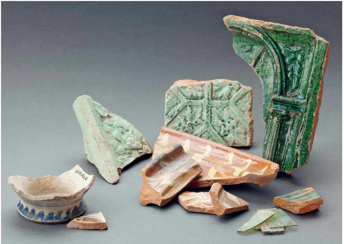
Abb. 6. Otelfingen-Vorderdorfstrasse Kat.-Nr. 1145 und 1146. Ofenkeramik, Fensterglasfragmente und Geschirrfragmente aus der Auffüllung des Kellers Pos. 64. Die zwei Geschirrfragmente unten links stammen aus der Grube Pos. 73.

Angesichts der Lage der Grabungsfläche innerhalb des Dorfkerns mag das Fehlen von spätmittelalterlichem und der geringe Nachweis von neuzeitlichem Fundmaterial erstaunen. Dies ist aber durch die fast ausschliessliche Überlieferung von Fundmaterial als Abfall und Bauschutt in Grubenauffüllungen sowie durch den maschinellen Abtrag der humosen Schichten Pos. 1–3 und 79 zu erklären.