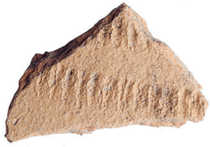
Abb. 5. Otelfingen-Vorderdorfstrasse Kat.-Nr. 1145 und 1146. Wandfragment eines Topfs (?) mit Rädchendekor Kat. 9. M. 1:1.

deln. Die Gruben belegen eine nicht näher deutbare Nutzung des Areals, die wohl mit der Ablagerung der Schwemmschicht Pos. 3 frühestens im 11./12. Jh. endete. Im Gegensatz zum Westteil der Grabungsfläche Nord sind anhand der überlieferten Zeugen keine Bauten nachweisbar.