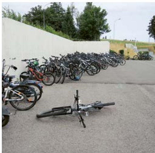
Nur temporär: Velos ohne Unterstand.

Wir haben Belana Becher im «Persönlich» in der Maurmer Post vom 9. März 2018 vorgestellt. Inzwischen ist viel passiert, die romantisch veranlagte Maurmerin hat inzwischen eine eigene Band, «Bonarhodes», und tourt mit Indie-Pop-Klängen durch die Schweiz. Am vergangenen Sonntag konnte die Band am riesigen Open Air St. Gallen auftreten, eine super Erfahrung, wie Belana begeistert vom Festival schreibt. Nächster Auftritt: am 10. August auf der Talentstage vom «Stars in Town»-Festival in Schaffhausen. Wenn Sie nicht hinkönnen: Supporten kann man auch per Instagram und Spotify, alles hilft @bonarhodes . DW