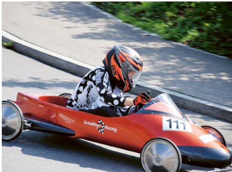
Perfekte Kurventechnik: Am Wassberg grassierte das Rennfieber.