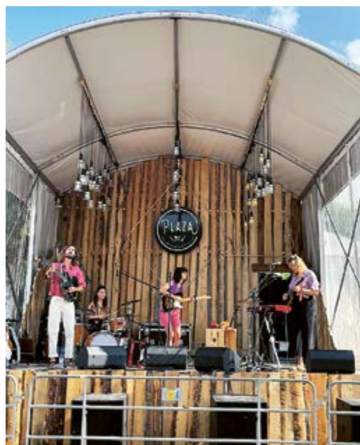
Eine Maurmerin erobert St. Gallen.

Achtung Biber: Diese Informationstafeln warnen Spaziergänger an der Glatt. Auch in Maur ist der Biber wieder heimisch geworden.