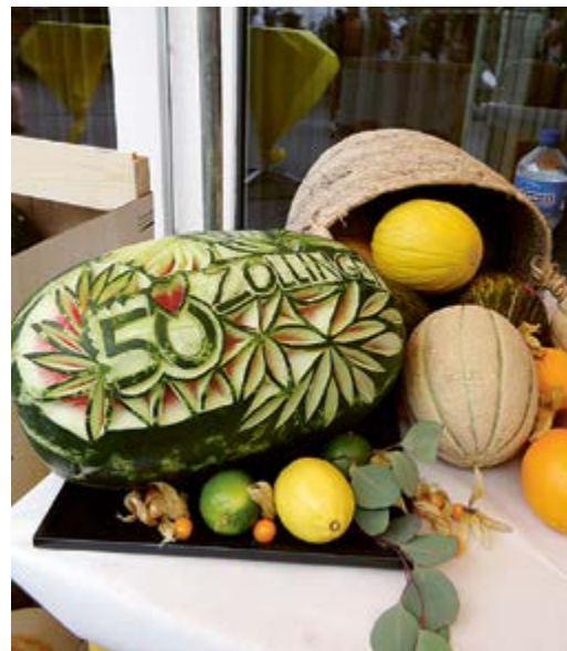
Augen- und Gaumenschmaus: ein goldenes Jubiläum mit fruchtigem Dekor.