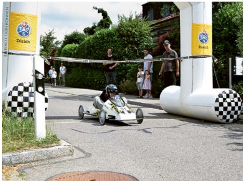
Oft entscheiden kleinste Details: Mit einer aerodynamischen Kopfhaltung wird um Hundertstelsekunden gekämpft.