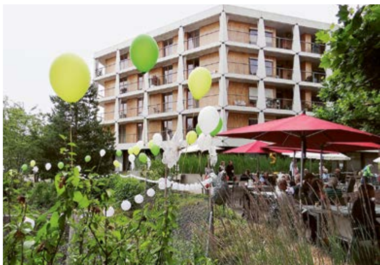
Festlicher Rahmen und farbige Dekoration: Das Zollingerheim als Zauberwelt mit Luftballonen – auf ihrem Weg zum Horizont.