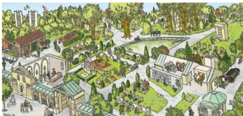
Wimmelbild «Auf dem Friedhof».