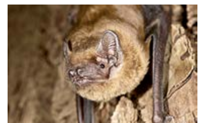
Der Grosse Abendsegler, eine Fledermausart, die auch in Maur vorkommt.

Freiwillige Kostenbeteiligung per Kollekte. Kinder sind herzlich willkommen. Für Hunde ungeeignet.