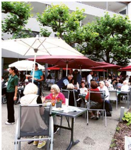
Der Regen kam später: Petrus schenkte der Festgemeinde wärmende Sonnenstrahlen.