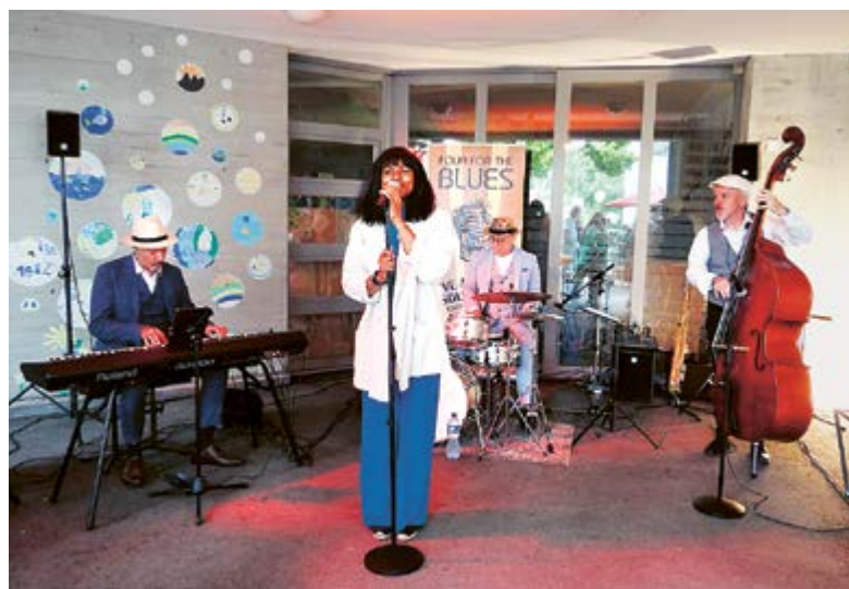
Die Band «Four for the Blues» sorgt für gute Stimmung und beschwingende Rhythmen – und für einen Hauch von Lounge-Feeling.