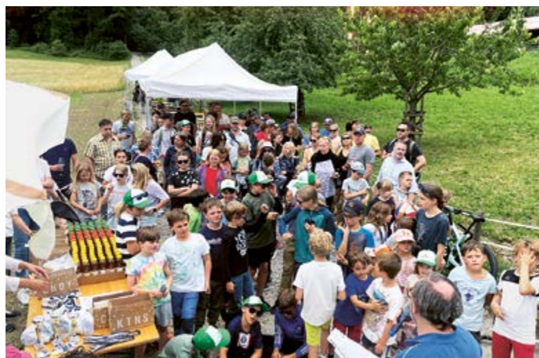
Der Lohn des Nervenkitzels: Vor der Siegerehrung herrscht Stossverkehr.