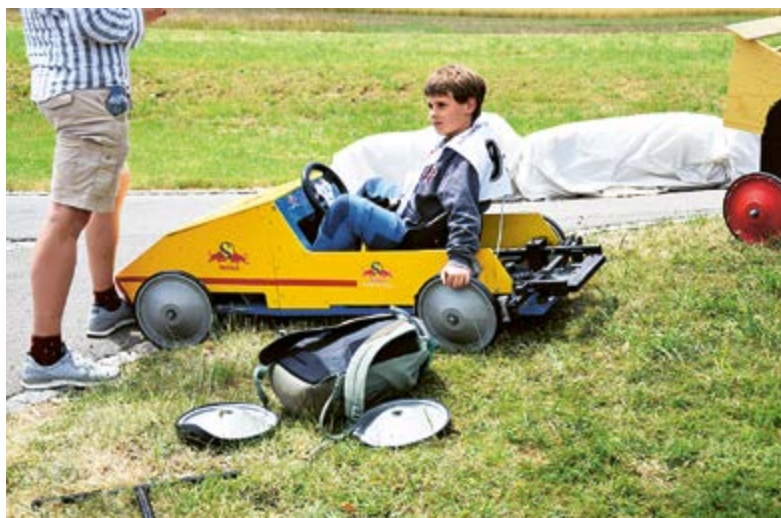
Glücklicherweise nur Materialschaden: Beim Piloten dieser havarierten Kiste mussten Samariterinnen und Rennarzt nur zur Kontrolle vorbeischaun.