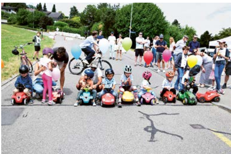
Keiner zu klein, echter Rennfahrer zu sein: Im Bobby-Car-Rennen messen sich am Wassberg die Stars von übermorgen.