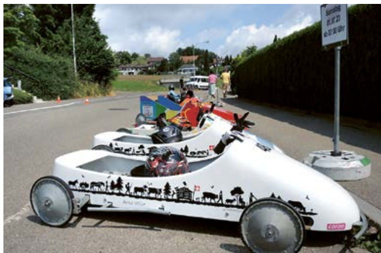
Wagenpark: Fein säuberlich parkiert warten die Bolide, bis sie von den Müttern und Vätern wieder bergwärts gezogen werden.