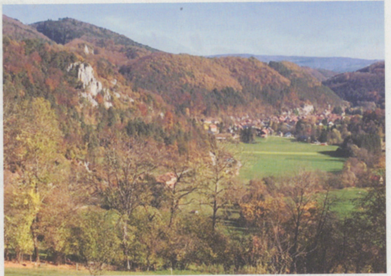
Blick nach Kleinlützel.