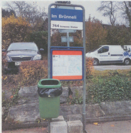
Stein des Anstosses: die Bushaltestelle «Im Bränneli».

Nirgends hat es Blumen oder Rabatten. Und über das Vogelhaus amüsiert sich ganz Aesch, denn dort sieht man nie einen Vogel.