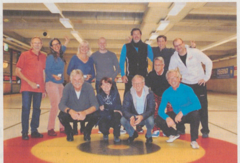
Im Vordergrund: Team CCK Marti – rechts: Team CCK Brunner – links: Team CCK Lanz.