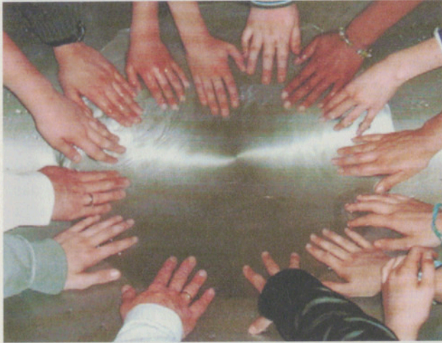
«Wege zum Kind»

Solche und ähnliche Fragen stellen sich Kinder, wenn es um das Thema Taufe geht.