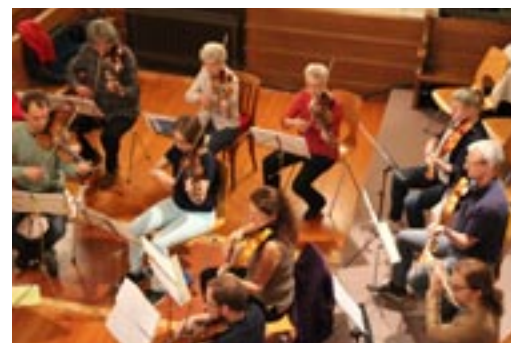
Das traditionsreiche Orchester begeistert.

Harmonische Klänge zum 1. Advent (1. Dezember) in der Kirche Lindau: Die Orchestergesellschaft Winterthur spielt mit Beginn um 17 Uhr Werke von Ferguson (Der kleine Lord Fauntleroy), Grieg (Stücke aus der Peer Gynt Suite), Corelli (Concerto grosso per Natale) Mozart (Andante für Flöte & Orchester), Giordano