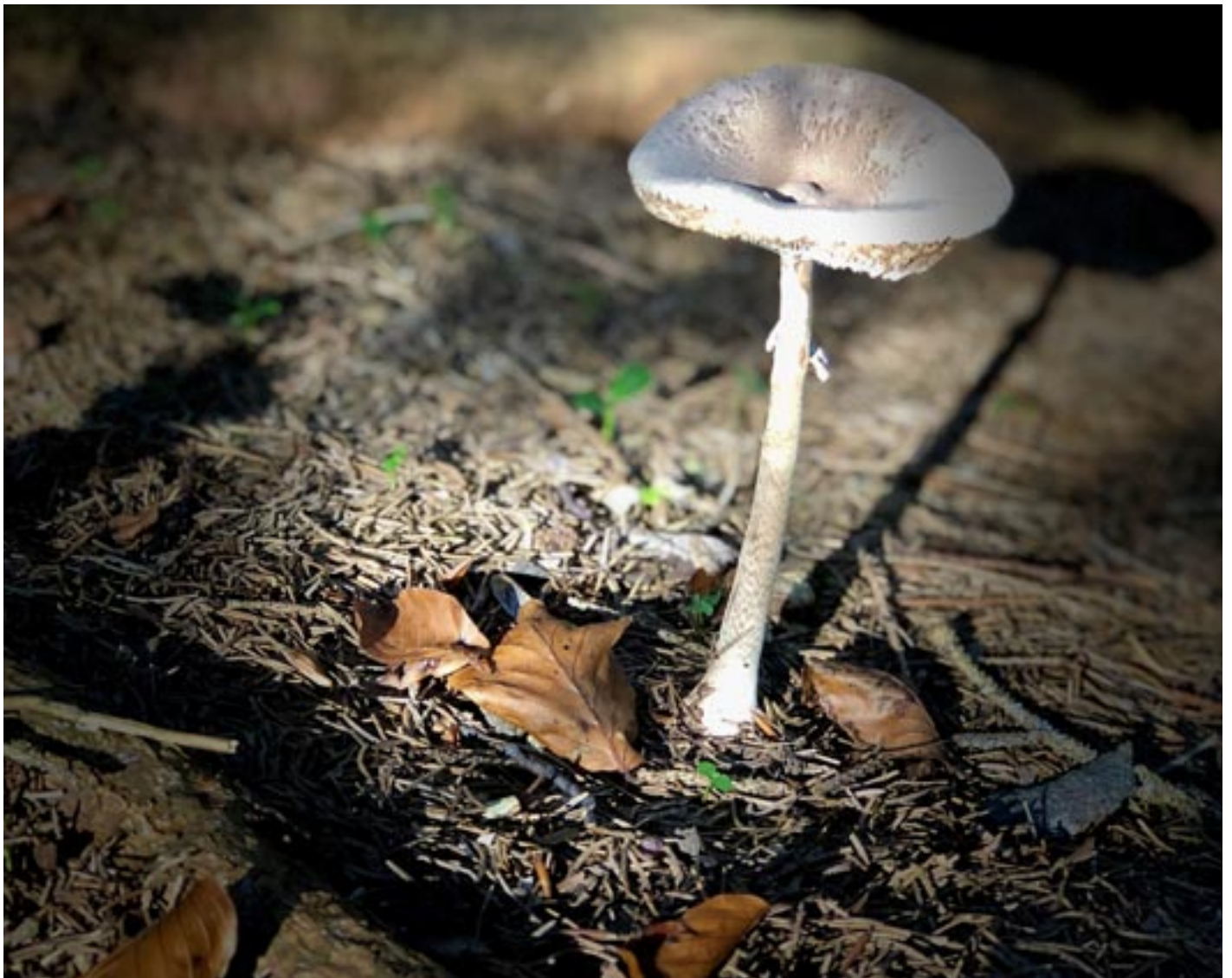
Verborgene Schönheit des Herbstes