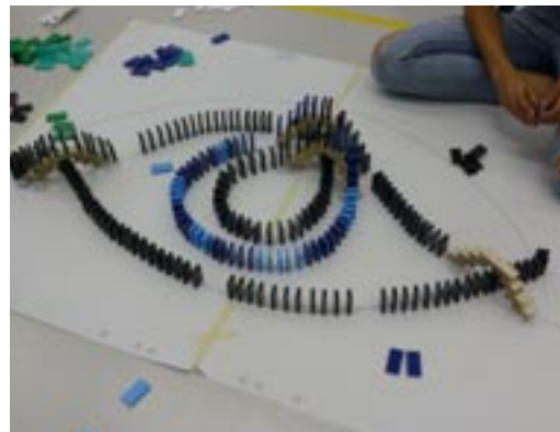
Kreation mit eingebauter Brücke

bestehende Dominostein-Konstruktion oder ein Dominostein-Bild so aufgestellt werden, dass mit dem Anstossen eines einzelnen Dominosteins die Kettenreaktion ausgelöst und ohne Unterbruch zum Fallen kommt. Das Planen der Konstruktion und die Herstellung der Hilfsmittel wie Startrampen, Brücken,... wurde schon vorher während zwei Lektionen gemacht.