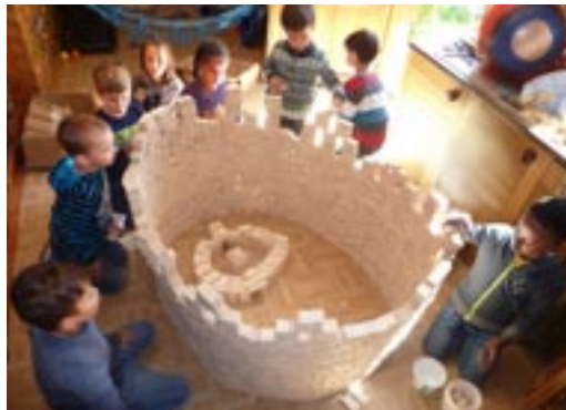
Volle Konzentration beim Bau der Stadtmauer von

Um die Geschichte vom Wiederaufbau der Stadtmauer von Jerusalem zu vertiefen, bauten die Kinder mit grossem Eifer, voller Konzentration und Sorgfalt mit Bauklötzen eine hohe Mauer um die gebaute Stadt. Dabei erlebten sie, was sie erreichen, wenn sie einander helfen und zusammenhalten. Das Lied begleitete uns: «Mir hebäd alli zämä und du Gott bisch bi eus».