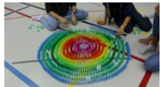
Mit Taktik zum Erfolg

Mit ruhigen Händen und viel Geduld zum Erfolg? Ein nicht alltäglicher Mittwochmorgen in der Turnhalle der Sekundarschule Grafstal. Statt Sportmaterial liegen 25'000 Dominosteine in 20 verschiedenen Farben in Plastikboxen bereit. In 3er- bis 4er-Gruppen muss in zwei Lektionen eine möglichst abwechslungsreiche, nicht nur aus geraden Linien