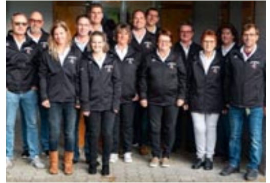
Die Sommersaison wurde erfolgreich abgeschlossen.

Nach dem Endschiessen durften die 4 besten Schützen der Vorrunde von Alle gegen Alle den Final schiessen.