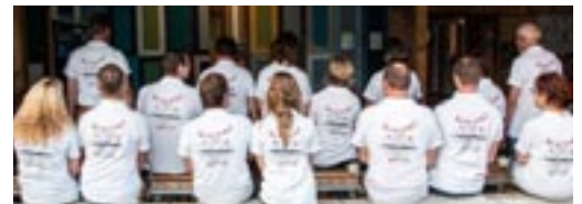
Auch ein schöner Rücken kann entzücken...

Am Samstag, 19. Oktober fand das Helferfest statt. Alle Helfer vom Jubiläumsschiessen durften ein feines Nachtessen und gemütliche Stunden in unserem