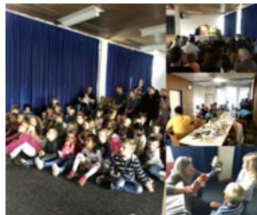
Ein Saal voller strahlender Kinderaugen

Kasperlitheater, Kinderschminken, Glitzertattoos und gemeinsamer Znüni