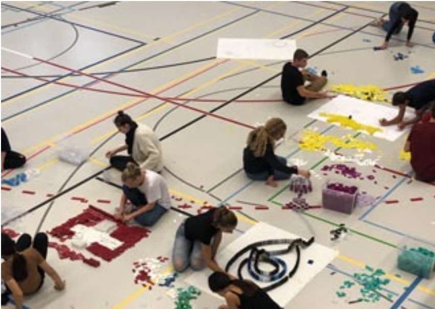
Vertieft und voll konzentriert sitzen die Schülerinnen und Schüler an ihren Kunstwerken.

bestehende Dominostein-Konstruktion oder ein Dominostein-Bild so aufgestellt werden, dass mit dem Anstossen eines einzelnen Dominosteins die Kettenreaktion ausgelöst und ohne Unterbruch zum Fallen kommt. Das Planen der Konstruktion und die Herstellung der Hilfsmittel wie Startrampen, Brücken,... wurde schon vorher während zwei Lektionen gemacht.