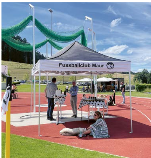
Ein Treffpunkt für Sponsoren und Gäste des FC Maur.

Nach einem fröhlichen Austausch stiegen die Gäste wieder in ihren Oldtimer, hielten noch an der Burg Maur, machten einen Rundgang in der Mühle Maur und fuhren weiter nach Aesch bei Neftenbach im Tösstal.