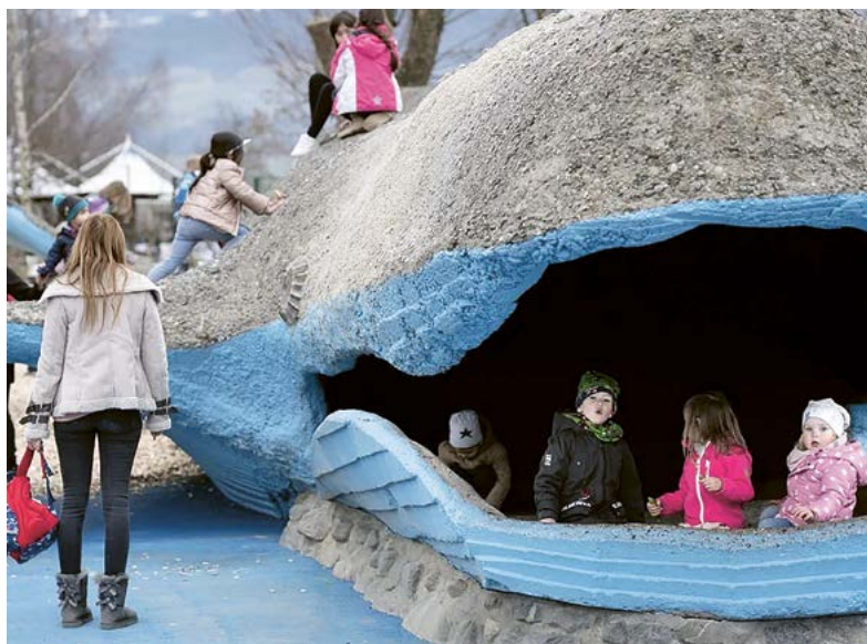
Wal im Knies Kinderzoo.