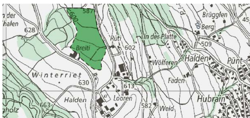
Standort der vorgesehenen Deponie: Die Neuweid liegt zwischen Loorenschulhaus und Benkelsteg.

Aeschmer aus der Gemeinde Aesch ZH kamen zu Besuch in Aesch bei Maur.