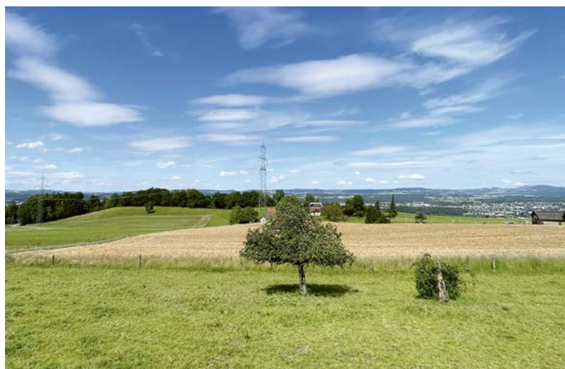
Hier könnte dereinst die Deponie zu stehen kommen: Die Neuweid in Maur.

An der Informationsveranstaltung in Oetwil hätte die Bevölkerung die Gelegenheit gehabt, sich in einem Infozelt sowie auf einer geführten Begehung über die Deponie ein