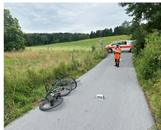
Die Fahrer prallten frontal ineinander.

Der genaue Unfallhergang ist noch nicht bekannt und wird durch die Kantonspolizei Zürich in Zusammenarbeit mit der Staatsanwaltschaft See/Oberland untersucht. Aufgrund des Unfalls mussten der Radweg sowie die Fällandenstrasse in Richtung Fällanden bis kurz nach 17.30