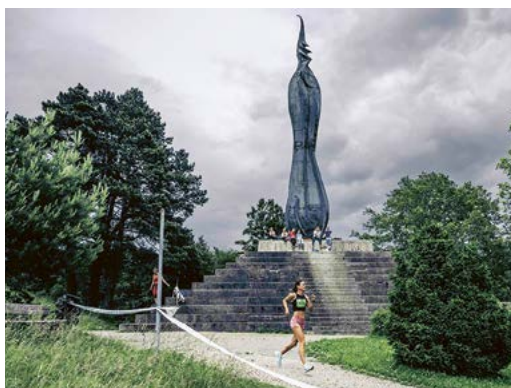
Die Route führte beim Forchdenkmal vorbei.