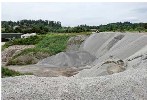
So sieht eine grosse Deponiefläche aus.

Was würde eine Deponie in Maur bedeuten? «Die genaue Betriebsdauer aus heutiger Sicht zu beziffern, ist schwierig. Aber eine Deponie am Standort Neuweid in Maur wäre aufgrund ihrer Lage mit rund 600'000 Kubikmetern nicht sehr gross», erklärt Locher. Zum Vergleich: Bei einer grösseren Deponie spricht man von einer Million Kubikmetern, sehr grosse Deponien umfassen sogar drei, vier oder fünf Millionen Kubikmeter. «Die Form und Grösse wird im Gestaltungsplan festgelegt, dabei kann die Gemeinde auch mitreden», so Locher weiter. Auch sei es möglich, die Deponie in Etappen anzulegen. Damit könnte man verhindern, dass nur eine grosse, offene Fläche entsteht. Die einzelnen Etappen könnten dann jeweils relativ schnell wieder geschlossen und mit der Renaturierung begonnen werden. Der potenzielle Standort in Maur eignet sich voraussichtlich für eine Deponie Typ B, die für die Entsorgung von leicht verschmutzten Abfällen vorgesehen ist.