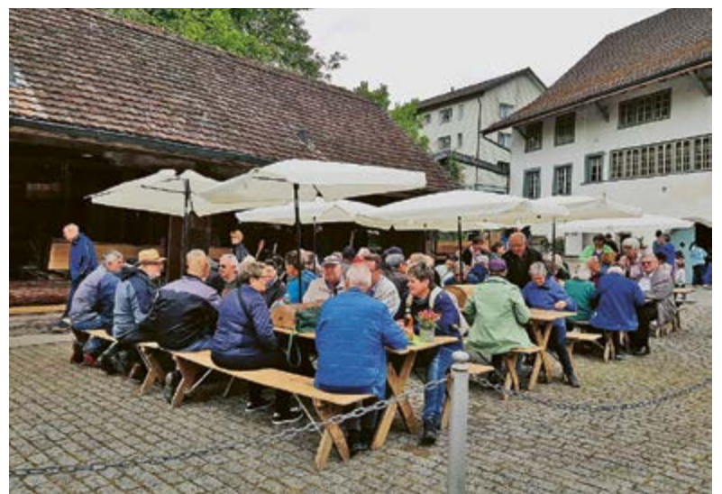
Geselligkeit grossgeschrieben: Der Mühlttag ist ein wichtiges gesellschaftliches Ereignis.