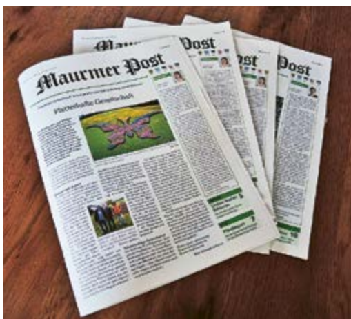
Die MP im Fokus der Politik.

Anders die anderen drei Ortsparteien von der SVP, SP und GLP. Sie scheinen sich schon seit längerem und gründlich mit dem Thema befasst zu haben, um ihre Meinungsbildung kommunizieren zu können. Die SVP Maur wird dabei den