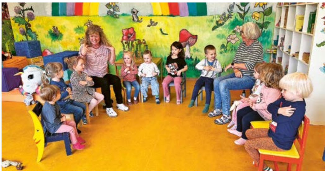
Lernen, spielen, verstehen – bei den Teddybären leuchten die Kinderaugen schon frühmorgens.