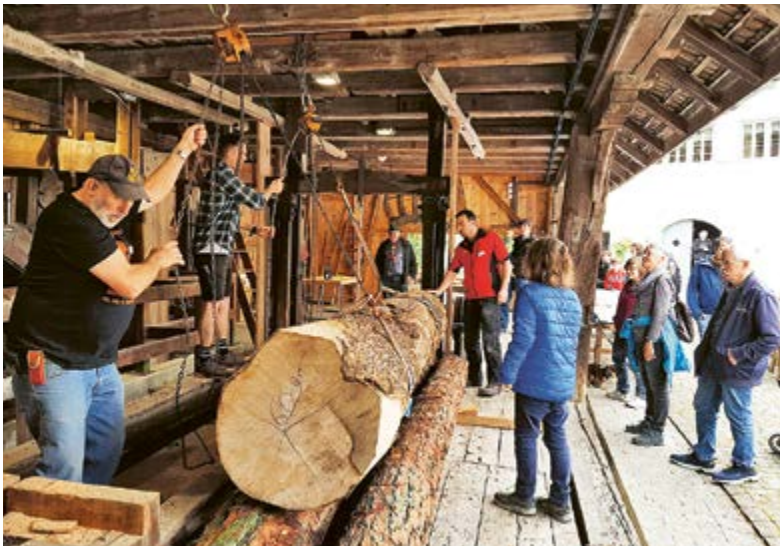
Noch kein Kleinholz: Der mächtige Stamm wird für die Verarbeitung bereitgelegt.

Der Mühlttag ist ein äusserst beliebter Anlass und eine der wenigen Möglichkeiten, die alte Mühle mit ihrer Säge in voller Aktion zu erleben. Die Maurmer liessen sich die Möglichkeit nicht nehmen und genossen das Fest in grosser Zahl.