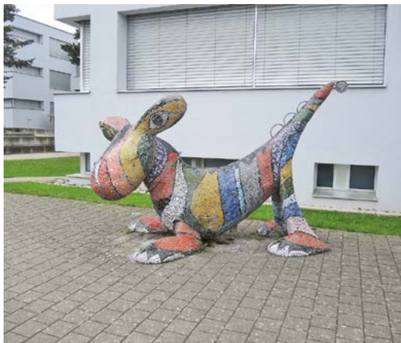
Das Fabeltier in Aesch harrt der Dinge, die da kommen – beispielsweise ein(e) neue(r) Schulleitende(r).