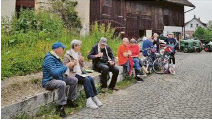
Maur trifft sich: Am Mühlentag kommt Alt und Jung zusammen.