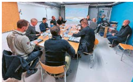
Die Kursteilnehmer üben für den Ernstfall.