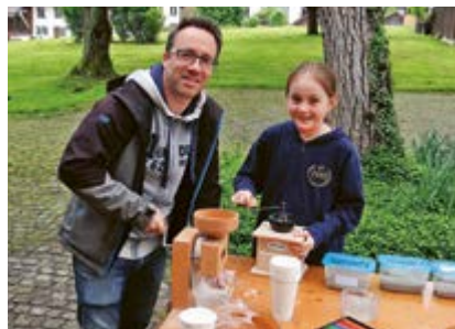
Brotbacken mit Fingerspitzengefühl: Vater und Tochter üben das Bäckerhandwerk.