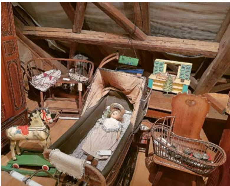
In der Mühlenwinde schlummert so manch überraschender Schatz.