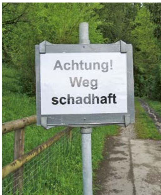
Schwieriges Gelände: Viele Wege in der Gemeinde sind derzeit nicht leicht zu passieren.