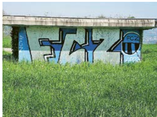
Ein Ärgernis nicht nur für GC-Fans: Solche Sprayereien kosten den Steuerzahler Tausende Franken. TRE.

Der Meistertitel des FC Zürich ist Schnee von gestern – und gleich verhält es sich mit diesem Graffiti am Dorfeingang von Ebmatingen. Vergangene Woche entfernten Gemeindearbeiter die Sprayerei. Kostenpunkt: rund 1500 Franken. Weil es sich beim Gebäude um ein Pumpwerk des Wasserwerks Maur handelt, erstattete die Gemeinde Anzeige gegen Unbekannt. Die zunehmende Zahl von Schmierereien im öffentlichen Raum ist für die Behörden ein grosses Ärgernis – und für die Steuerzahler eine teure Geschichte. Bei grossflächigen Verwüstungen können sich die Reinigungskosten bald einmal auf 15000 Franken belaufen. TRE