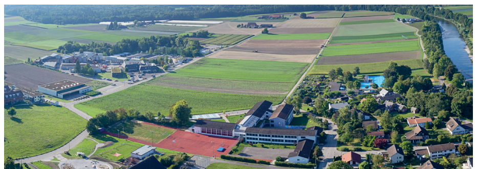
Niederfeld aus der Drohnen-Perspektive

Das Raumplanungsgesetz, die Landschaftsschutzinitiative, die Ernährungssicherheit, ja sogar die Energiestrategie 2050 – all diese Vorlagen und Gesetze