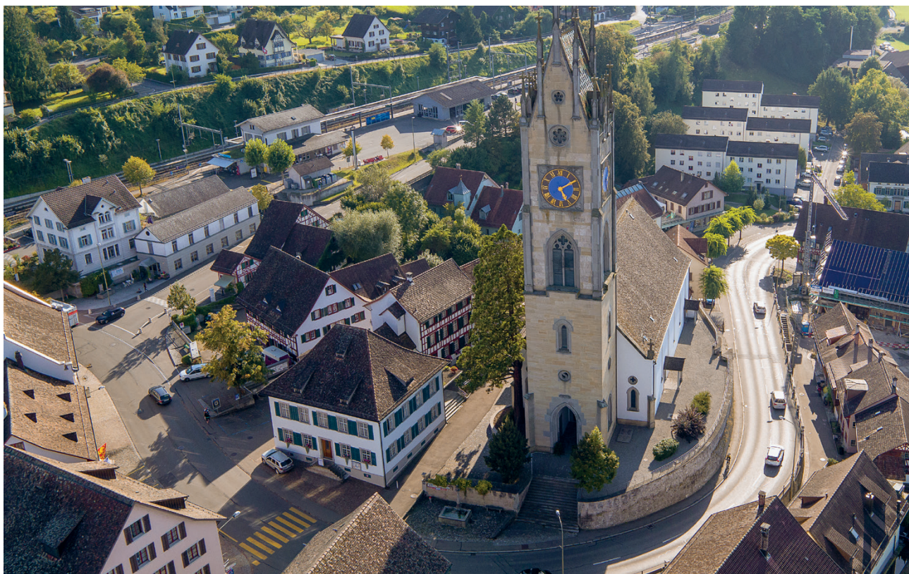
Andelfingen aus der Vogelperspektive