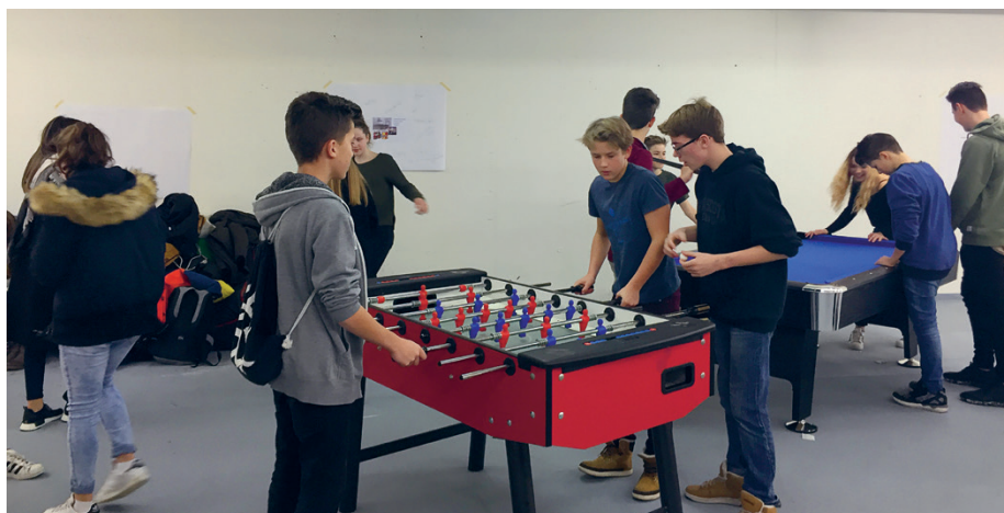
Immer viel los im Jugendtreff

Wo sich so viele junge Menschen treffen, braucht es gewisse Regeln wie zum