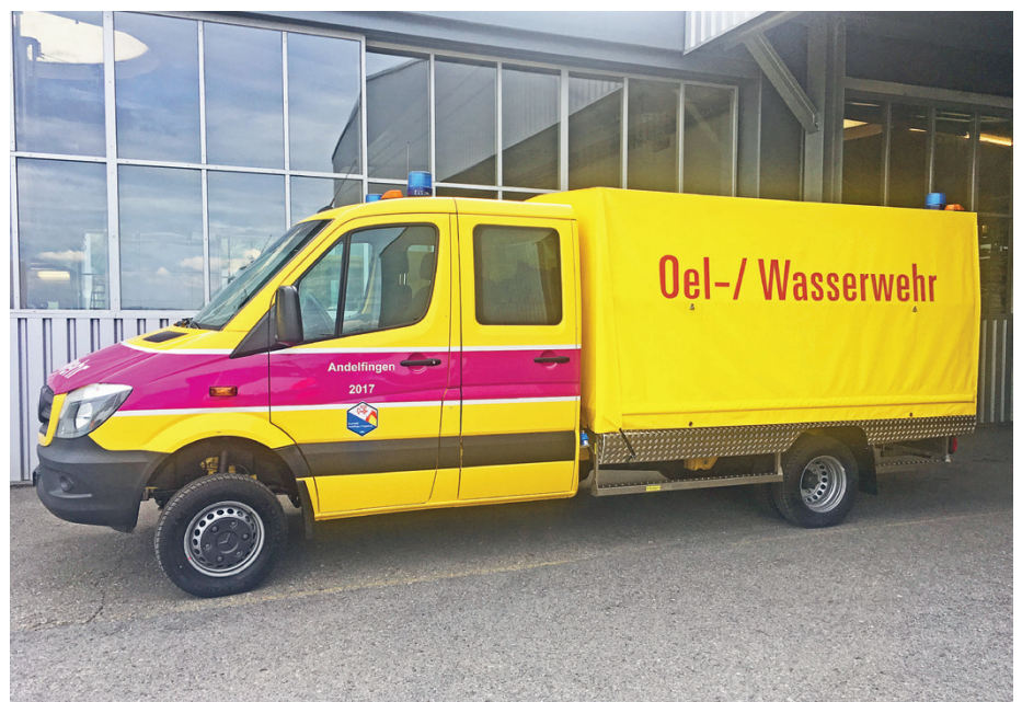
Das neue Oel-/Wasserwehr Fahrzeug der Andelfinger Feuerwehr