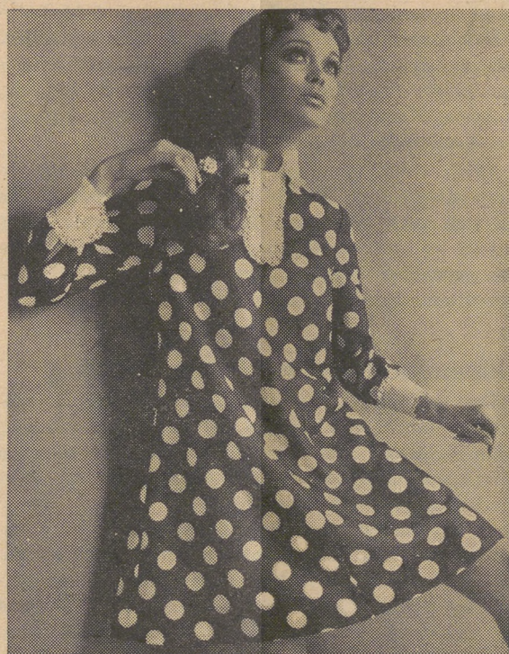
Grosse weisse Tupfen und eine duftige Rüschengarnitur an Kragen und Manchetten betonen den romantischen Stil dieses anmutigen Kleides aus «Terylene»-Georgette. Modell LE STYLE, Henri Glücksmann SA, Delemont