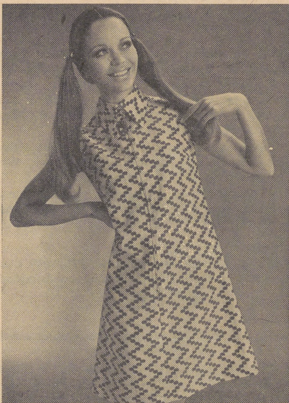
Interessant an diesem jungen Kleid aus «Terylene» ist das Tupfendessin mit Scherli-Effekt. Die Farbkombination ist Orange—Rot Modell RENA, Rena AG, Zürich

Bei den jungen Modellen flattern die beschwingten Falten- und Plissé-Röcke aus Terylene wieder im Wind. Die dazupassenden Jacken sind entweder taillenkurz oder ein breiter Lackledergürtel unterbricht die hüftlange Form. Farblich frech kontrastierende Blusen sind uni- oder zwei-