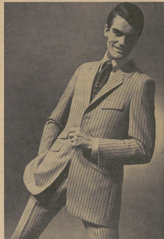
Die lange Veston-Form und das feine Streifen-Dessin geben diesem Anzug aus «Terylene»-Kammgarn die aktuelle Note für den modebewussten Herrn. Modell BIM, Bim AG, Meisterschwanden

farbig bedruckt — wovon natürlich die eine Farbe Weiss ist. Auch beim Dreifarbenspiel, das sich bei den Kostümen besonders effektiv gibt, ist immer Weiss die Dominante. Damenhaft zeigt sich der Tunika-Stil bei den Kleidern. Die Zweifarbenoptik wird hier für reichen Blendenschmuck genutzt, der Seitenschlitze oder phantasievolle Abschlüsse der Tunikasäume attraktiv betont. Junge Tageskleider sind Chemisiers, die mit handbreiten Gürteln getragen werden; die Jupes sind halbweit mit Falten, Plissés und glockigen Bahnen.