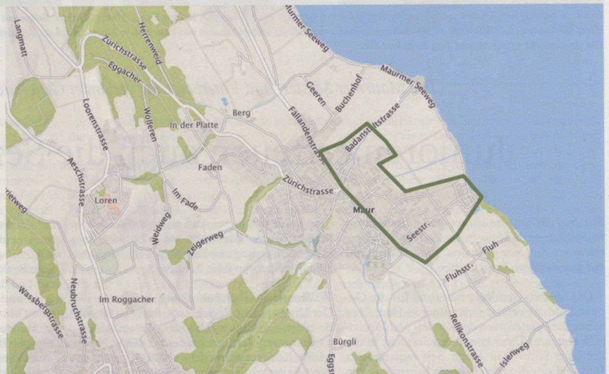
Grosse bauliche Veränderungen stehen unter anderem im Maurer Unterdorf (grün umrandet) an.