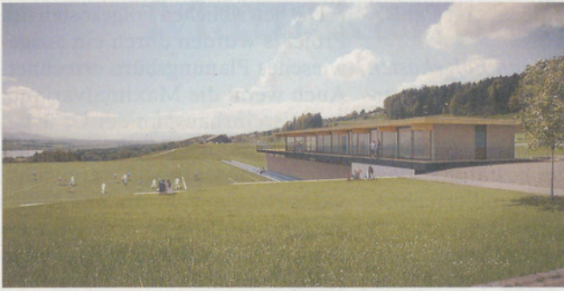
Die geplante Sportanlage. Bild: Dahinden Heim Architekten