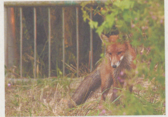
Naturnetz Pfannenstil, Diana Marti Der Fuchs, wilder Nachbar.

Der im letzten Jahr lancierte Wettbewerb «Naturnaher Garten» läuft noch bis zum 30. Juli 2016. Ob grosser oder kleiner Garten, nehmen Sie am Wettbewerb teil. Wettbewerbsformular und weitere Informationen finden Sie hier.