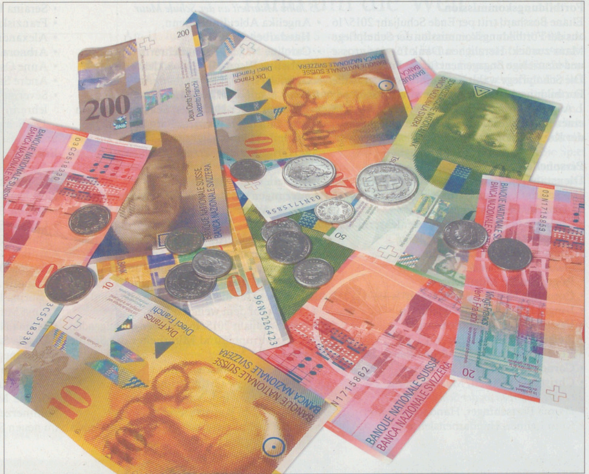
Das Generationenprojekt kostet bis zu 58,45 Mio. – eine Erhöhung des Steuerrufusses ist nicht vorgesehen.

Der Gemeinderat geht in seiner Finanzplanung davon aus, dass auch künftig Cashflows in der bisherigen Höhe erwirtschaftet werden. Die Jahresrechnung 2015 schliesst zwar mit einem hohen Rechnungsdefizit deutlich schlechter ab als budgetiert,