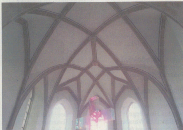
Torbogen zum Chor Kirche Maur.

ins Dickicht und Gestrüpp der Möglichkeiten und Anforderungen von Schule und Berufsausbildung. Ja, es braucht Mut, Unterstützung und Gottvertrauen, den eigenen Weg nicht nur zu suchen, sondern auch wirklich zu gehen. Ein Segensvers aus der Bibel soll die Konfirmandinnen und Konfirmanden, die im Konfirmationsgottesdienst zu Wort kommen, auf