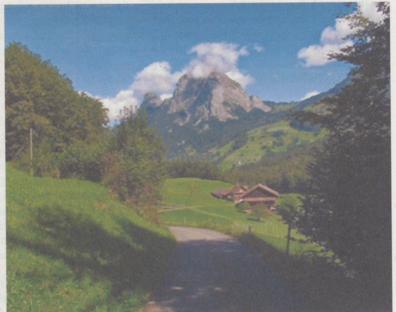
Die trutzigen Symbolberge der Zentralschweiz, die beiden Mythen.

Kosten: Halbtax Fr. 30.– / GA Fr. 15.– (inkl. Fahrkosten, Kaffee/ Gipfeli und Unkostenbeitrag Fr. 8.–)