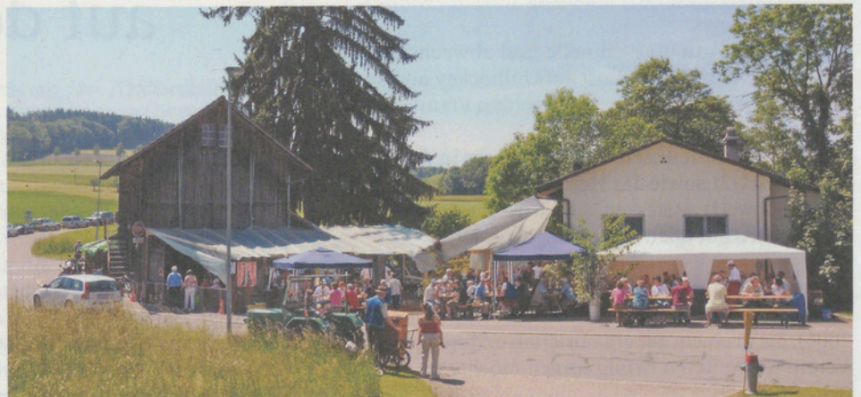
Das beliebte Schlachthüüsli-Fäscht auf der Forch.