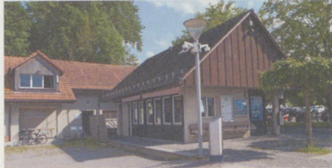
Vandalismus – auch in Maur ein Thema.

In der Nacht vom Sonntag, dem 22., auf Montag, 23. Mai 2016, gab es laut meh-