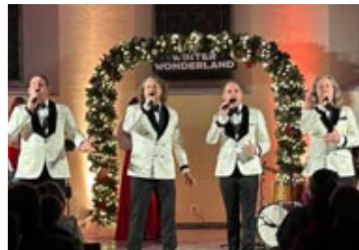
Klänge, die unter die Haut gehen.

Seit über 12 Jahren präsentieren die vier Künstler mit viel Freude, Schalk und Können Evergreens, Popsongs, Schlager, Liedgut, Filmklassiker sowie Werke aus Operette und Oper. Ihre Konzerte und die überaus erfolgreichen Weihnachtstourneen sind meist aus-