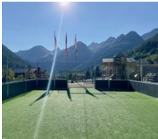
Das neue Zuhause des Spielfeldes in Wiler (VS)

Vor einigen Jahren verkaufte die Firma Kunstrasen- profi Schweiz AG der Gemeinde Lindau ein Spielfeld. Doch das Projekt stiess nicht bei allen Einwohnerin-