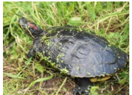
Die Rotwangen-Schmuckschildkröte, eine von mehreren Schmuckschildkröten-Arten, stammt aus Amerika. Da sie bei uns invasiv ist und der Artenvielfalt schadet, wurde sie auf die Liste der verbotenen Tierarten gesetzt.

In einem anderen Naturschutzgebiet der Stadt Illnau-Effretikon tauchten vor ein paar Jahren Schmuckschildkröten auf (die genaue Identifikation ist noch ausstehend). Schon an vielen Orten in der Schweiz wurden Schmuckschildkröten gesichtet. Oft wurden die Tiere illegal ausgesetzt – vielleicht, weil das Terrarium zu klein wurde oder die Besitzer der hübschen, aber sehr langlebigen Tiere ganz einfach überdrüssig wurden. Vielleicht hatten die Tierhalter sogar das Gefühl, dem Haustier etwas Gutes zu tun, indem sie es in die Freiheit entliessen. Tatsächlich