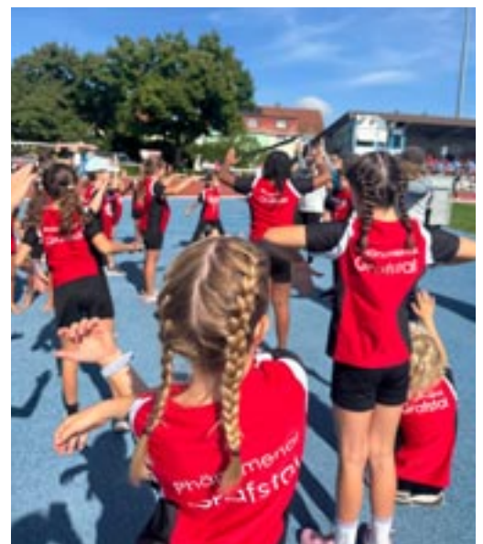
Aufwärmen, vor's los geht.

Schluss kam die spannende Pendelstafette, bei der alle Kinder noch einmal alles gaben, um möglichst schnell ins Ziel zu kommen. Man merkte deutlich, dass alle sehr motiviert waren. Jeder versuchte, das Beste herauszuholen, und die Unterstützung im Team war riesig. Am Ende hat sich der Einsatz ausgezahlt: Die Juspo Grafstal konnte mehrere Podestplätze sowohl bei den Knaben als auch bei den Mädchen feiern. Zusätzlich gab es noch Auszeichnungen, die alle sehr stolz machten. Nach einem erlebnisreichen Tag fuhren wir gemeinsam wieder nach Hause. Der JTSST war für alle ein toller Anlass mit viel Sport, Freude und Teamgeist – und wir werden ihn sicher in guter Erinnerung behalten.