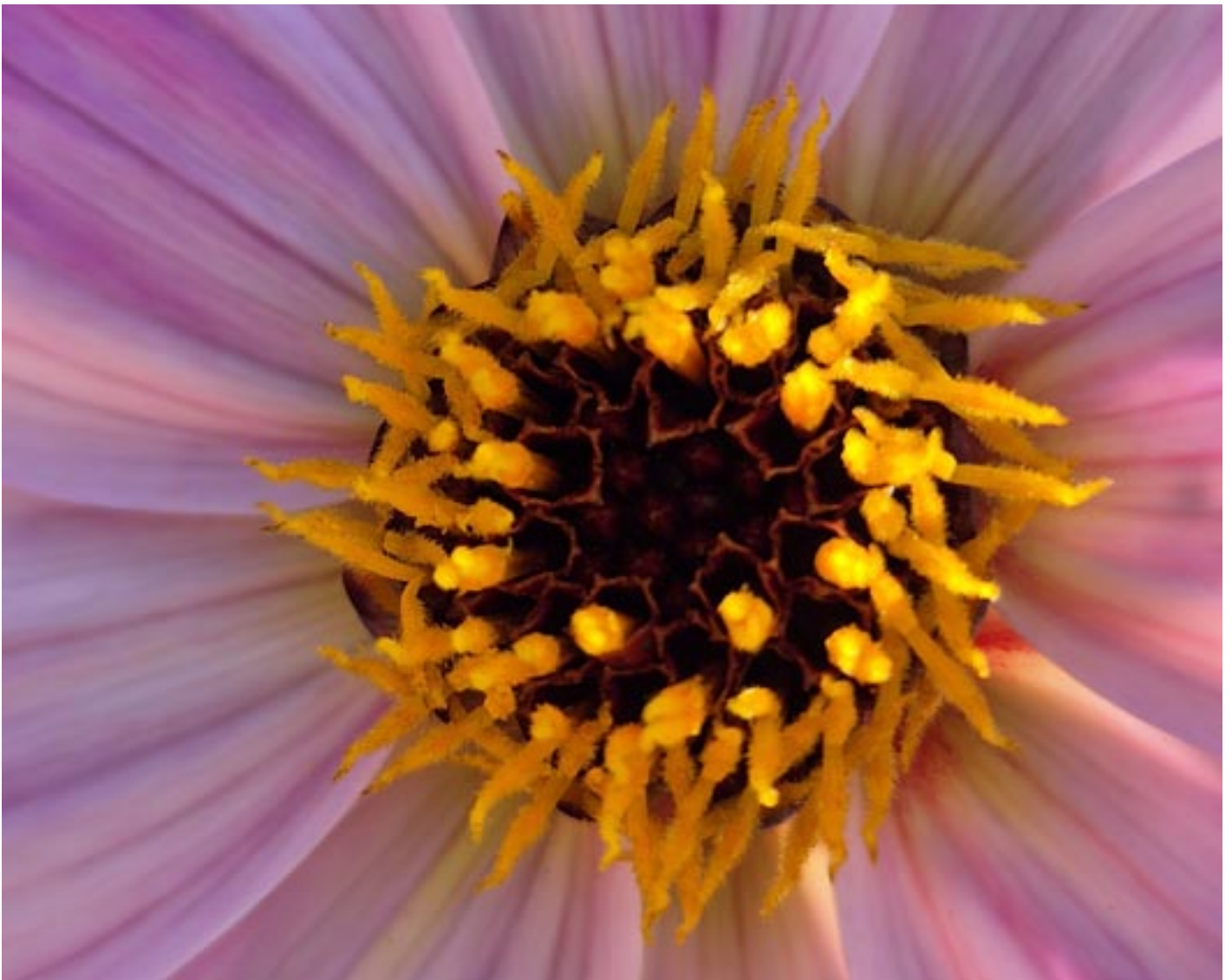
Der Sommer macht langsam dem Herbst Platz.