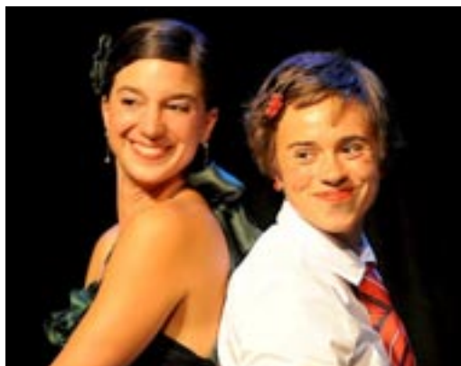
Musikkabarett vom Feinsten: Duo Luna-tic