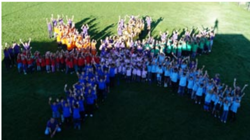
Farbenfrohe Schar des Schulhaus Buck