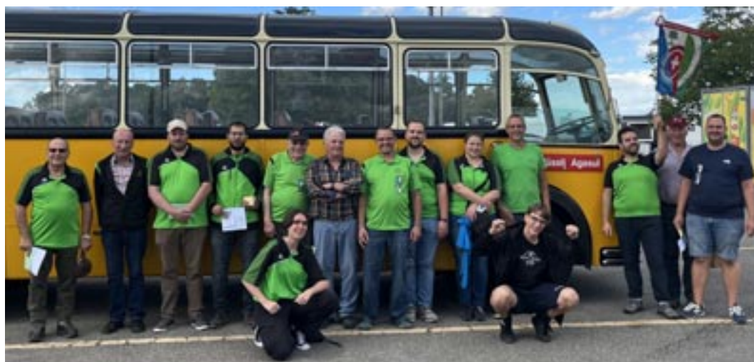
Der GSV unterwegs mit dem Oldtimer-Bus «Haifisch»