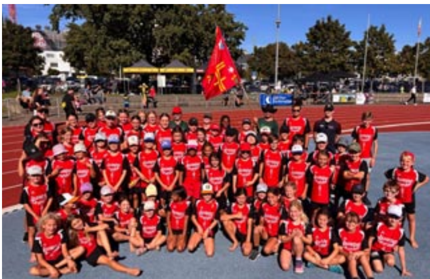
Das stolze Juspo-Team

Am Samstagmorgen trafen wir uns alle am Bahnhof in Effretikon. Die Freude war gross, denn wir fuhren gemeinsam mit dem Zug nach Winterthur, wo der JTSST stattfand. Schon auf der Reise war die Stimmung fröhlich und gespannt – alle waren neugierig,