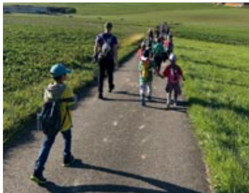
Eine fröhliche Schar unterwegs

Die Tage werden kürzer, die Temperaturen kühler und im Schulhaus Buck bedeutet das: Zeit für die traditionelle Herbstwanderung. Schon bevor die ersten Schritte auf den Wanderweg gesetzt wurden, führten die Schülerinnen und Schüler des Lernforums Interviews mit ihren Mitschülern. Gefragt wurde nach der Vorfreude, nach dem, was sie in den Rucksack packen, und nach dem, was ihnen an der Wanderung besonders gefällt. Einige dieser Stimmen werden hier vorgestellt.