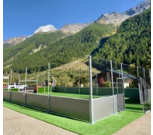
Einsatzbereit im neuen Zuhause

Nun hat das Unternehmen das Feld zurückgekauft. Statt weiterhin ungenutzt zu bleiben, soll es bald dort Freude bringen, wo sie besonders gebraucht wird: im Walliser Dorf Blatten bei Wiler (VS). Dort verloren zahlreiche Kinder ihre Freizeitmöglichkeiten im Zuge eines Unglücks. Für sie wird das Spielfeld nun kos- tenlos aufgebaut – als neuer Treffpunkt zum Spielen und Toben.