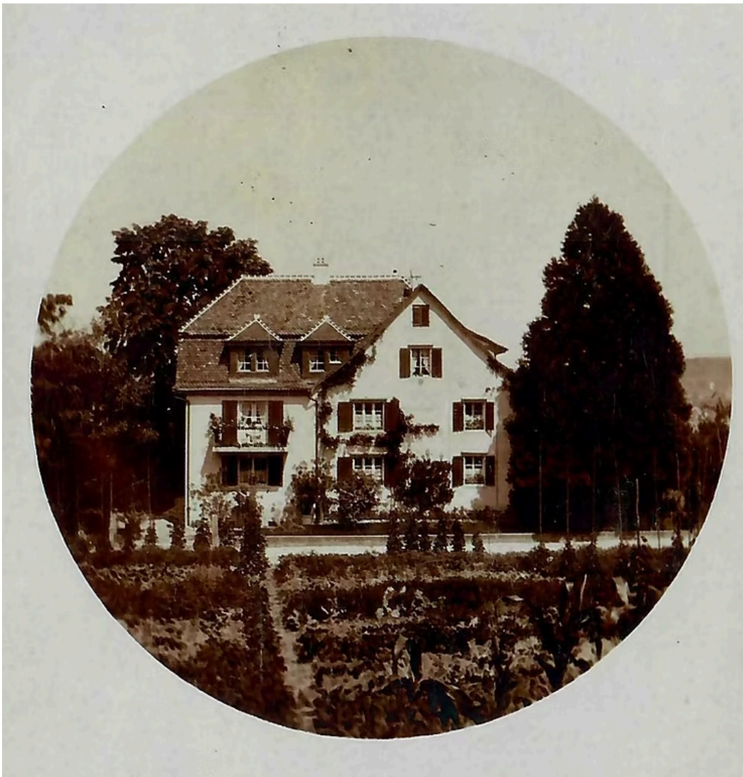
Cedernheim, Kilchbergstrasse 113 (früher 85), von Süden, um 1900.