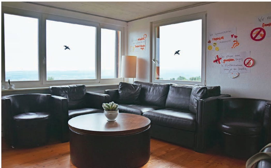
Beste Aussicht: Die Wohngruppe ist ein Ort, wo man auch zur Ruhe kommen kann.