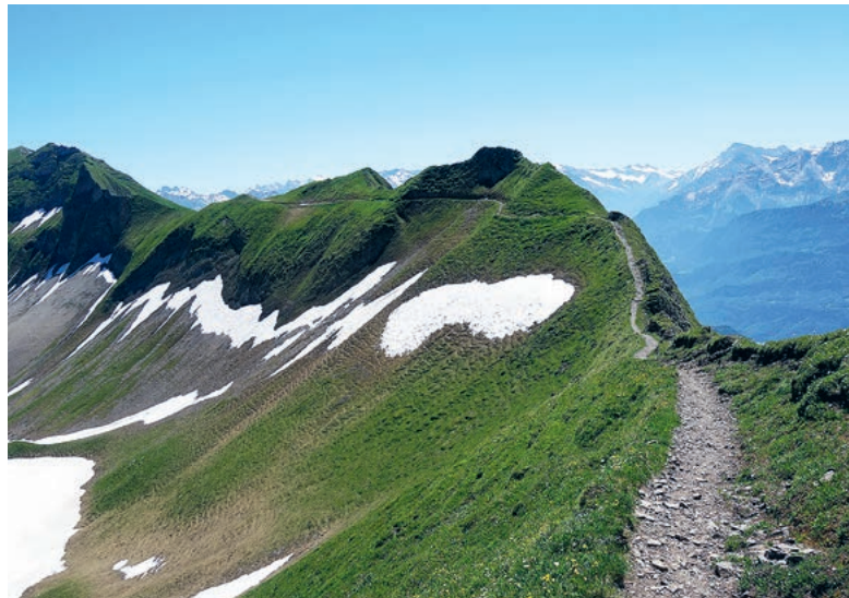
Vom Gipfel aus hat man schöne Sicht auf die Berner Hochalpen.