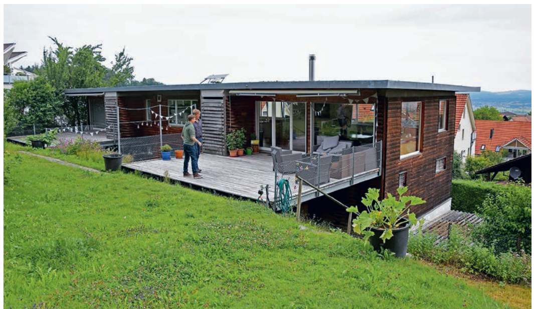
Das Haus der Wohngruppe Binz liegt in einem ruhigen Wohnquartier.