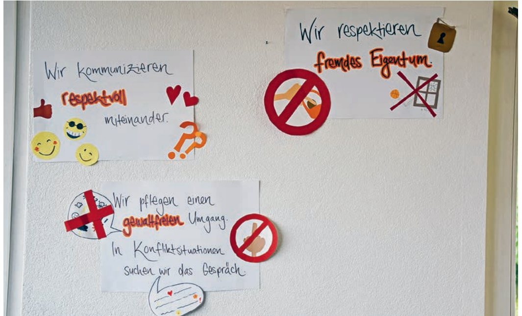
Verbindliche Regeln, die für alle gelten.