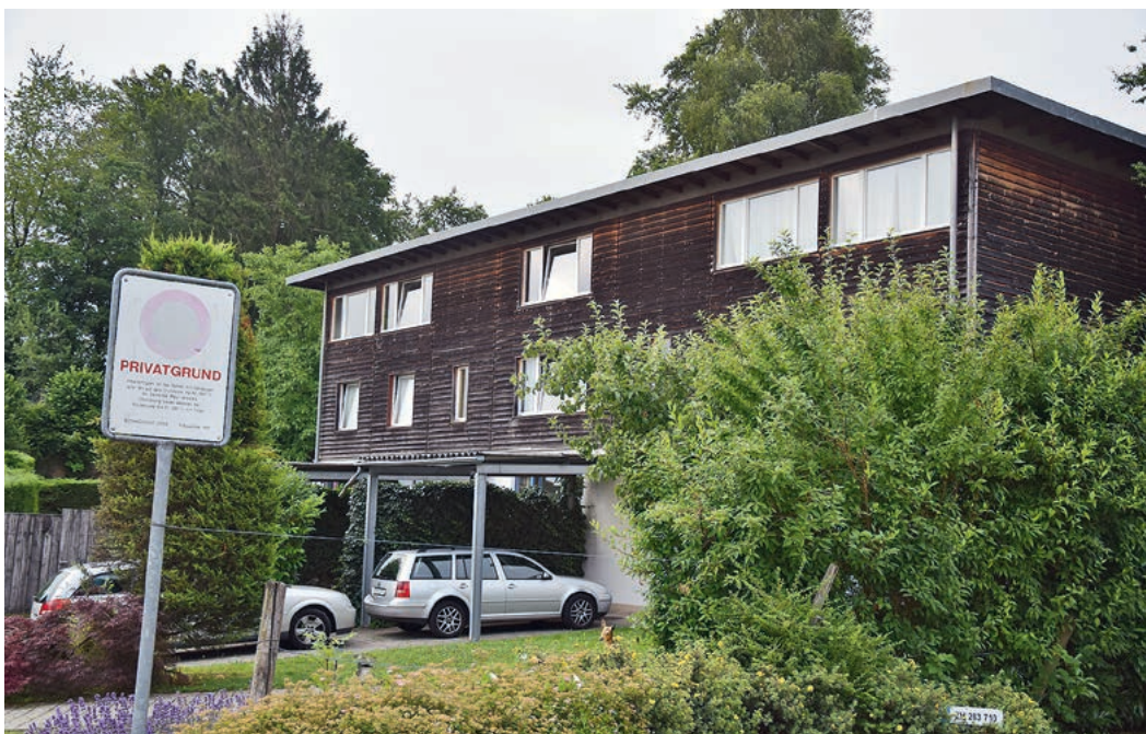
Hier wohnen derzeit sechs Jugendliche, die aus diversen Gründen aus ihrem familiären Umfeld ausgelagert wurden.

Das Jugendnetzwerk war zuerst ein privat initiiertes Verein und ist jetzt eine Stiftung, die