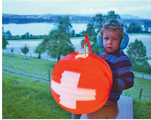
Happy Birthday, Schweiz!

Die wahre 1.-August-Feier mit grossem, würdigem Feuer, dem schönsten Maurmer Cachet und vielen lauschigen Ecken befindet sich seit Jahren