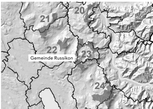
Kartenausschnitt Potentialgebiete Windenergie

Im Zürcher Oberland liegen mit zwölf dieser Potenzialgebiete gut ein Viertel aller möglichen Standorte im Kanton. Die Gemeinde Russikon ist im Zürcher Oberland mit drei möglichen Gebieten (Potentialgebiete Nr. 21 Furtbühl, Nr. 22 Schlossberg und Nr. 23 Hermatswil) stark betroffen. Insgesamt sind in diesen drei Gebieten zwölf Turbinen mit einer Gesamthöhe von 220 Metern und Rotordurchmesser von 160 Metern geplant. Die Nabenhöhe einer solchen Anlage liegt in der Regel auf 140 Metern.