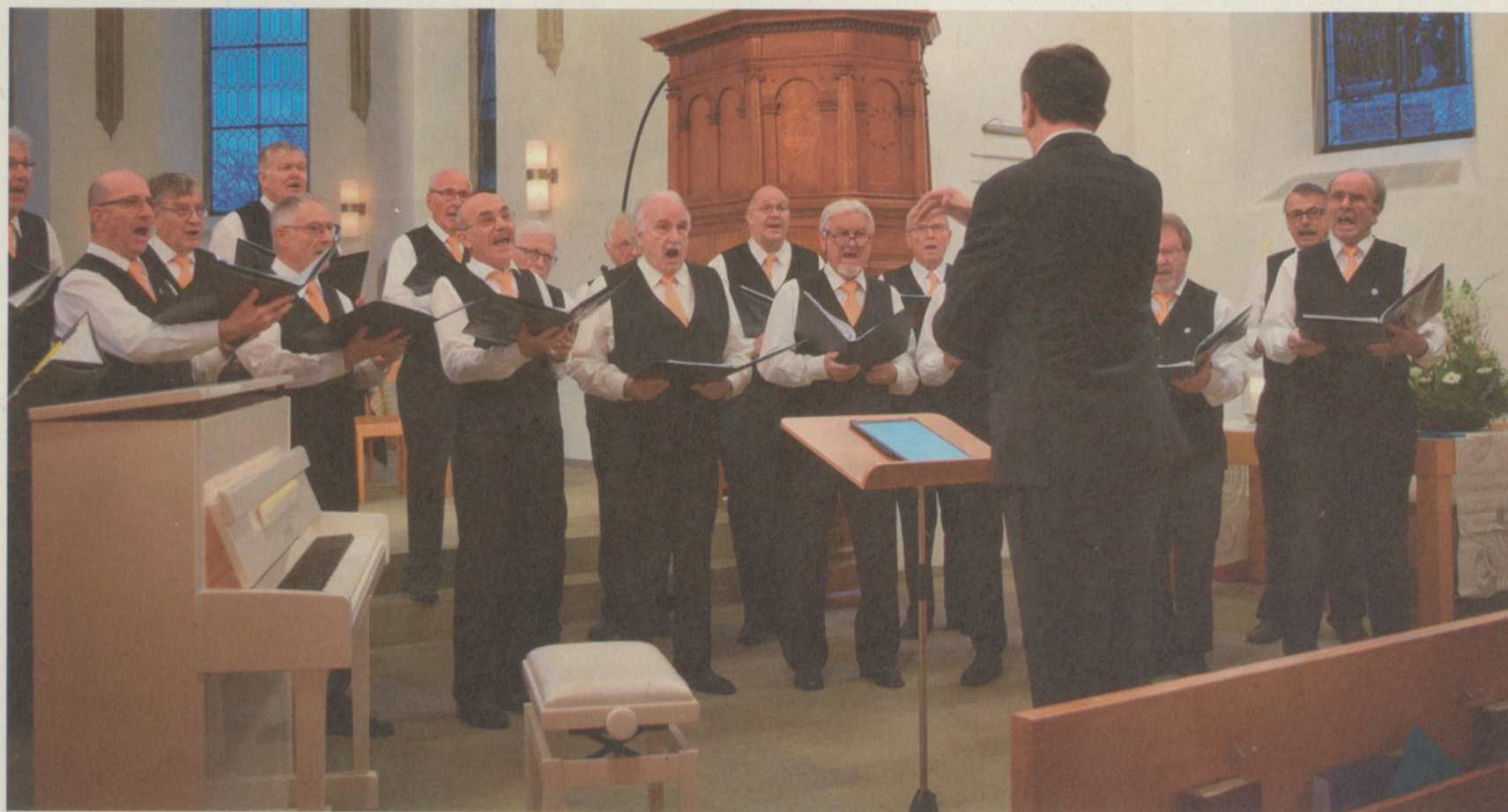
Die Sänger vom Männerchor singen mit einer grossen Lust, musikalische Extreme auszuprobieren.