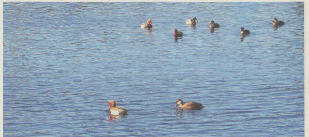
Auf den Spuren der Wasservögel auf dem Greifensee.