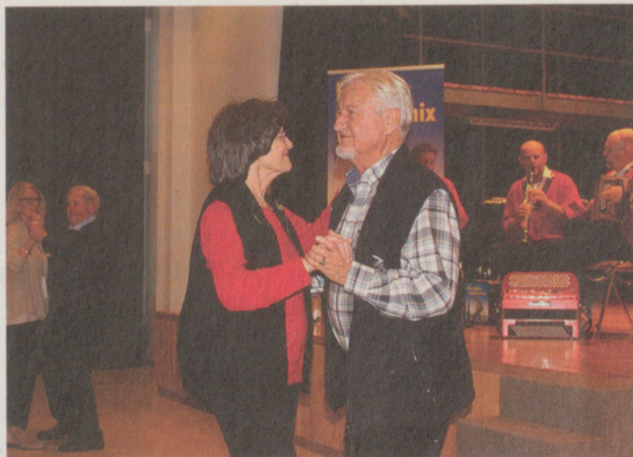
Schwungvolle Maurmer Senioren.

Im Bus traf ich schon auf eine sympathische, ältere Frau, mit der ich die Busfahrt hin durch etwas plauderte. Mir gefiel dieser Nachmittag jetzt schon! Er fing mit einer kleinen Einstimmung durch Giacomo Nett und Pfarrer Perrot an, wobei meine Augen eher etwas auf die Ländler Kapelle gerichtet waren: Vier Männer in einer