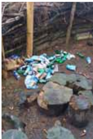
Abfallwüste beim Waldsofa der Spielgruppe «Zwergli» und des Kindergartens Winterberg.

Wer hat im Zeitraum zwischen dem 13. April bis 14. April Auffälligkeiten in der Nähe des Waldsofas beobachten können?