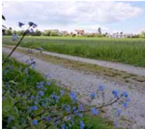
Das Gebiet Ölwis / Blankenwis in Winterberg

Bekanntlich sollen die Gebiete Ölwis und Blankenwis (siehe Bild), zentral gelegene Baugebiete in Winterberg, in den nächsten Jahren flächendeckend überbaut werden. Die einzelnen Testplanungen sehen gemäss den Informationen der Gemeinde 216 bis 320 Wohnungen und zwischen 380 und 420 Parkplätze (vor allem unterirdisch) für bis zu 700 zusätzliche Einwohnerinnen und Einwohner vor. Damit hätte der Ortsteil Winterberg fast doppelt so viele Einwohnerinnen und Einwohner wie heute.