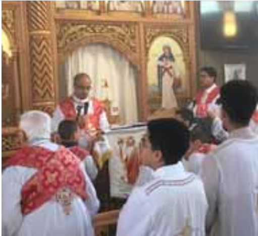
Die Bilderwand für den Altarraum wurde speziell für die Kirche Grafstal angefertigt.

Am Sonntag, 7. Juli findet in der Kirche Lindau kein Gottesdienst statt.