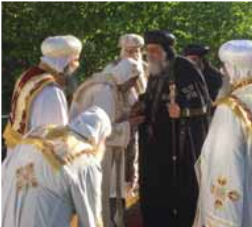
Das Oberhaupt der Koptischen Christen reiste aus Ägypten an.

Die koptische Kirche in Grafstal versetzt uns in eine andere, in eine orientalische Welt. Die wunderbare Ikonostase, Bilderwand, die den Altarraum abgrenzt, wurde eigens für die Kirche in Grafstal in Ägypten angefertigt. Weihrauch hängt in der Luft und die meist gesungene Liturgie verbindet buchstäblich Himmel und Erde. In einem fast fünfstündigen, von vielen Ritualen geprägten Gottesdienst, hat der koptische Papst die Ikonostase, den Altar und das Taufbecken mit Myron, einem heiligen Öl, gesalbt.