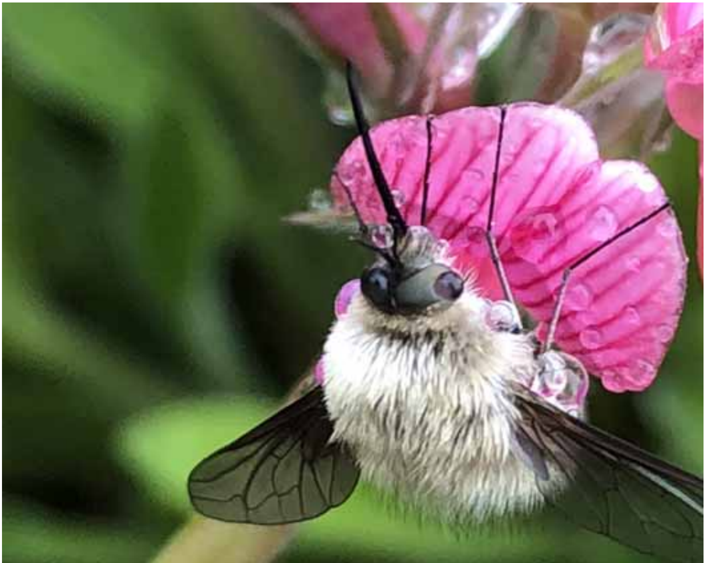
Die Sonne scheint, die Temperaturen steigen und auch die Insekten sind wieder unterwegs.