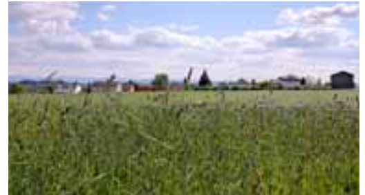
Die Überbauung soll sich ins Ortsbild einfügen.

Am 19. März 2019 wurde die IG Zukunft Winterberg gegründet. Ihre Mitglieder sind direkte Anrainerinnen und Anrainer an die Gebiete Ölwis und Blankenwis sowie Einwohnerinnen und Einwohner des Dorfs Winterberg. Die IG Zukunft Winterberg umfasst aktuell nach der Gründung rund 30 Mitglieder.