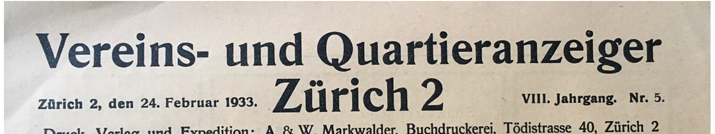
Vereins- und Quartieranzeiger Zürich 2, Ausgabe Februar 1933. Sammlung MZ.

Wie kommt ein Stadtquartier zu einem Lokalblatt? Alle Wollishofer Zeitungsleser des beginnenden 20. Jahrhunderts dürften als Tageslektüre eine Stadtzürcher Zeitung gelesen haben, etwa den parteiunabhängigen «Tages-Anzeiger», die freisinnige NZZ, die demokratische «Zürcher Post», das sozialdemokratische «Volksrecht» oder die katholische «Neue Zürcher Nachrichten». Doch diese berichteten kaum über Wollishofer Belange. Vor allem die Vereine vermissten für ihre Bedürfnisse ein quartierbezogenes Publikationsorgan, weshalb spätestens nach dem 1. Weltkrieg Anläufe für ein solches belegt sind. Das früheste, von dem ich Kenntnis habe, ist der Quartier- und Vereinsanzeiger Zürich 2, der anfangs 1926 lanciert wurde. Er richtete sich vor allem an Vereine, nannte sich «Offizielles Publikationsorgan der Vereine in Enge, Wollishofen und Leimbach», schaltete aber viele Inserate von Quartiergewerbe etc. Indes, so scheint es, hatte das Blatt nicht genug Erfolg. Die letzte Ausgabe, die mir vorliegt, stammt vom Februar 1933.