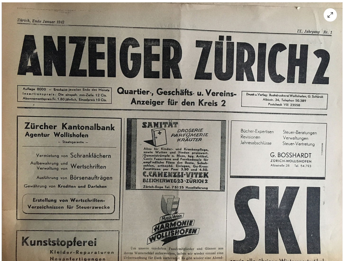
Anzeiger Zürich 2. Januar 1942 (IX. Jahrgang).

gleichzeitig, jedenfalls in den 1940er Jahren, steuerte dieser eigene Geschichten bei, die der Vater gerne ins Blatt aufnahm.