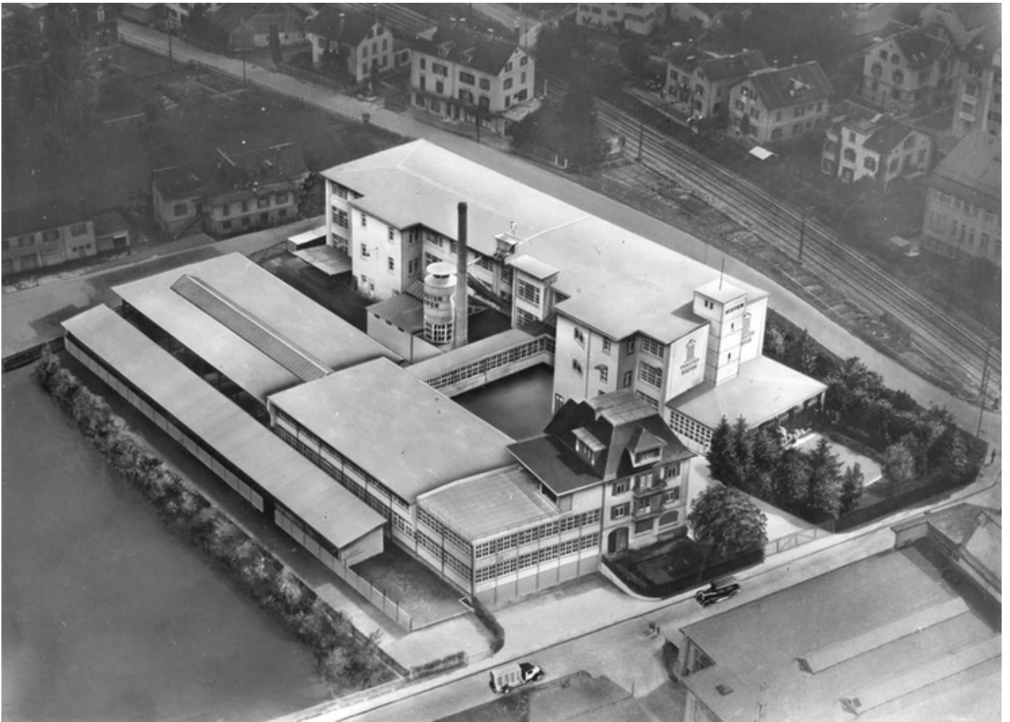
Bachstrasse 8-10: Kiefer Fensterfabrik (Weisse Fabrik). Undatierte Aufnahme.

Auf dem Foto oben ist die Kiefer Fensterfabrik mit dem Wohnhaus zu sehen. Für einen Bau des Jahres 1909/1910 wirkt das Gebäude sehr funktional, fast wie moderne Bauhaus-Architektur. Noch heute scheint das Haus jünger als es ist. Die Aufnahme ist zwar nicht datiert, sie muss aber vor 1938 aufgenommen worden sein, denn der rechts noch knapp erkennbare Bahnübergang wurde in jenem Jahr durch die Unterführung ersetzt.