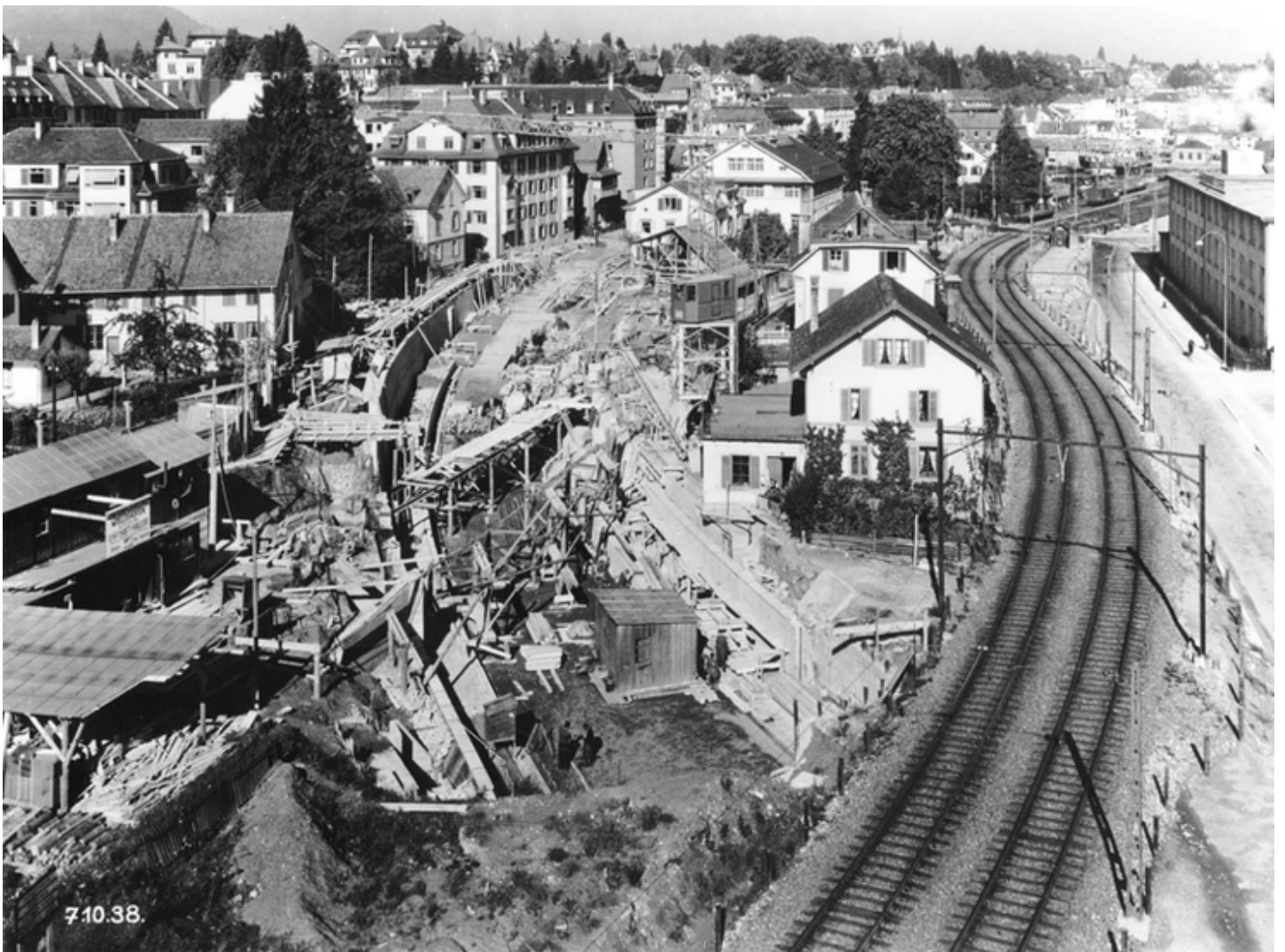
Bau der Unterführung Seestrasse, Wollishofen. 1938.

Mitte der 1980er Jahre wurde an der Bachstrasse ein Projekt vorangetrieben, das bei einem erfolgreichen Verlauf den Abbruch der Weissen Fabrik bedingt hätte: es wurde an der Bachstrasse die Errichtung eines mondänen Seehotels geplant. Die Betriebsleitung der Fensterfabrik hatte in den Verkauf ihrer Liegenschaft eingewilligt, in der nötigen Volksabstimmung wurde das Projekt allerdings verworfen. Dennoch wurde der Betrieb der Fensterfabrik von Wollishofen abgezogen. Seither nutzen verschiedene Firmen und Projekte das schöne Fabrikareal am See.