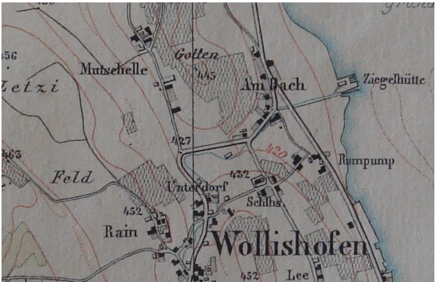
Wildkarte 1840er. Ausschnitt Wollishofen Am Bach.

Doch die Wildkarte zeigt schon Innovationen des 19. Jahrhunderts, die die alte Siedlung der Köchli-Häuser noch nicht kannte: Eine ausgebaute Landstrasse gegen den Albis hin – die heutige Albisstrasse – sowie eine neue Strasse entlang dem See, nahe am Ufer – vorher ging die Landstrasse über den Kilchbergsteig an der Kirche vorbei der heutigen Kilchbergstrasse entlang gegen Süden. In früherer Zeit war aber die Fläche gegen den See hin noch völlig frei und unverbaut. Und zum See, zur Ziegelhütte am See, führte nur ein Fussweg. Das änderte sich Mitte des 19. Jahrhunderts, und nochmals mit dem ersten Eisenbahnbau 1875. Da wurde der See zurückgedrängt, Häuser rückten näher zum See, die Bachstrasse wurde vom Fussweg zur fahrbaren Strasse ausgebaut, an der auch neue Häuser zu liegen kamen.