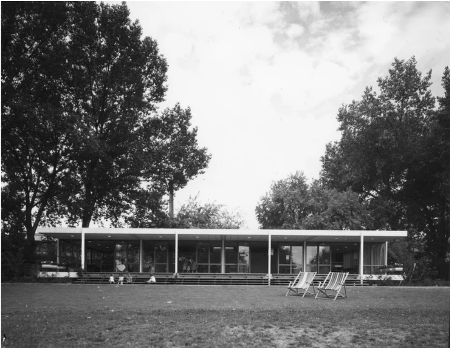
Bachstrasse 7, Gemeinschaftszentrum. 1962.