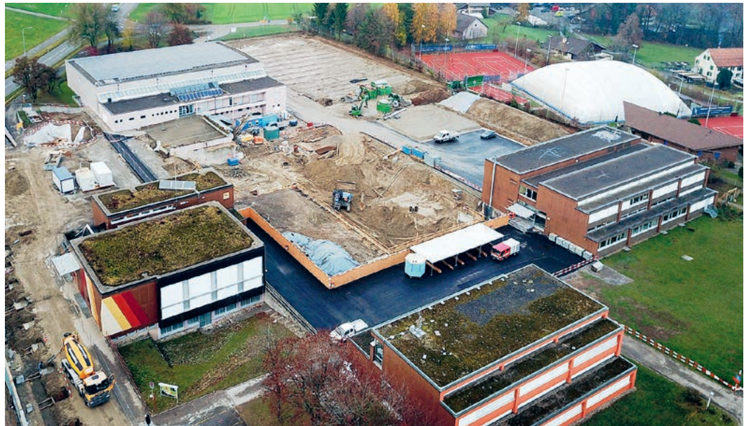
Auf der Looren wird die Baugrube für das Schulhaus Nord ausgehoben.

Entspannt hat sich die Parkplatzsituation für die Nutzer der Loorenanlage. Nachdem zwei-