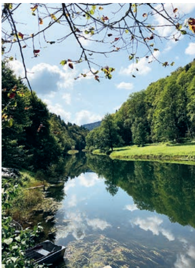
Grenzlandschaft Schweiz-Frankreich (La Bouège, am Doubs)

In der Predigtreihe «Landschaften» steht kein Buch aus der Bibel, sondern für einmal ein Thema im Zentrum. Die Bibel und unsere Erfahrung sind durchdrungen von Landschaften und der Erinnerung an sie. Wo wir zu Fuss unterwegs sind, verändert sich eine Landschaft langsam vor unseren Augen. Dann