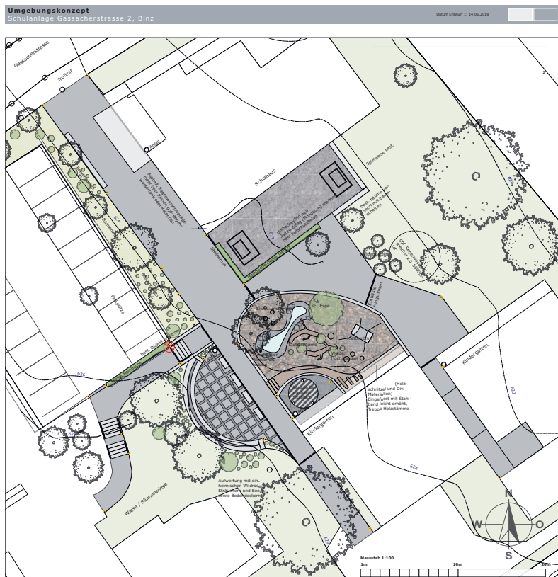
Neues Umgebungskonzept mit Spielinsel und Unihockeyfeld.