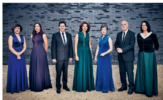
Solistenensemble aus der Surselva.

Aktuelle Informationen zur Baustelle und zu den öffentlich zugänglichen Bereichen sind auf www.looren.info abrufbar. Die Projektwebsite dokumentiert mit Fotos und Drohnenaufnahmen auch, wie sich die Baustelle laufend entwickelt.