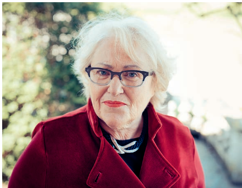
Team Frauenfrühstücks-Treff Julia Onken hat zahlreiche Bestseller geschrieben.