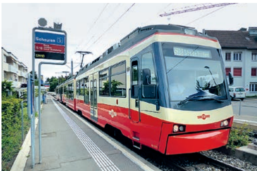
Wichtige Verkehrsader: die Forchbahn.

Wie der Betrieb mitteilt, ist nach 15 Jahren die «Lebensmitte» des Rollmaterials erreicht und eine Revision für mindestens nochmals 18 Jahre Betriebssicherheit angezeigt. Eine Anschaffung