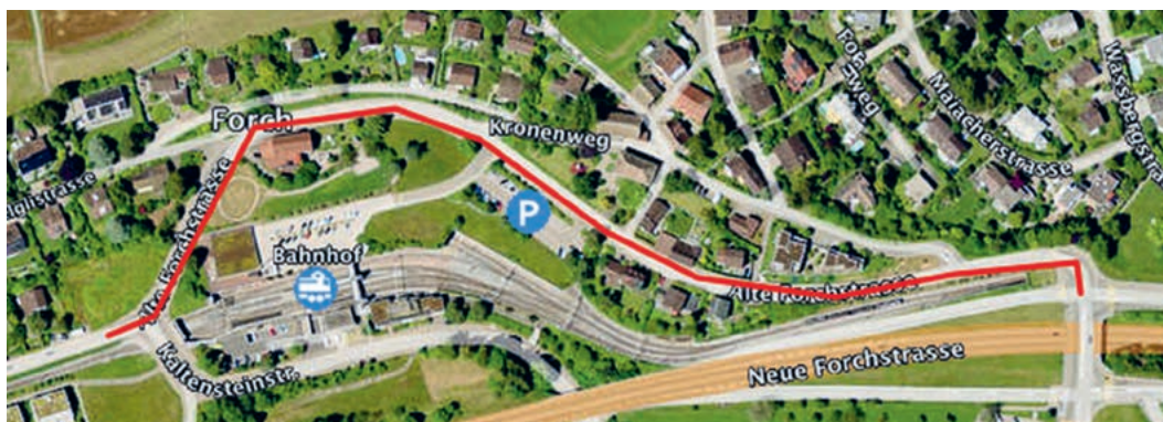
Die geplanten Arbeiten erfolgen in Etappen.