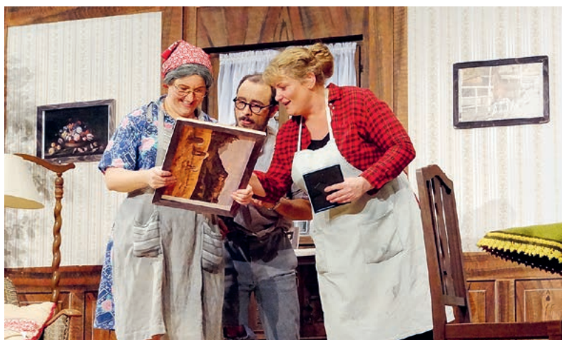
Schauspiel und Tanz – im Loorensaal bot sich den Zuschauern ein kurzweiliges Spektakel.