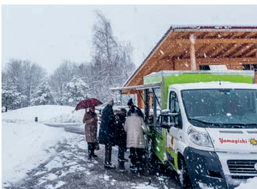
Besuch vom Dorfladen auf Rädern.

Erstmals besuchte uns der mobile Hofladen im Dezember und Anfang Januar. Die Besucher der