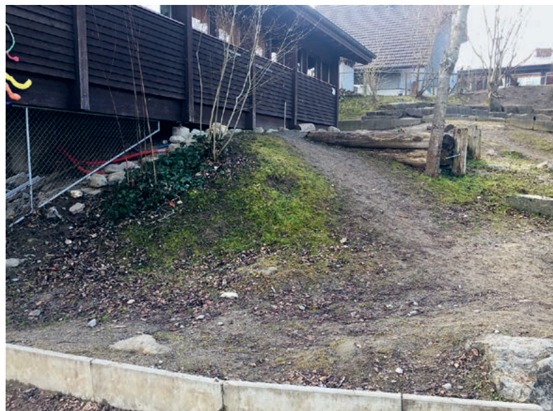
So präsentiert sich der Spielplatz heute.