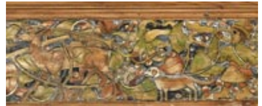
Jagdszene. Ausschnitt aus dem Original-Deckenfries im Landesmuseum Zürich.