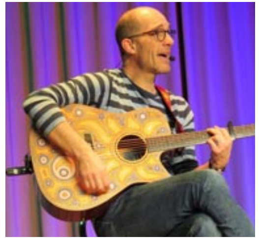
Verzaubert seit Jahren Kinder im ganzen Land: Andrew Bond.

Am Mittwoch, dem 11. März, erlebten die Kinder vom Kindergarten bis zur 4. Klasse einen ganz besonderen Morgen im Bucksaal: Andrew Bond, der bekannte Liedermacher aus Wädenswil, kam nach Tagelswangen. Es fanden zwei Konzerte für die Primarschule Lindau, also für beide Schulhäuser Buck und Bachwis statt, eines für die jüngeren Kinder bis zur 1. Klasse und anschliessend ein zweites für die Schülerinnen und Schüler bis zur 4. Klasse. Beim Konzert sassen die Kinder klassenweise im Bucksaal,