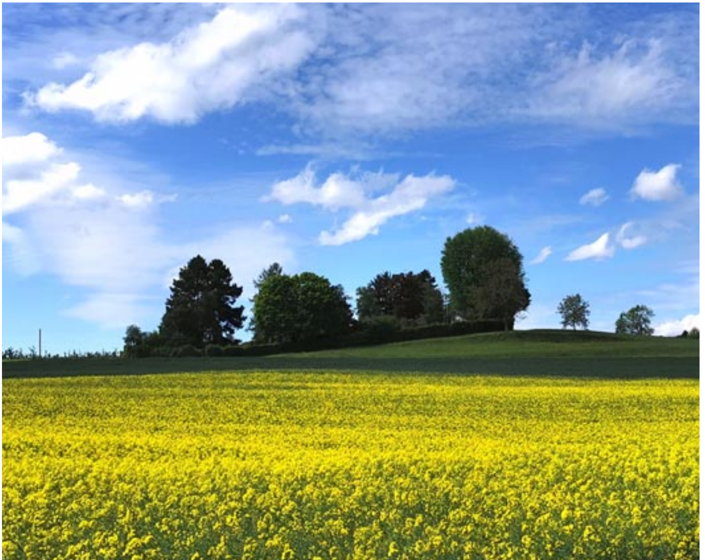
Leuchtendes Rapsfeld in Winterberg