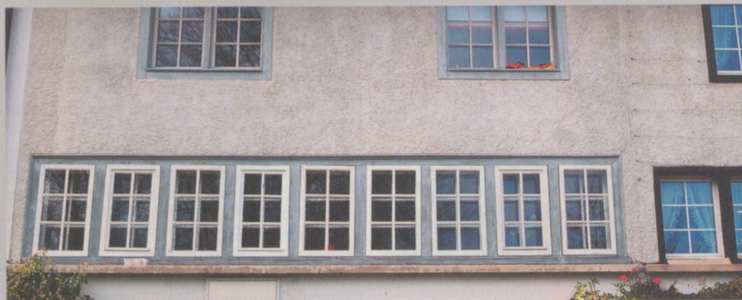
Die richtigen Fenster sind die «halbe Mieta» bei einem fachgerecht renovierten, denkmalgeschützten Haus.

Doch gibt es für die Erhaltung der historischen Bausubstanz überhaupt noch genügend Handwerker? «Das Angebot ist wieder besser und unser Amt beteiligt sich massgeblich daran, dass der Nachwuchs mit Kursen gefördert wird.» Schweizweit gebe es für den sorgfältigen Umgang mit Gebäuden inzwischen ein funktionierendes Netzwerk an sehr guten Steinmetzen, Schreibern, Malern und Zimmerleuten, welche die Arbeiten auf hohem Niveau verrichten könnten.