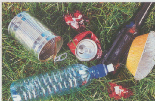
Liegen gelassene Abfälle: auch in Maur ein Thema.

Die Fragen sind überall ähnlich und Jahr für Jahr setzen zahlreiche Gemeinden und Schulen kreative Massnahmen gegen Littering um. Um das Wissen aus diesen Projekten für alle