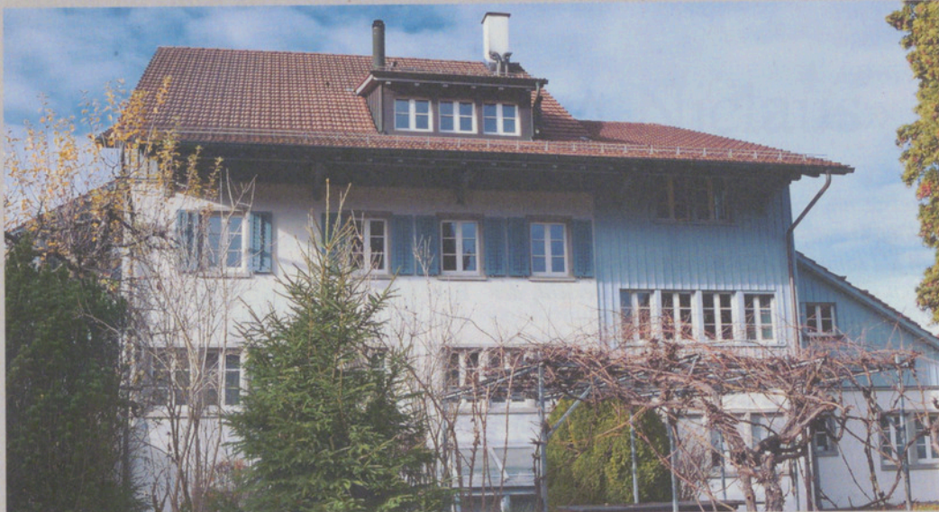
Aus Gründen des Ortsbildschutzes und nicht wegen der Denkmalpflege historisierend neu gebaut: Haus in Maur.

An einem weiteren Haus sehen wir diesen Mut – in Form einer älteren Sanierung, wo mit einem kleinen Sheddach-Fenster eine andersartige Lichtführung in ein Flarzhaus gebracht wurde. «Diese Lösung will ich nicht werten. Ich kann bloss feststellen, dass sie aus einer Zeit stammt, wo fast krampfhaft versucht wurde, bei