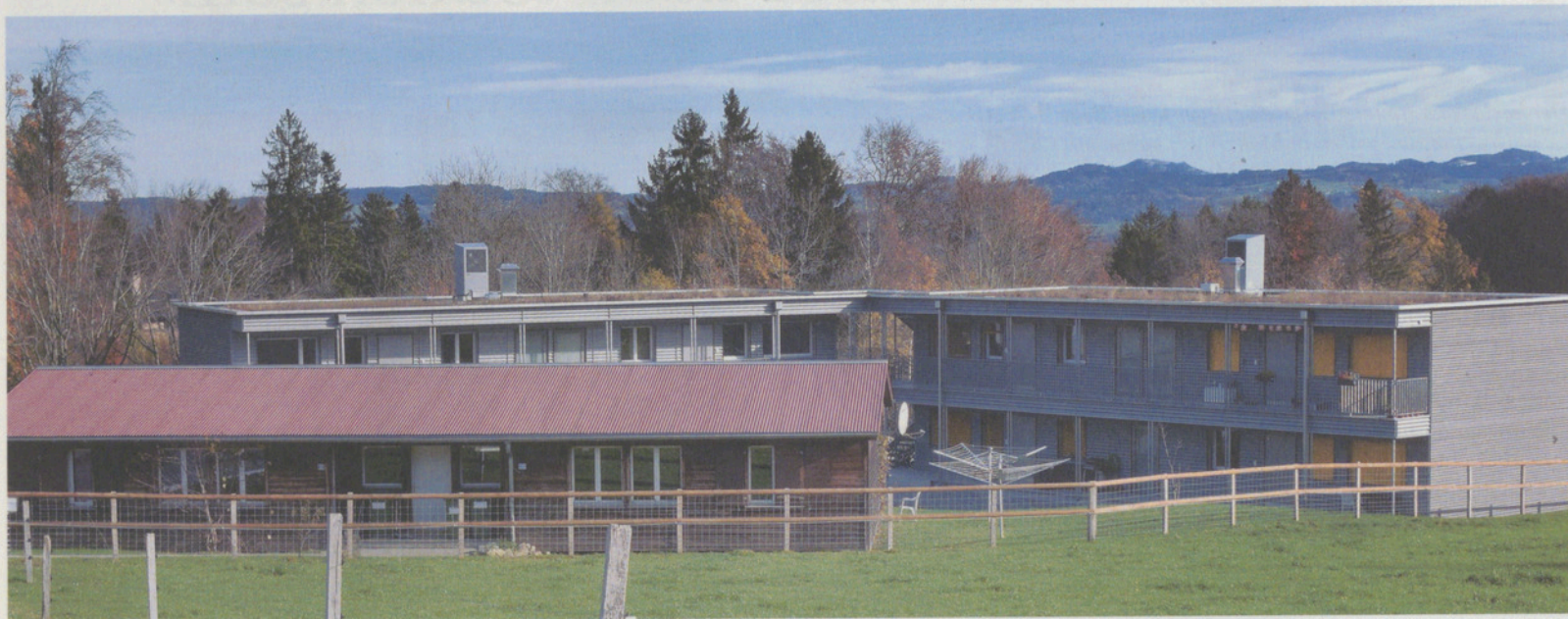
2016 entstanden die neuen Baracken für Personen im Asylbereich, in denen heute Familien und alleinerziehende Frauen mit Kindern leben.