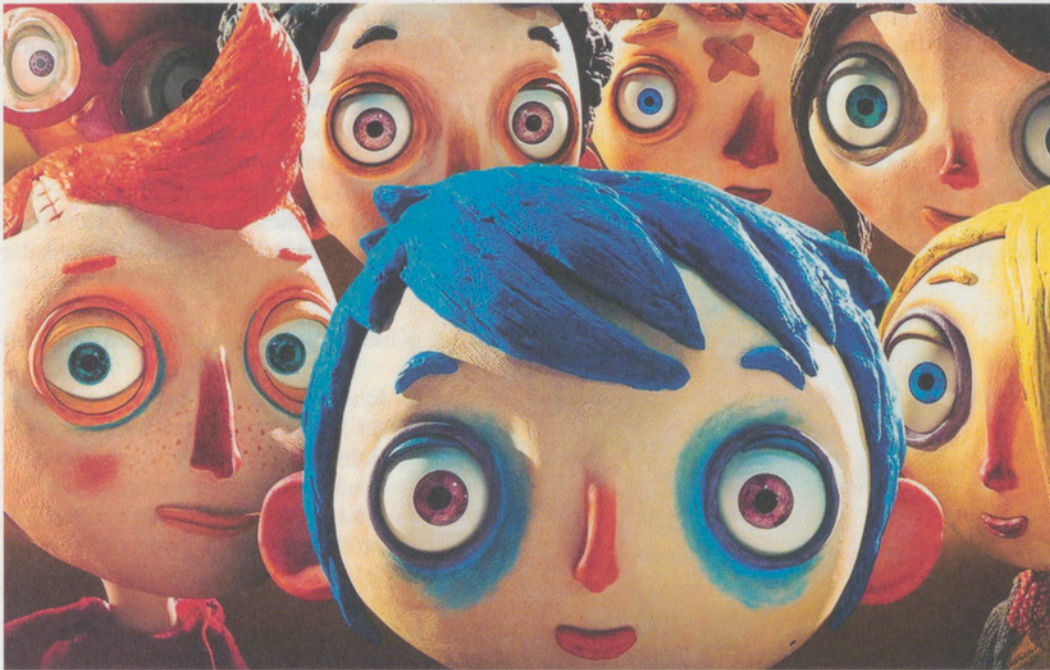
Der Waisenjunge Courgette (schweizerdeutsch: Zucchetti) wurde einst von seiner Mutter so genannt. Ein bewegender Animationsfilm von Claude Barras.

Courgette ist ein eher ungewöhnlicher Kosenamen – aber wenn er einem von der Mutter verliehen wurde und diese dann unerwartet stirbt, hängt man trotzdem daran.