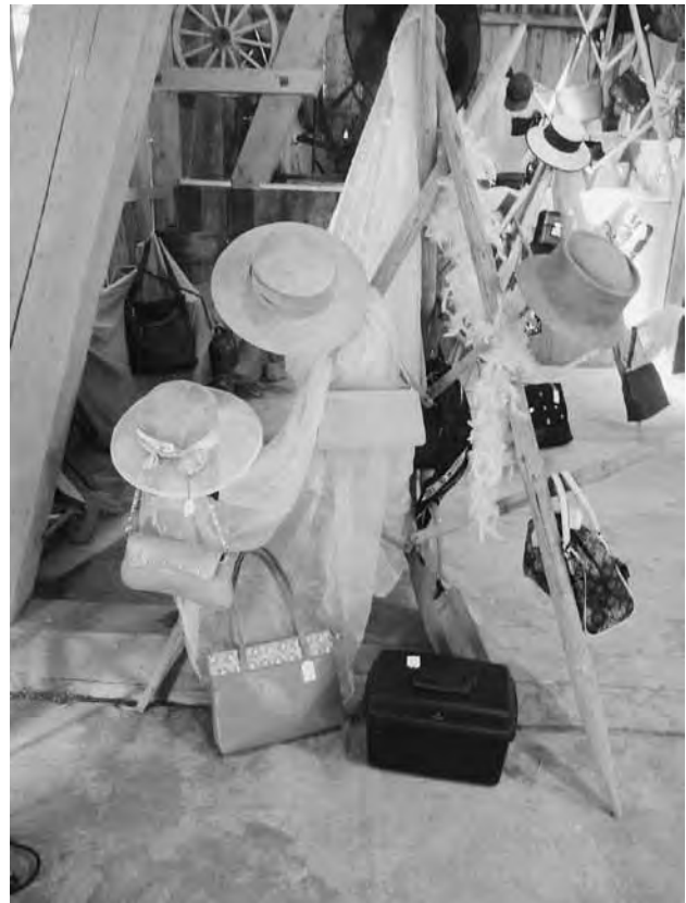
Handtaschen- und Hut-Börse