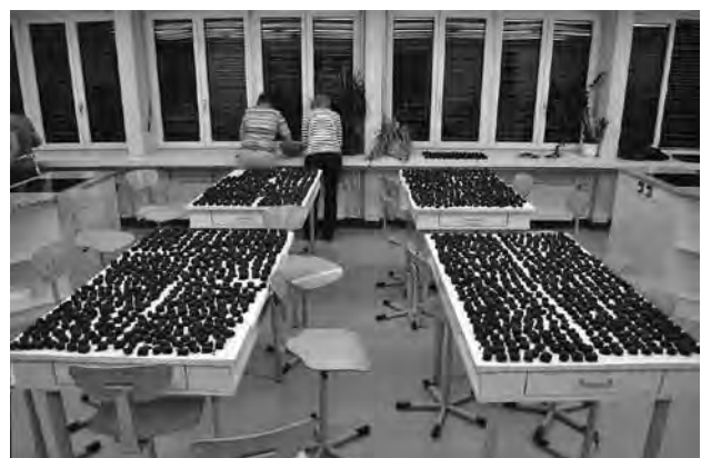
Magenbrot Produktion für den Russikermarkt