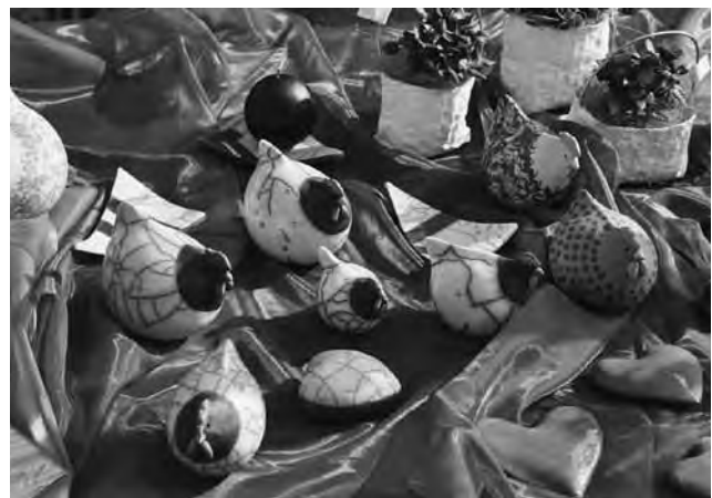
Angebot am Marktstand