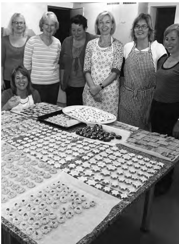
Gemeinsames «Guetzli» backen