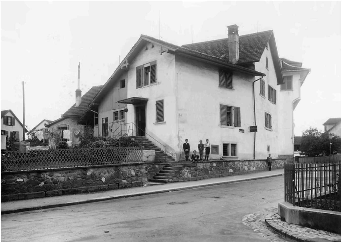
Albisstrasse 77 (Weinschenkhaus, erbaut 1728) und rechts versteckt das Lavaterhaus (BAZ 1927)