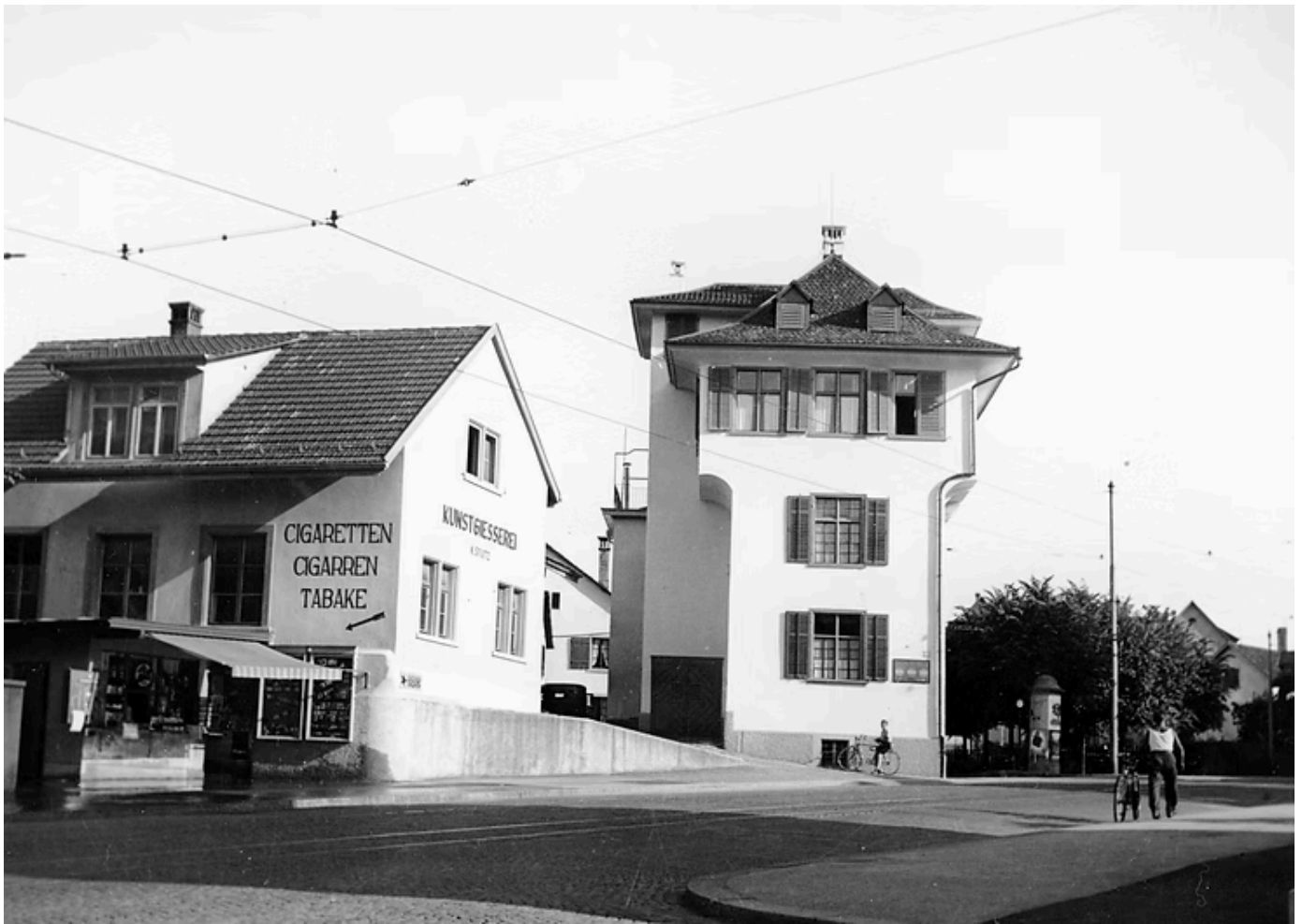
Links Albisstrasse 81, rechts das Lavaterhaus; das alte Weinschenkehaus wurde fürs Tram 1927 abgerissen.