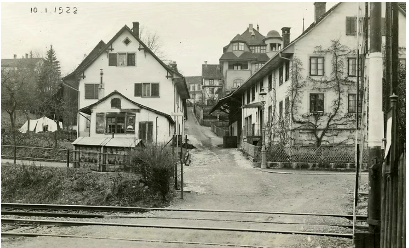
Haus Rumpump (23, später Rumpumpsteig 2), auf dem Foto rechts.