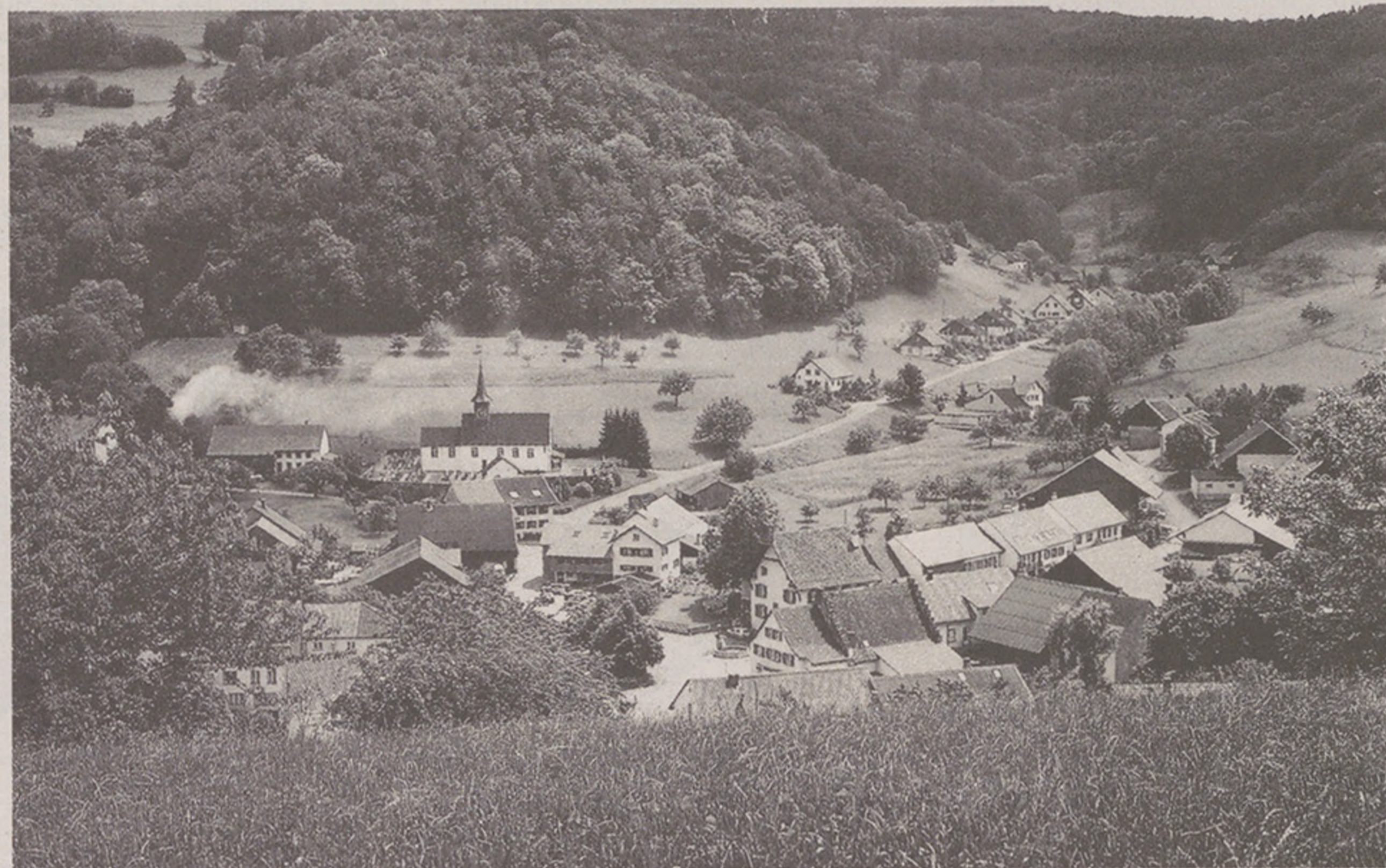
Kulturlandschaft Schenkenbergtal. Neben landwirtschaftlicher Nutzung, Weinbau und Forstwirtschaft hat die Natur viel Platz. Die kleinparzellierten Wiesen und Felder sind gesäumt von einzelnen freistehenden Bäumen. Eindrücklich sind die Buschgruppen, Hecken und Magerwiesen und die hochstämmigen Obstbäume.

Zum 50jährigen Jubiläum des Schoggitalers, lancieren seine Trägerorganisationen eine besondere Aktion. Statt einzelner Schutzobjekte wie bisher, wird erstmals eine ganze Tal-Landschaft zum gemeinsamen Natur- und Heimatschutzprojekt erklärt. Dies ist ein neuer Ansatz in der Tradition der goldenen Talerscheibe. Er könnte Schule machen.