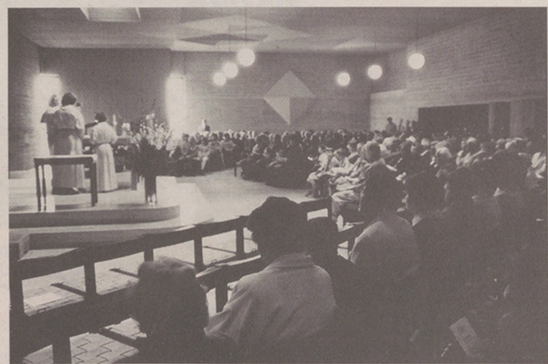
In der Kirche Heilig Geist wird am Sonntag der Kirchweihstag um 10 Uhr mit einer Festmesse gefeiert.

R.J. Am Sonntag, dem 1. September, feiert die katholische Pfarrei Heilig Geist Höngg ihren Kirchweihstag. Zu diesem Anlass kommt die beliebte Ländler-Messe «Paxmontana» für gemischten Chor und Ländlerkapelle zur Aufführung.