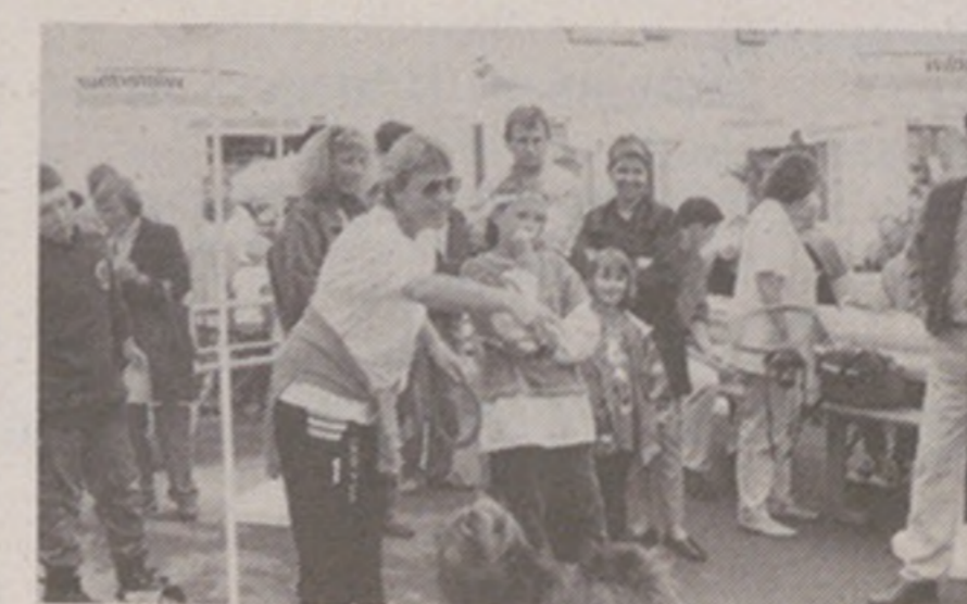
Wau, wau – war das schwierig!

treffen. Und siehe da, als Belohnung durfte der geschickte Werfer oder die Werferin einen Mohrenkopf auffangen. Anschliessend hatte man Gelegenheit, die Geschicklichkeit weiter zu testen und zwar beim Ringwerfen bei der «Winterthur». Schwierig war nur, dass sich das Rad langsam aber stetig um die eigene Achse drehte. Man benötigte also einiges an Fingerspitzengefühl, um die Ringe zu plazieren.