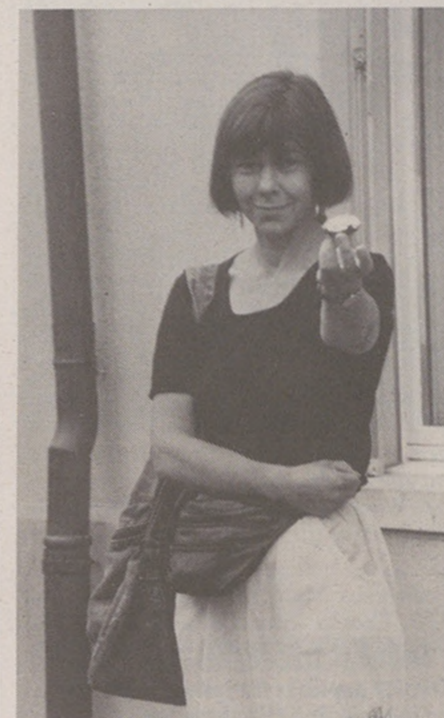
Gut getroffen – Mohrenkopf genossen!