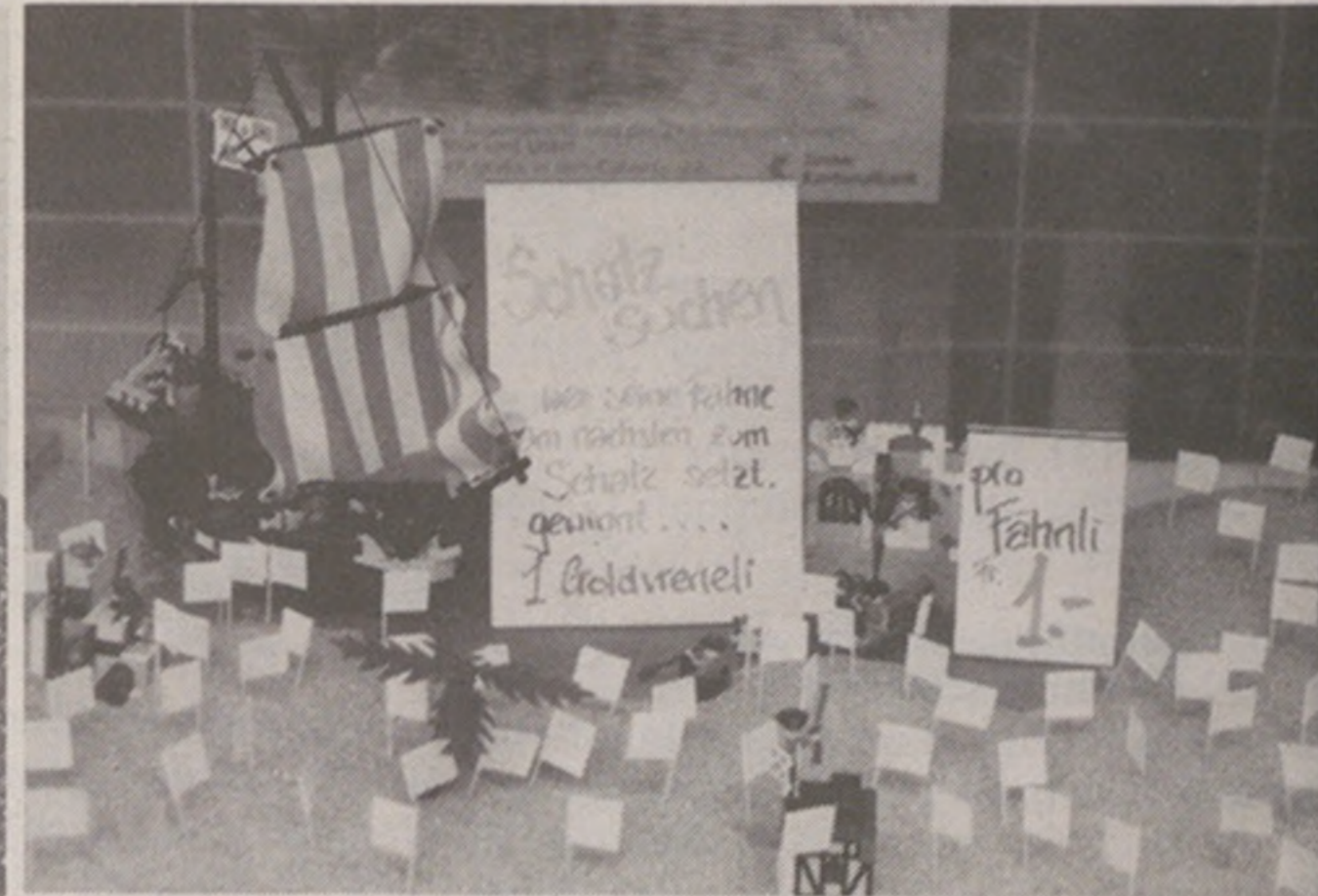
Schatzsuche – Goldvreneli – bei der Apotheke im Brühl.

treffen. Und siehe da, als Belohnung durfte der geschickte Werfer oder die Werferin einen Mohrenkopf auffangen. Anschliessend hatte man Gelegenheit, die Geschicklichkeit weiter zu testen und zwar beim Ringwerfen bei der «Winterthur». Schwierig war nur, dass sich das Rad langsam aber stetig um die eigene Achse drehte. Man benötigte also einiges an Fingerspitzengefühl, um die Ringe zu plazieren.